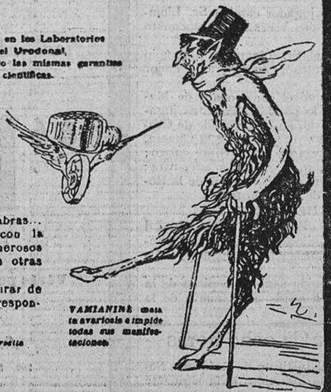
VAMIANINE cura la avariosis e impide todas sus manifestaciones.

Exigir la marca depositada: EL HOMBRE DE LAS TENAZAS.