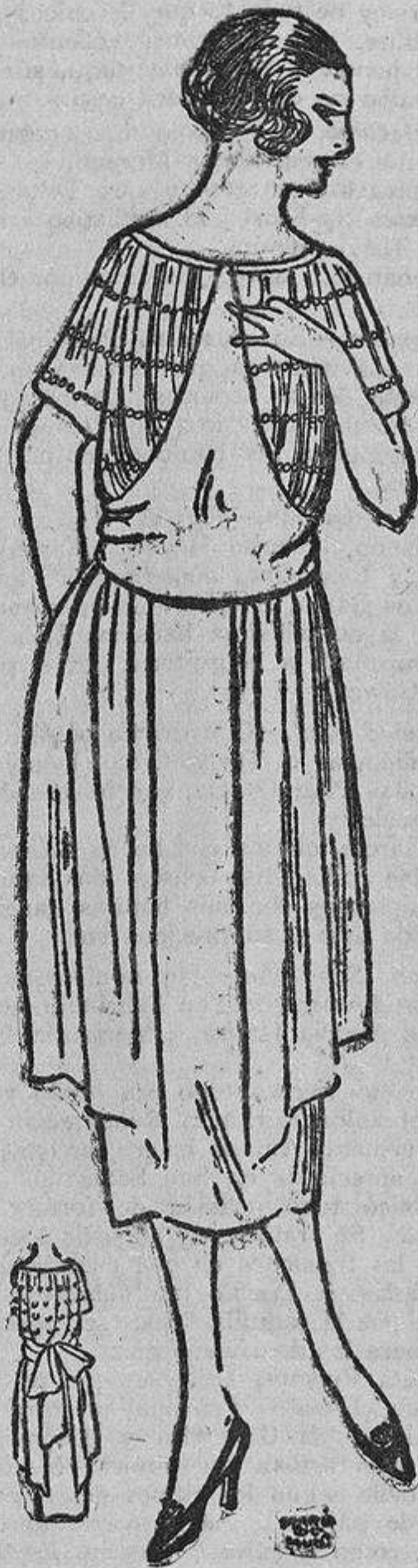
Es un traje entero, pero el cuerpo puede proclamarse su independencia y convertirse en una blusa.