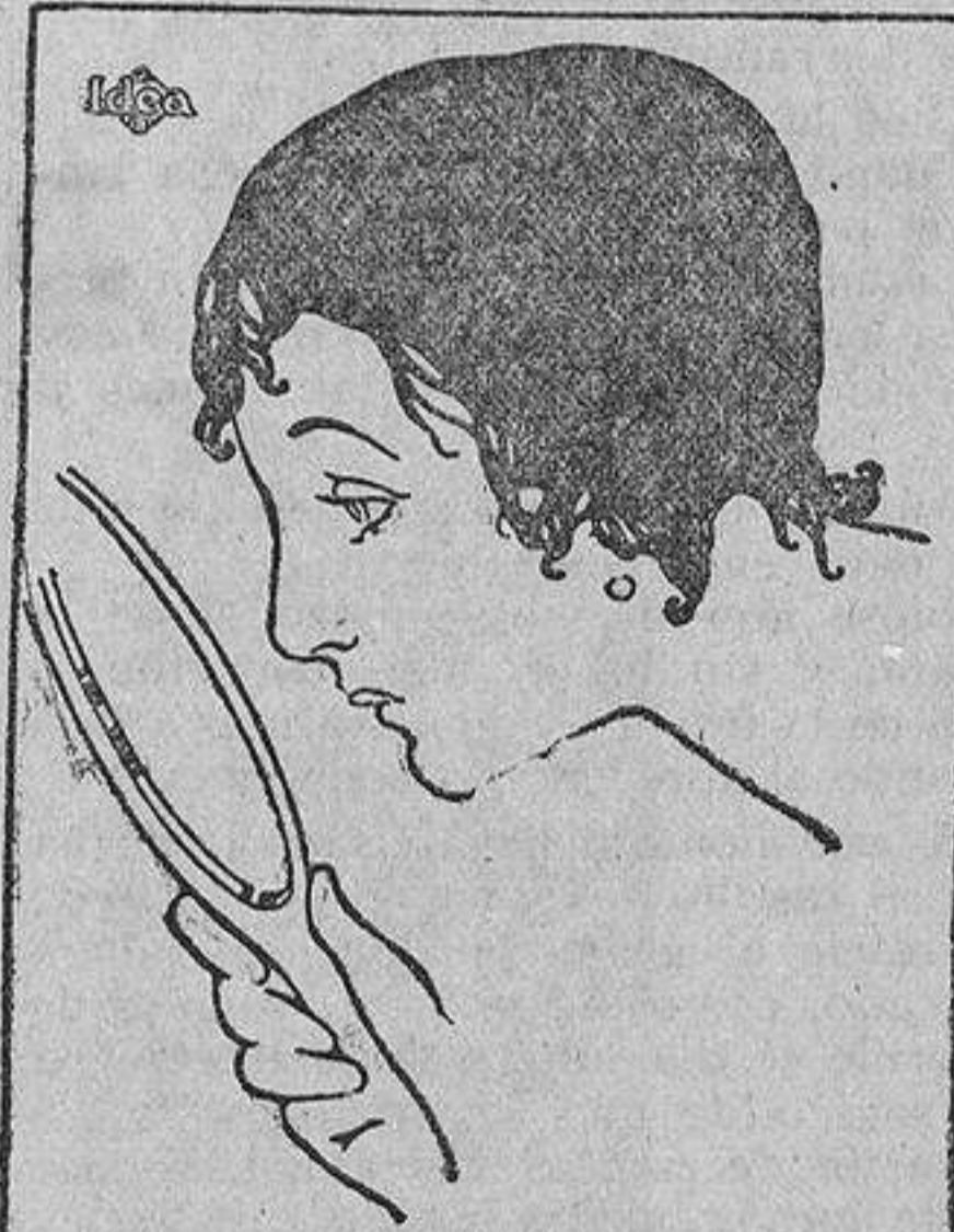
Es muy triste para una mujer joven y bella, verse privada de uno de los principales adornos naturales, el cabello.

Aceróse la moza al hogar, en el cual agonizaban dos corpulentos brazos de en-