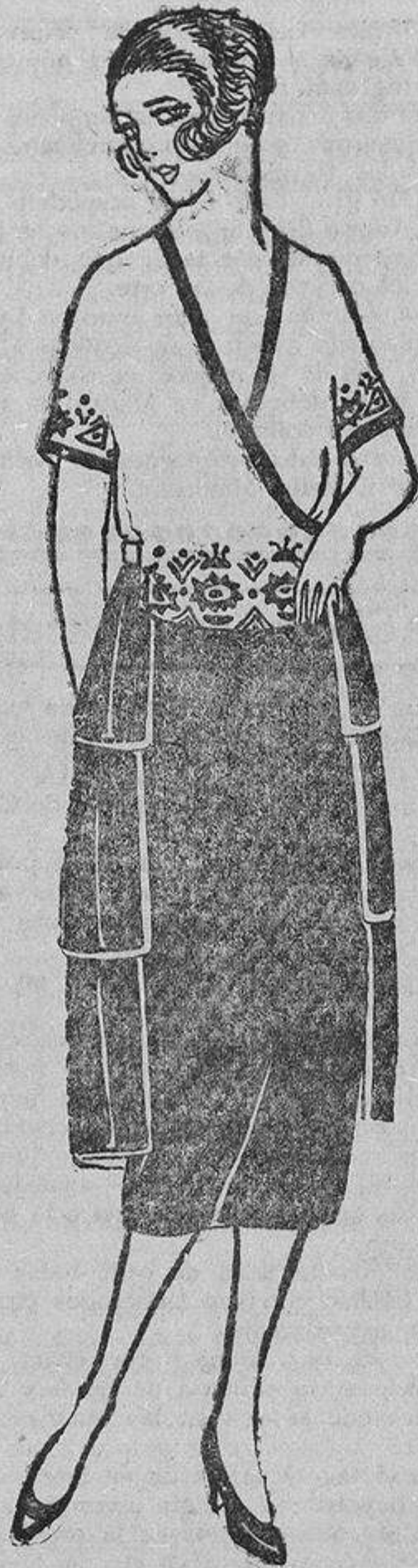
No deja de ser original esta blusa de crespón, lana y seda, salmón, con sus bieses negros y bordados con perlas de azabache.

La moda es, después de todo, de un eclecticismo encantador, y nos permite las chaquetitas saco, rectas, cortitas, lo mismo que las largas, los vestidos cortos y estrechos, como los amplios, huecos y pomposos, las mangas largas, las cortas, y a veces la ausencia total de ellas, los cuellos altos y los escotes pronunciados, y últimamente las mezclas de tejidos y co-