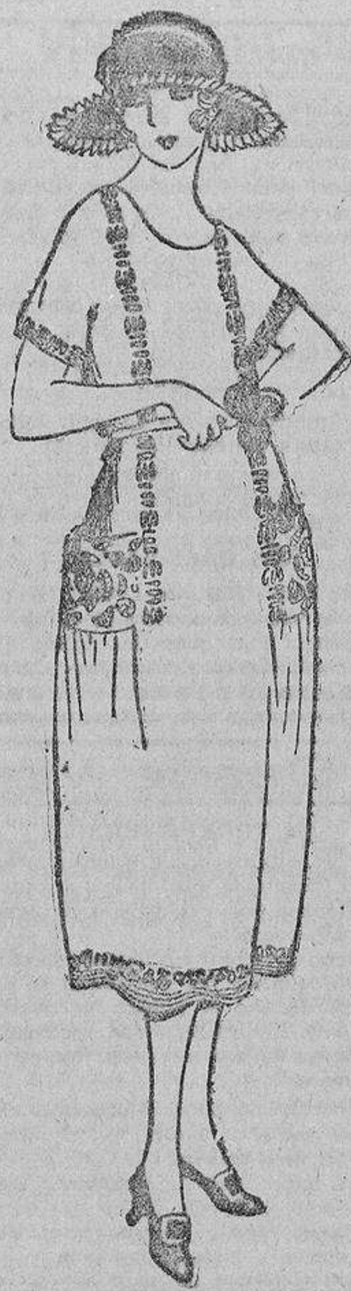
Maria Isabel dice que no hace falta llevar sedas para estar elegante; por eso está encantada con su traje de algodón «azul» bordado en blanco y azul Talavera.

En el caso de ser la causa el intempestivo desarrollo de los músculos, recomiendan como más eficaz algunos ejercicios, y