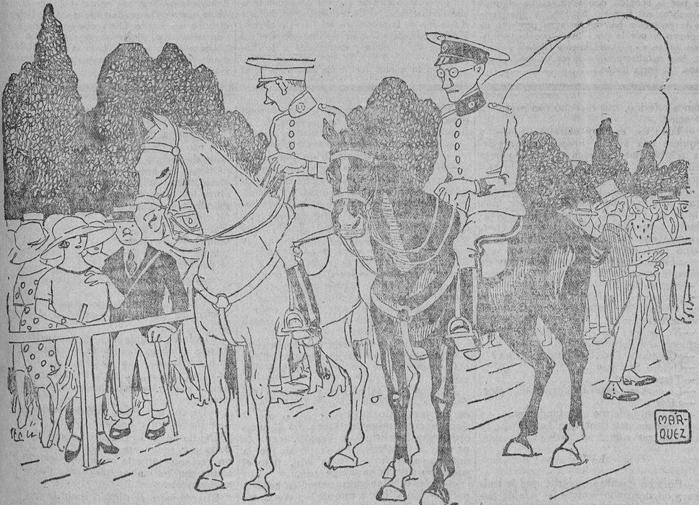
—Lo que son las cosas!... La carrera de militar me ha costado años, y ésta la he ganado en media hora escasa.