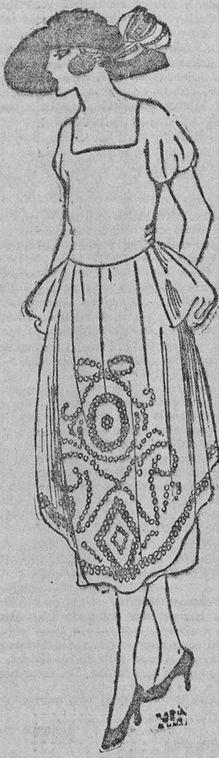
Por la tarde asiste a una fiesta benéfica; quiere estar seductora, a fin de obtener espléndidas ilusiones, y por eso lleva un «chic» modelo de tafetán pétalo de rosa, bordado con ojetas de corsé negros. Una amiga suya lo ha copiado en azul marino con ojetas blancas.