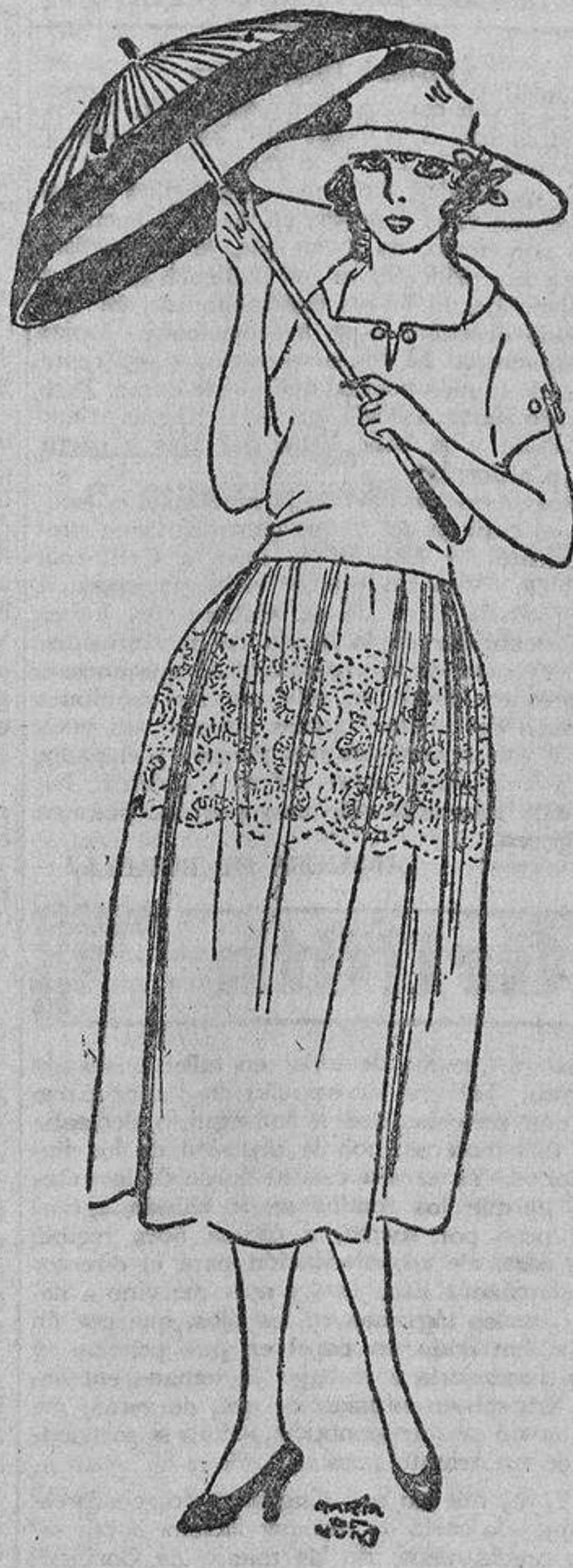
Carlota con el suyo crudo, incrustado con un ancho entredós del mismo tono...