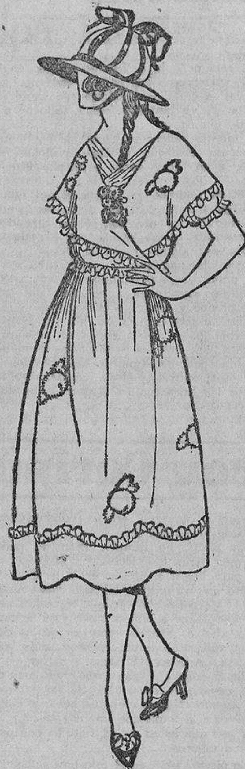
...y Esperanza, envuelta en organdi blanco, el cual tiene incrustados unos melocotones que van muy bien con sus mejillas.

Pasean y saborean la vida al aire libre; van perdiendo la costumbre de oprimirse el cuerpo en peligrosos corsés.