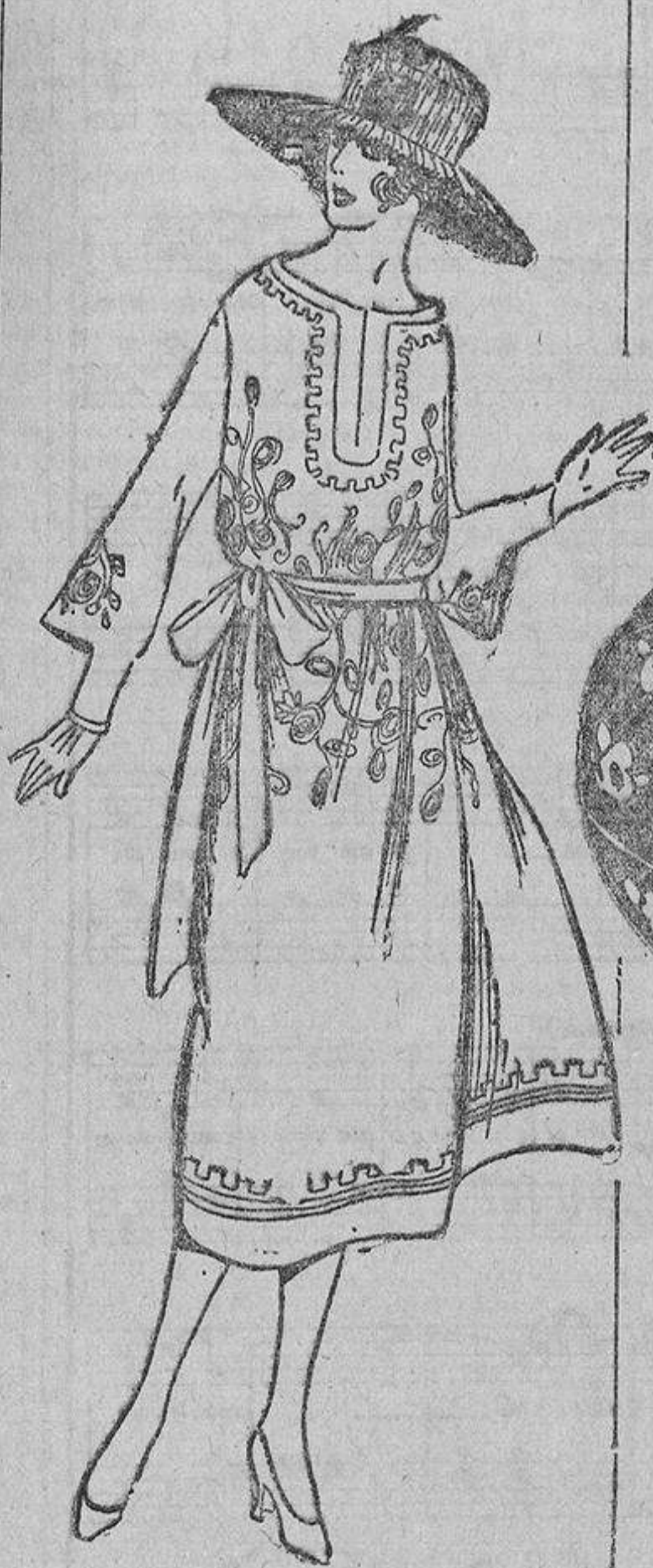
Del tono delicado del misotis, bordado con soulache blanco lavable.

¿Y la emoción del contrabando? Hay señoras sensibles y tranquilas, incapaces de tomarse una molestia por nadie ni por nada, y que se envuelven en el cuerpo en unos metros de cinta y se atan un frasco de perfume a la cintura nada más que por gustar de unos momentos de tensión nerviosa al pasar la aduana.