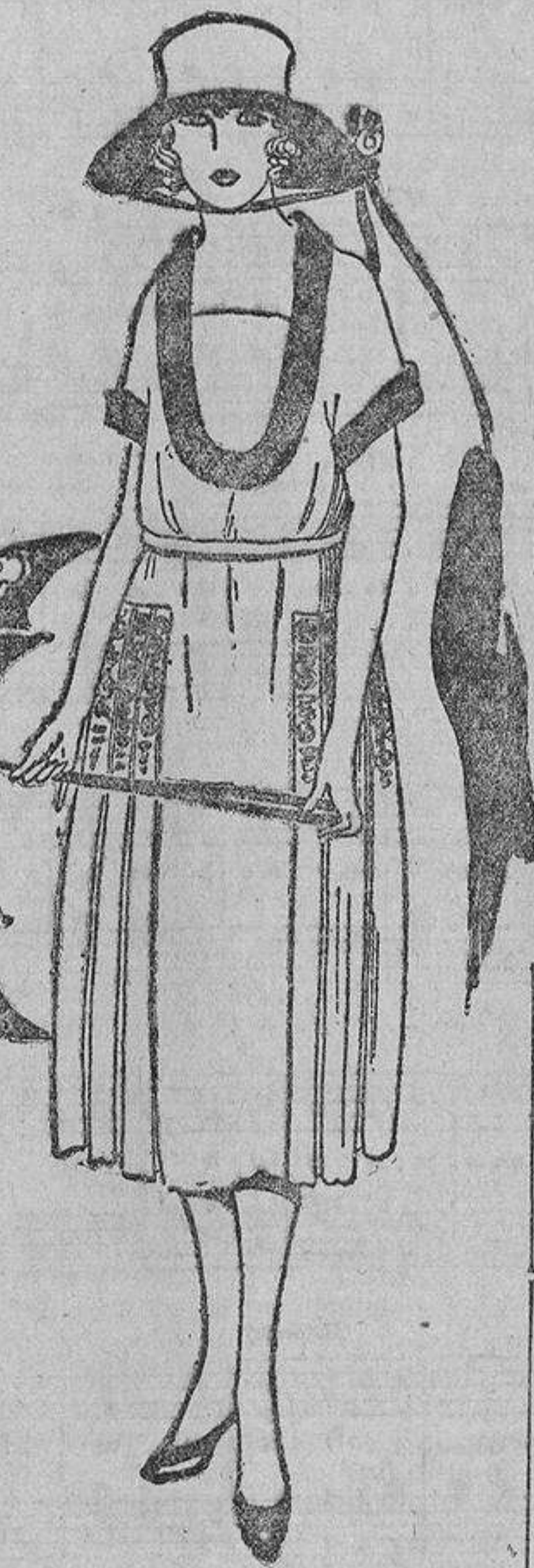
Sobre la blancura de este modelo, de tela nacional, un doblez en el cuello y mangas, del amarillo más intenso, yema de huevo, por ejemplo, con bordaditos de dicho color sobre las tablas.