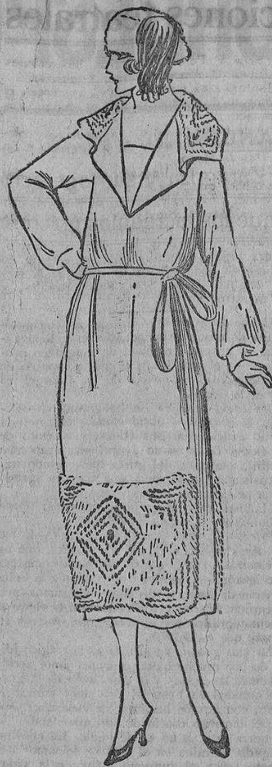
Punto de lana azul «natter»; delante y detrás dos tiras, anchas, de lana cardada con bordados azul marino y arena, de lana.