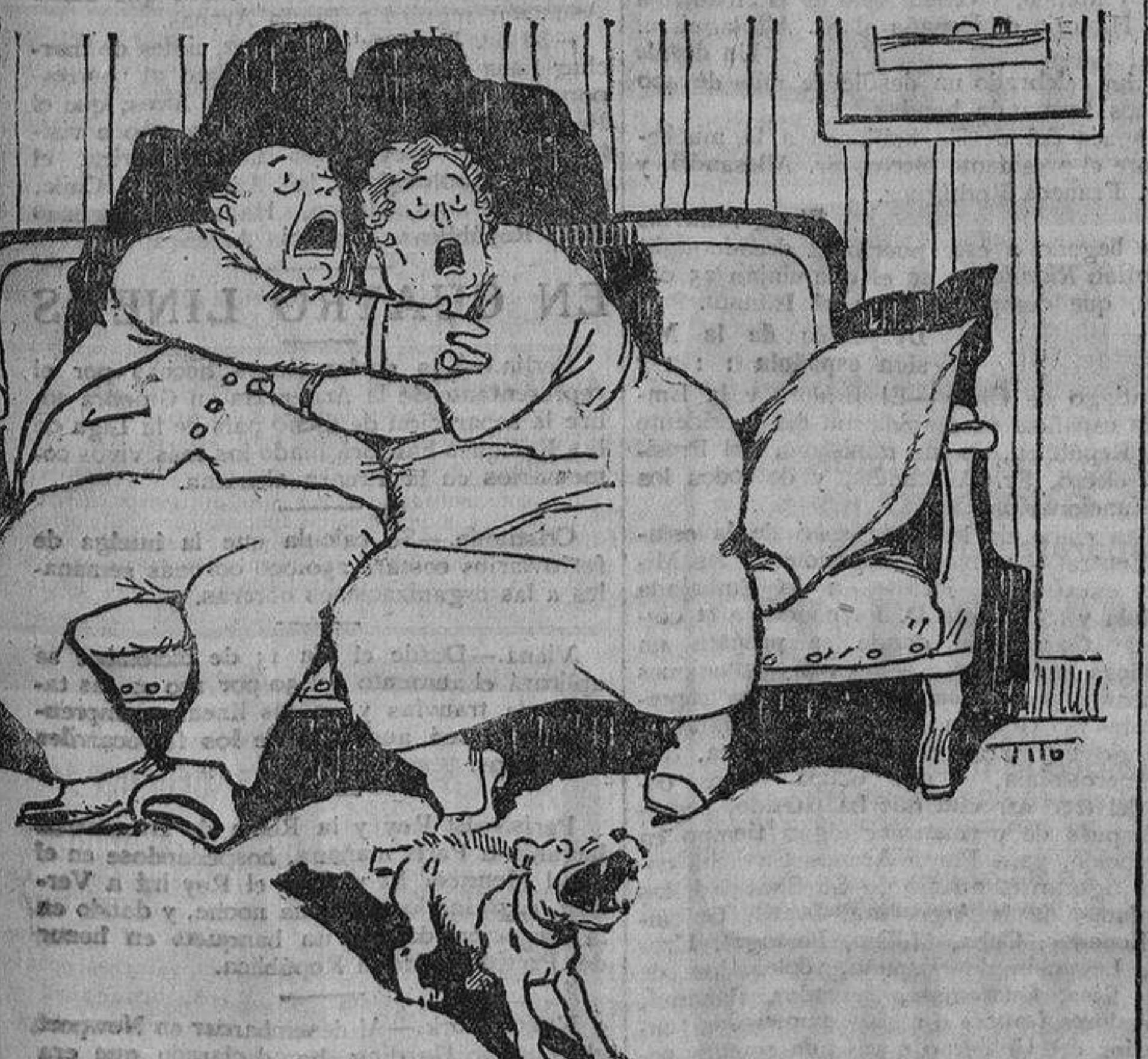
—¡Ya ves; hasta el perro ladra cuando llamas a la criada!