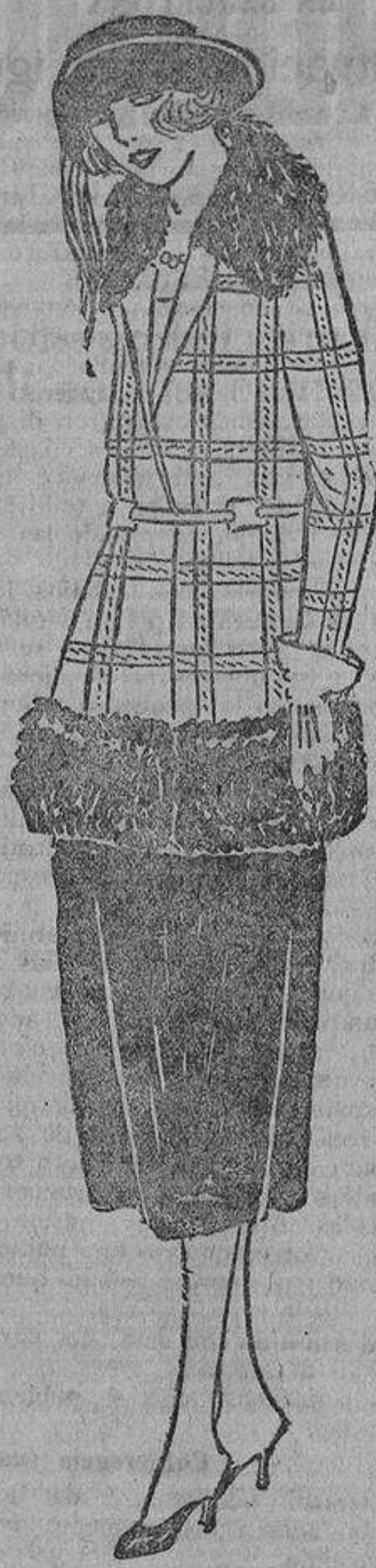
Para una mujer de gustos originales, un vestido «modern-style», falda de terciopelo negro y chaqueta a cuadros negros sobre fondo ladrillo y piel negra.