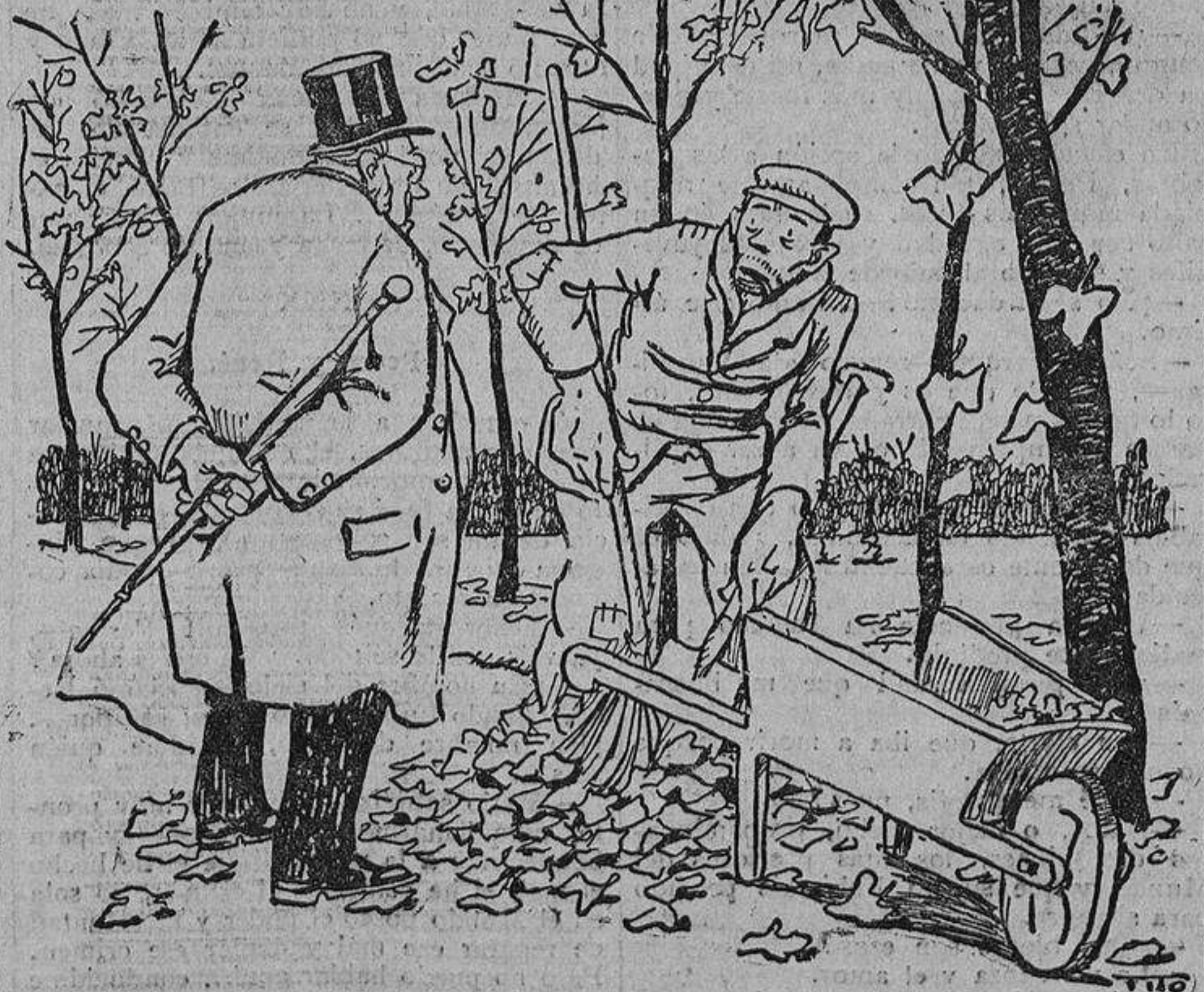
El juez, que distrae sus ocios dando un paseo:—Y entre tantas, ¿no habrá alguna clandestina?