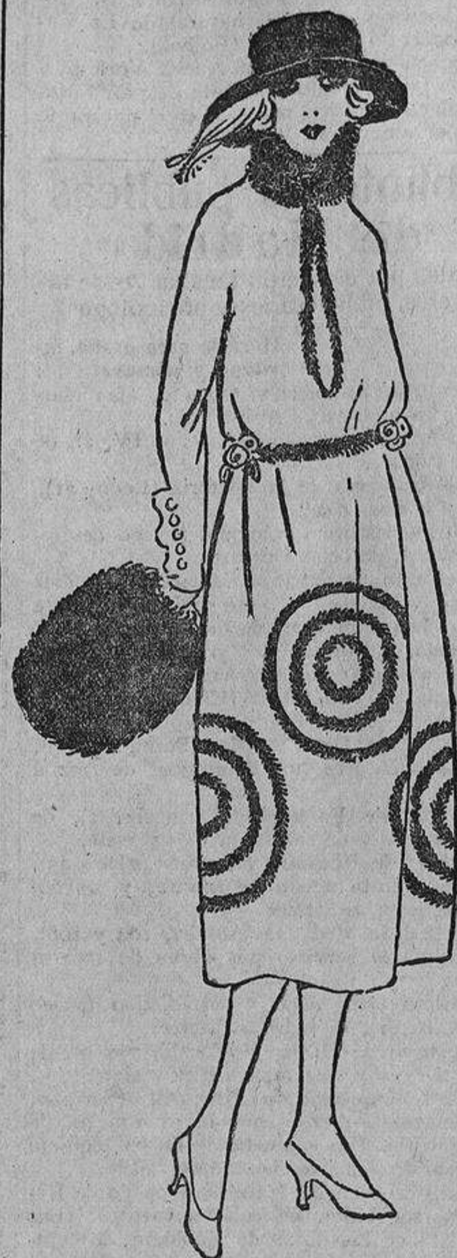
Es una idea que no conviene olvidar, la de esos círculos hechos con flequillo de piel y que pueden adornar graciosamente lo mismo un vestido de seda que uno de lana.

ford un «cake walk», un «fox trot» de ritmo fresco y elegante. Son dos escuelas, dos épocas, dos vidas distintas. Y el público, y sobre todo las mujeres de falda corta, de traje «tailleur», de «sports» vertiginosos o acrobáticos, de bailes ultramarinos, han sentido contra la escuela italiana, sonriendo cuando Menichelli inclina hacia atrás su cabeza dramática o la Bertini suspira amores de una excesiva cursilería.