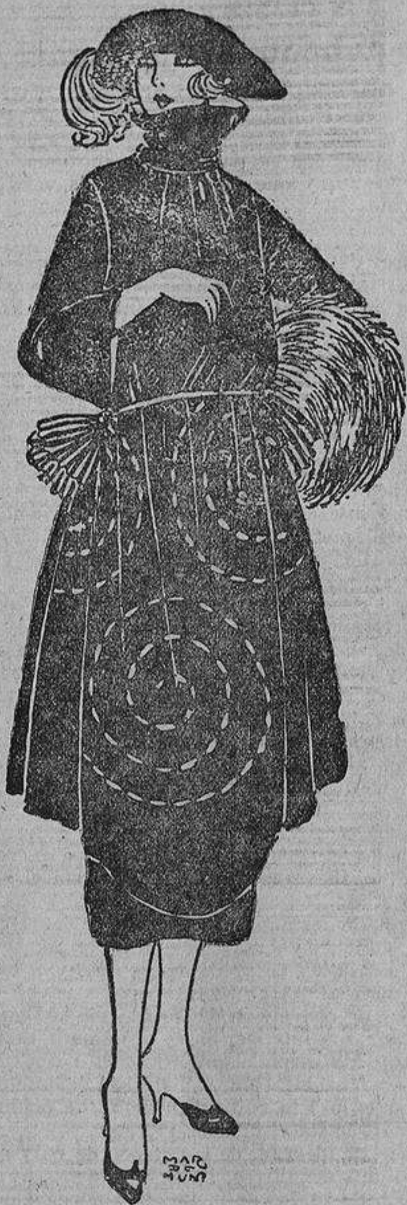
Para mucho vestir, este modelo de seda negra, bordado con azabache o cuentas de color.