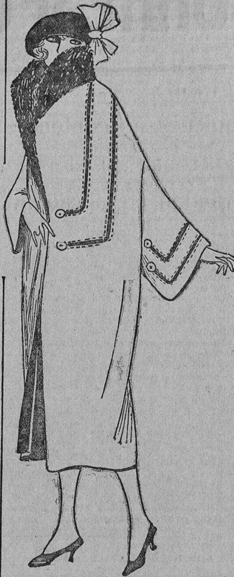
Sencillo abrigo de terciopelo de lana «rouille» con incrustación de piel, mismo tono que la piel de castor y el forro.

un bollo y una onza de chocolate; para la comida, un cocido viudo, y de cena, unas patatas guisadas. Ha tenido que elegir un cuartito estrecho, muy arriba, debajo del tejado; no enciende fuego, apenas gasta luz, lava su ropa en una palangana para no pagar lavandera. Esto lo hacen las que vienen de provincias a la corte para aprender un oficio y que ni aun siquiera tienen el consuelo de tener la familia cerca.