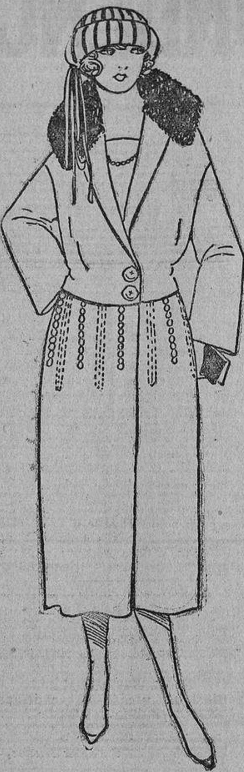
Este elegante abrigo de paño marrón o «rouille», que reúne las características de la moda de este invierno en abrigos, no tiene más adorno que unas hileras de botones de su misma tela y pespunte igual tono.