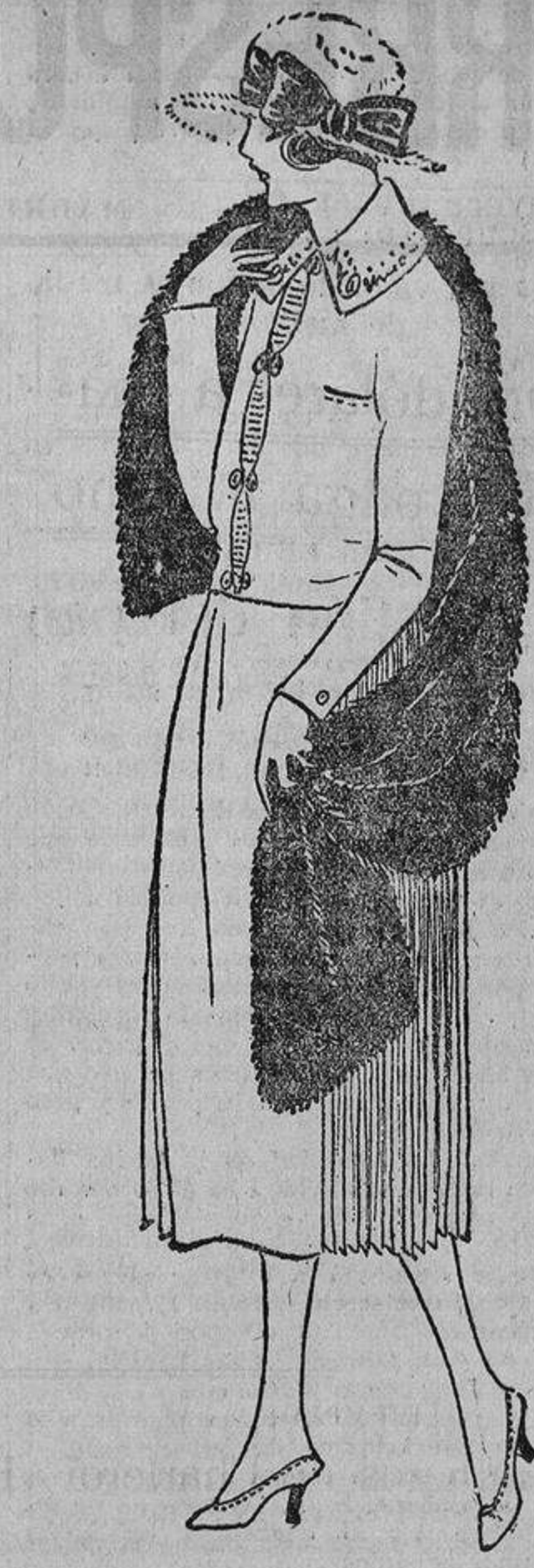
Muy sencillo; delante y detrás un tablón liso; el cuerpo, bastante ajustado...