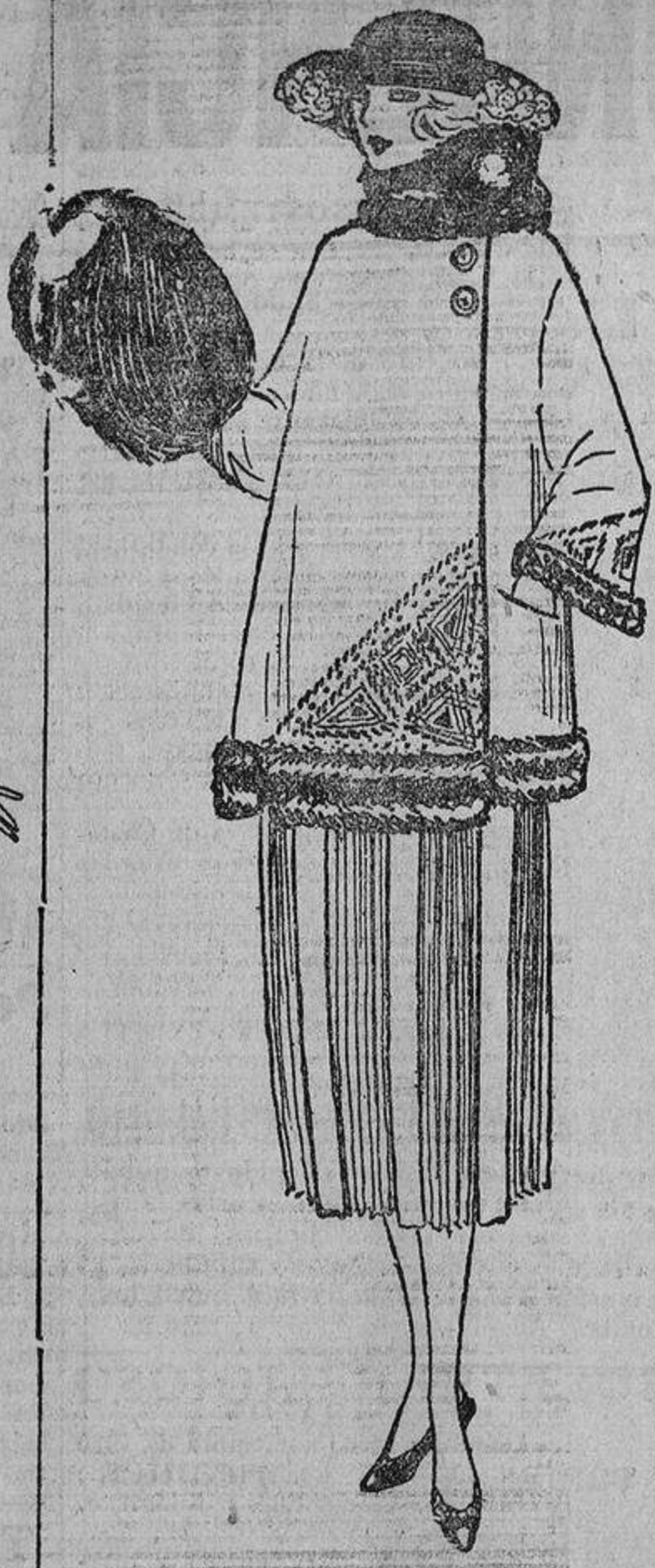
A trozos plisada y con tablas la falda; la chaqueta abrochada a un lado...