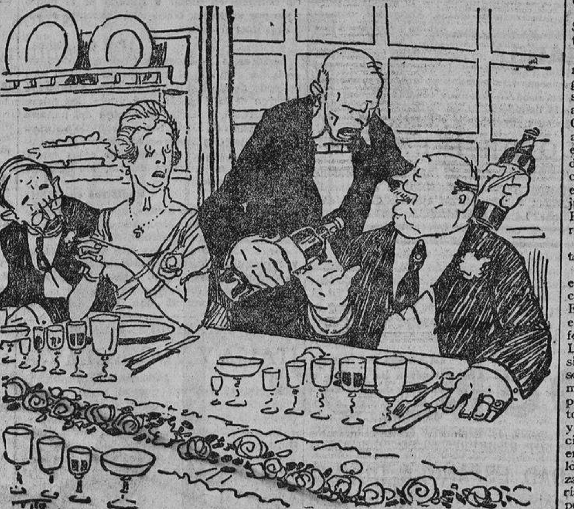
—Borgoña o Burdeos? —¡Oh, soy muy tolerante; puede poner de los dos!...