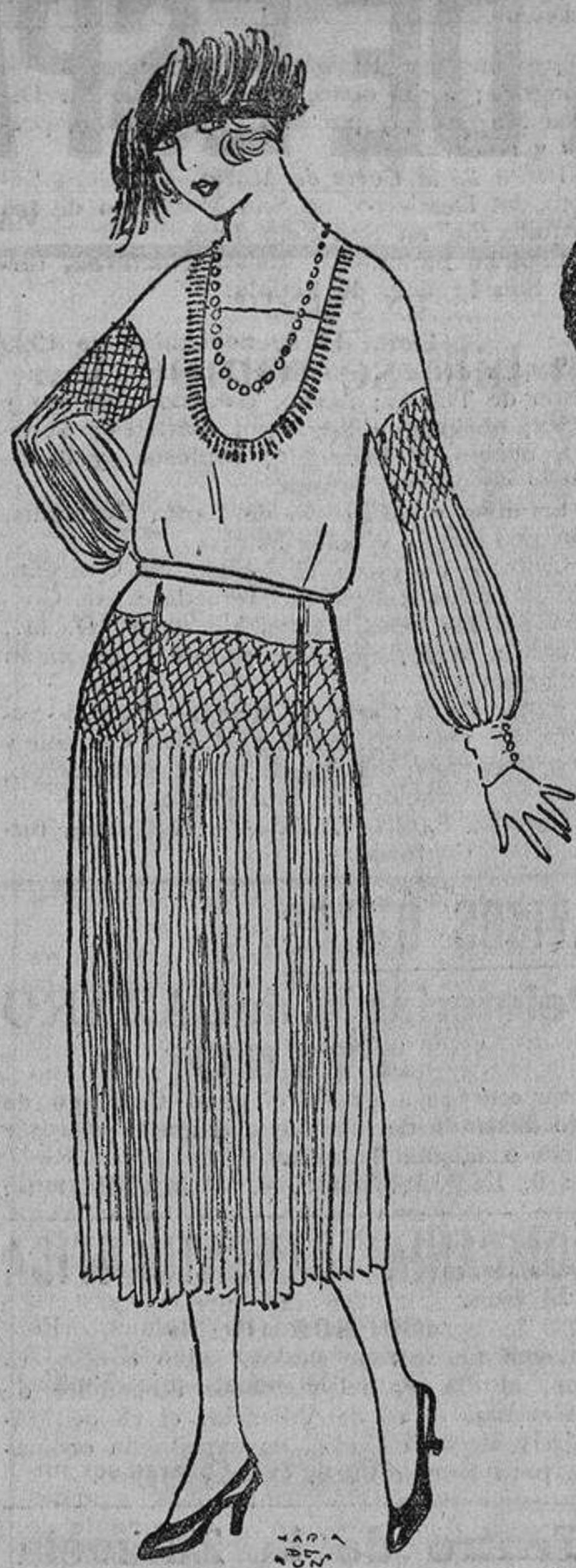
Negro, en una seda mate, flexible, resultará ideal como traje de luto...

Con los fríos rigurosos, los jerseys, en lana muy fina, es lo que más abriga y lo que la moda benigna ha dado en encontrar muy «chico».