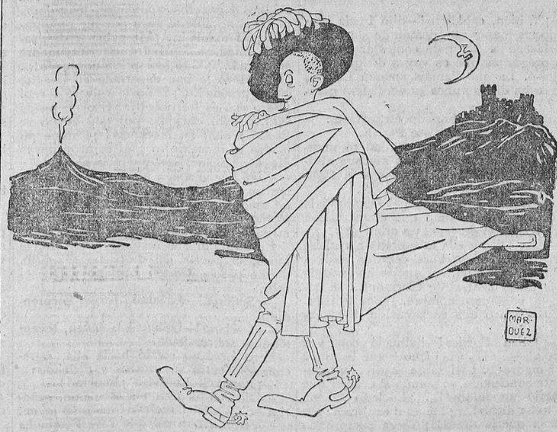
D'Annunzio. —Calé el chapeo, —requerí la espada, —miré al soslayo, —“Fiume”... —y no hubo nada.