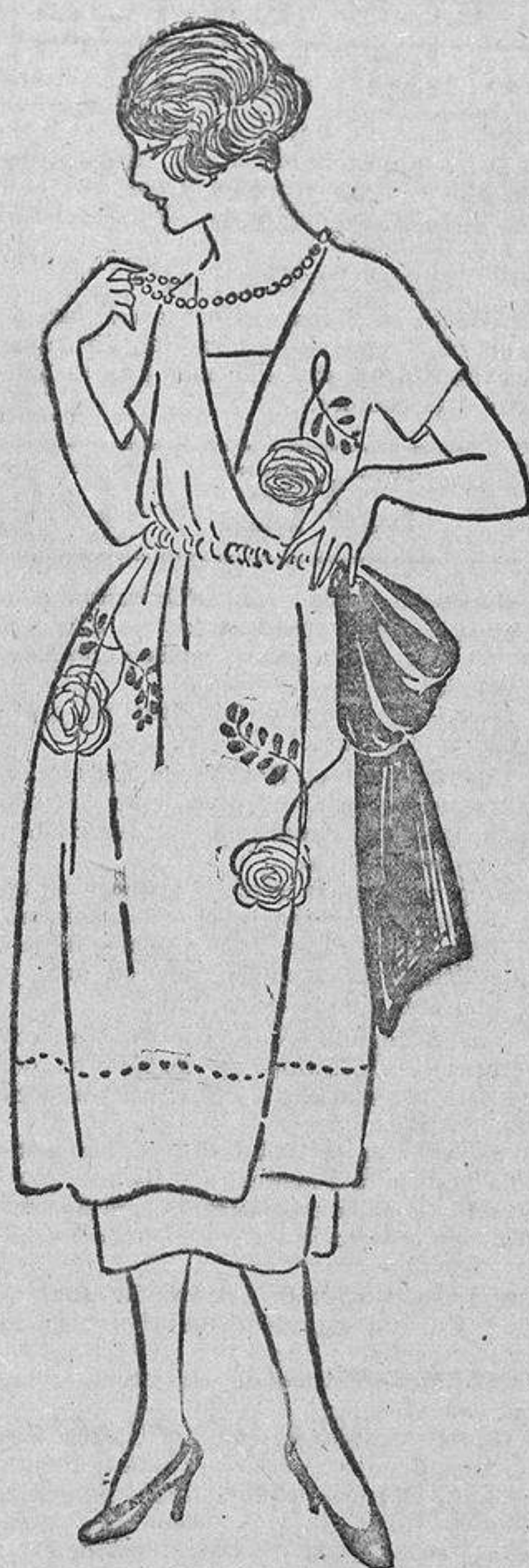
Sobre una túnica de organdí o crespón de China rosa muy pálido, unas rosas bordadas sencillamente a punto de cadeneta, azules, y unas hojas verdes.

Así vemos una esbelta rubia vestida de manera encantadora y juvenil, con un modelo de crespón de seda mate en un tono lila delicado, a un lado del talle una flor de grandes pétalos blancos de crespón mate, más abajo otra y numerosas hojas de crespón lila, forradas de blanco, que se diseminan por todo el delantero del vestido, llegando algunas a esparcirse, en el bajo de la falda, por la espalda.