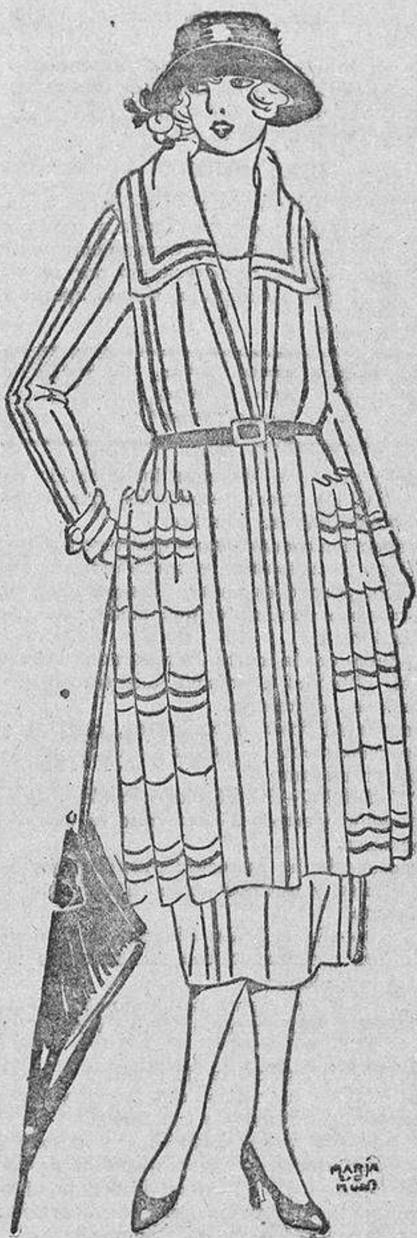
A medida que los días se acortan, las chaquetas se alargan, como se ve en este elegantísimo traje sastre de fina sarga «kasha» marino rayada en blanco.

Una nota curiosa es la variedad de estilos que se ven; lo mismo pasa una elegante con un jersey de color vivo y una falda blanca muy «negligée», de playa, como otra vestida con un traje de jerga azul marino, casi de invierno, y otra en traje de tarde muy de vestir. Hace un sol espléndido, y, sin embargo, otra elegante cruza envuelta en una gran capa de lana de los Pirineos, cruzándose con otra de manga cortísima y escote atrevido. Ninguna de ellas desentona, y si no estuviésemos acostumbradas, nos extrañaría ver reunidas en un mismo punto mujeres ataviadas con trajes propios para explorar el Polo Norte o los trópicos del Ecuador.