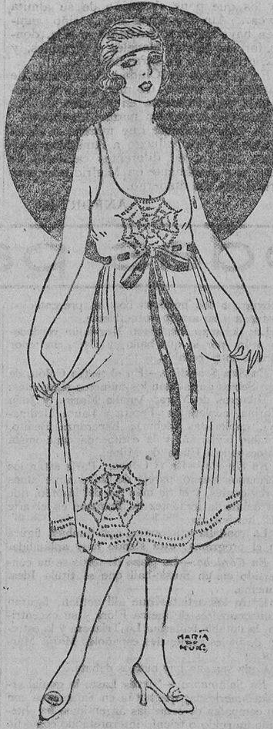
La fantasía de la creadora ideó unos bordados azul «lavande» representando unas telas de araña, en esta combinación de «pongée» rosa carne; nuestra inocencia se estrella ante el simbolismo de esta idea.