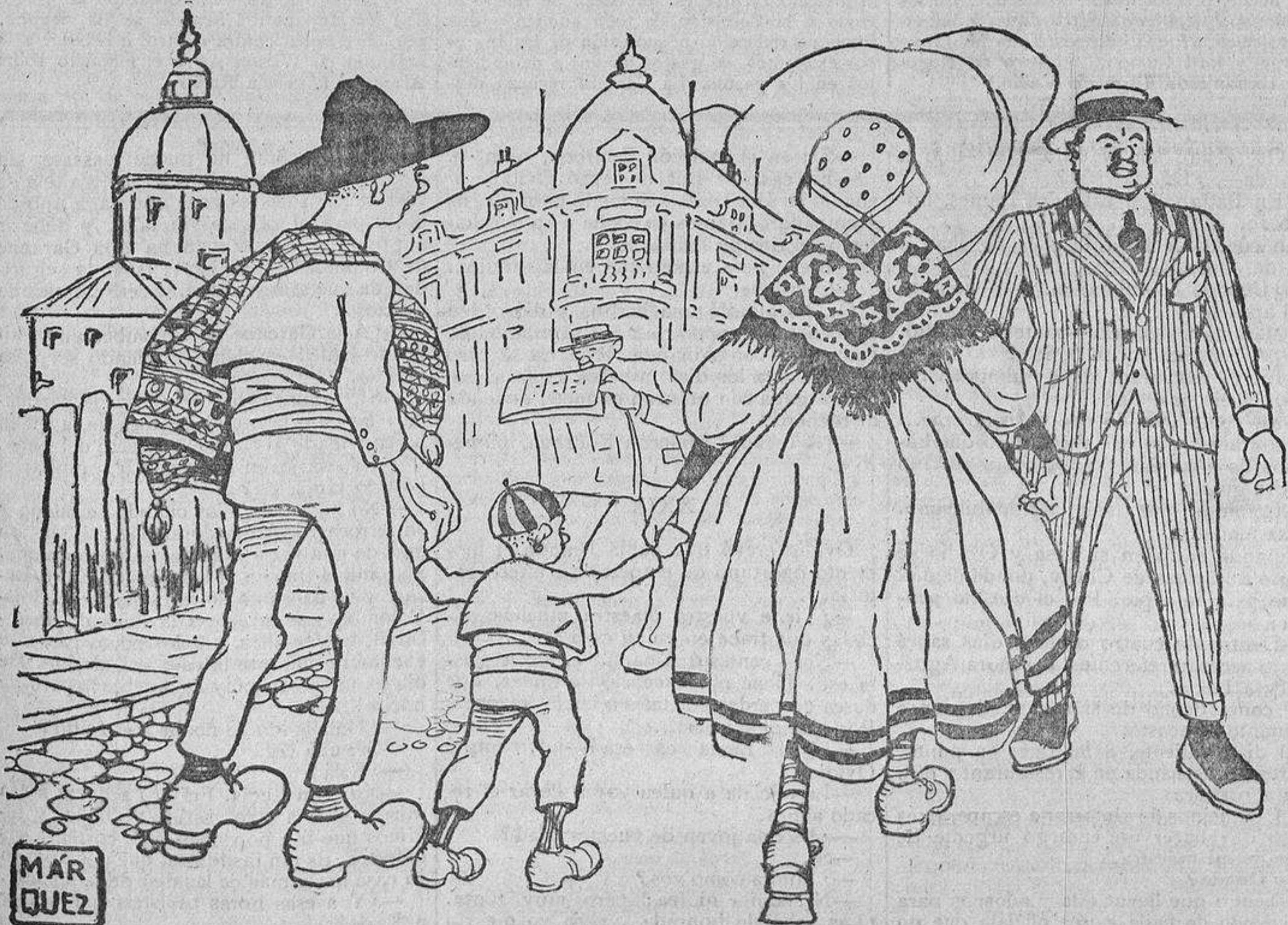
—¡Anda! El señor «deputao» del distrito con alpargatas. Se conoce que ha venido a menos.