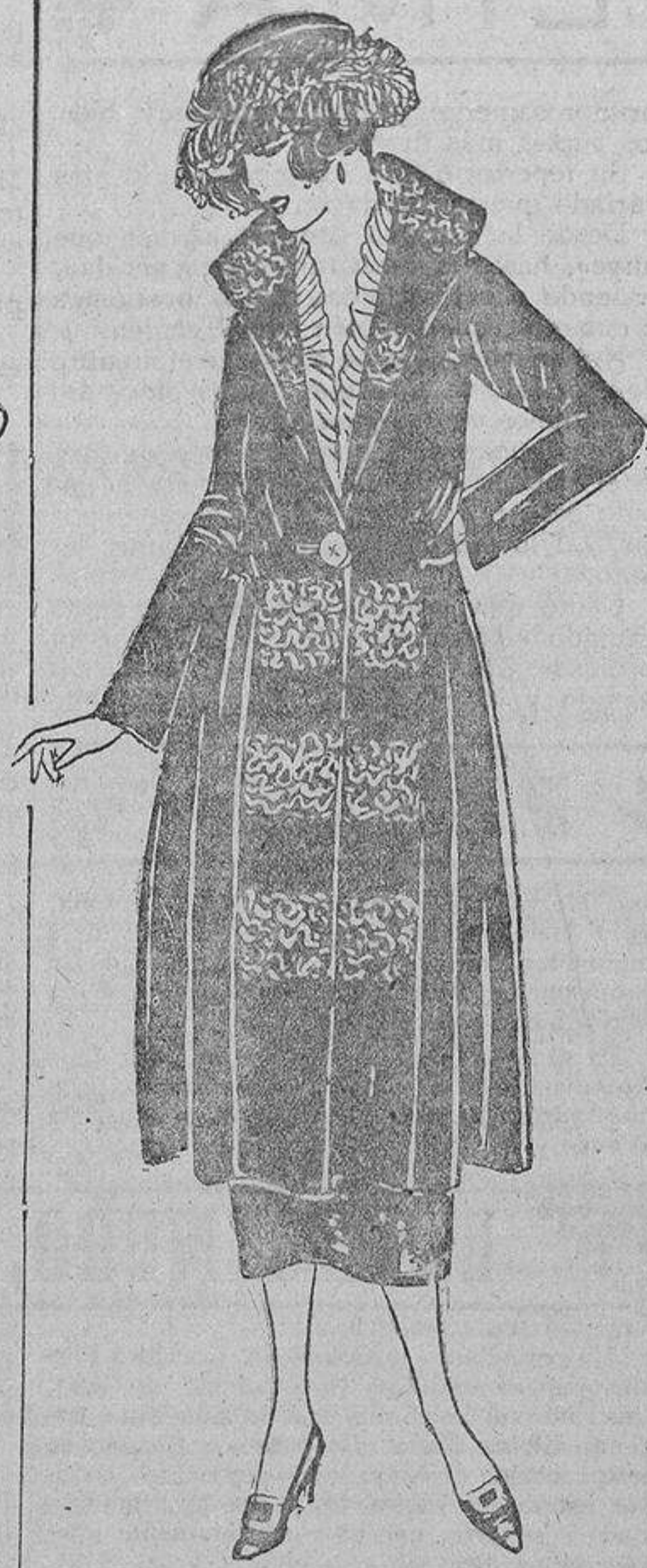
Azul marino, bordaditos blancos, el cuerpo cortado en la cintura y fruncido solamente a los lados. Solapas altas abotonadas con un gran botón de nácar.

rencia de buena salud que mejorará la raza.