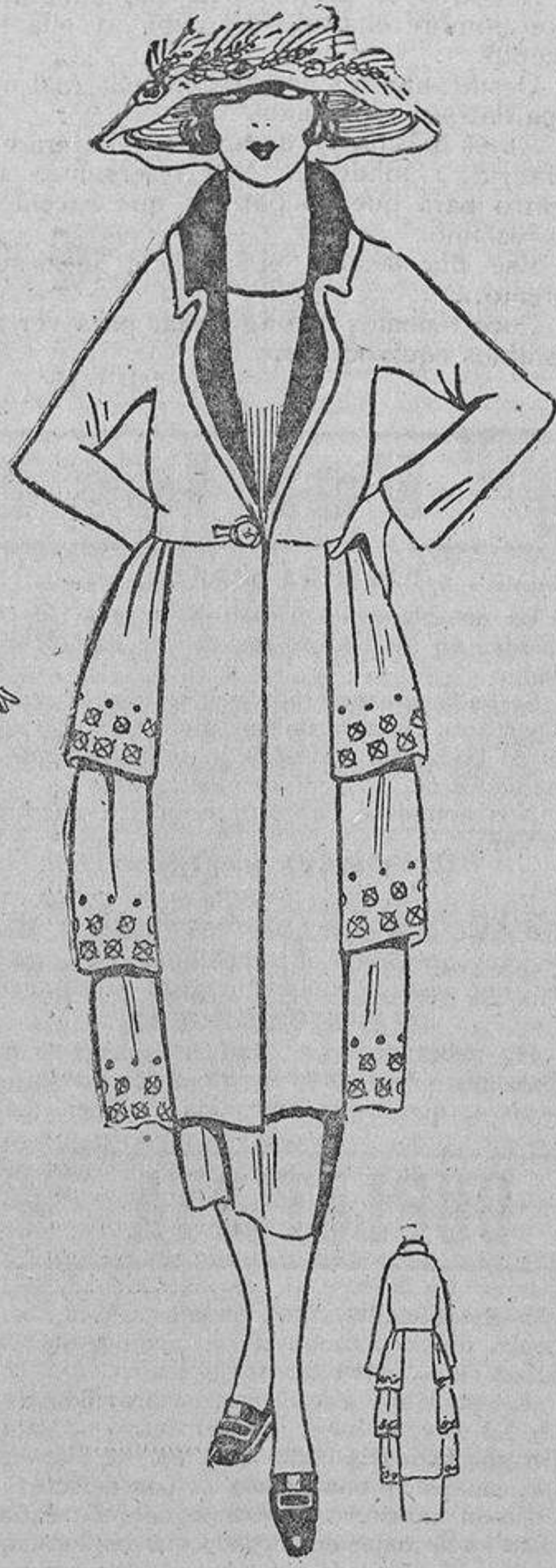
En tafetán verde muy oscuro, adornado con bordaditos negros en los tres faldones de los lados. Falda estrecha, pero no demasiado, a fin de permitir la libertad del paso... sin peligro de que se rasgue el tafetán.