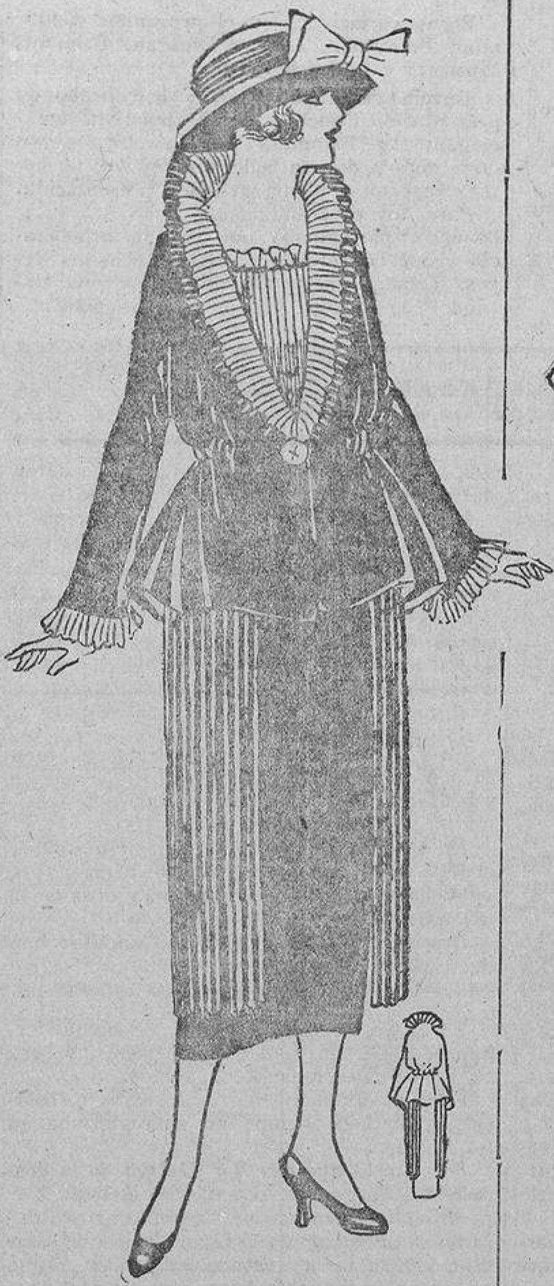
Los trajes sastré de tafetán alcanzarán mucho éxito este verano. Este es negro, con chaqueta corta abulsada, falda estrecha con dos caídas a los lados pliseadas y cuello plisado de tafetán, bajo otro de organdi blanco.

Ya han pasado aquellos tiempos en que a las niñas les estaba vedado el correr, saltar y jugar como los niños; en llegando a cierta edad, la misma naturaleza va evolucionando el temperamento de las niñas, y no hay temor de que sigan de pollitas siendo tan chicos como de pequeñas. Sin darse cuenta, sin necesidad de repreensiones y advertencias severas, llegan a ser tan formales como sus abuelas, que pasaron su infancia alejadas de los juegos bulliciosos, bordando junto a las mamás, con la ventaja de que su organismo está mejor constituido, y legarán a sus hijos una he-