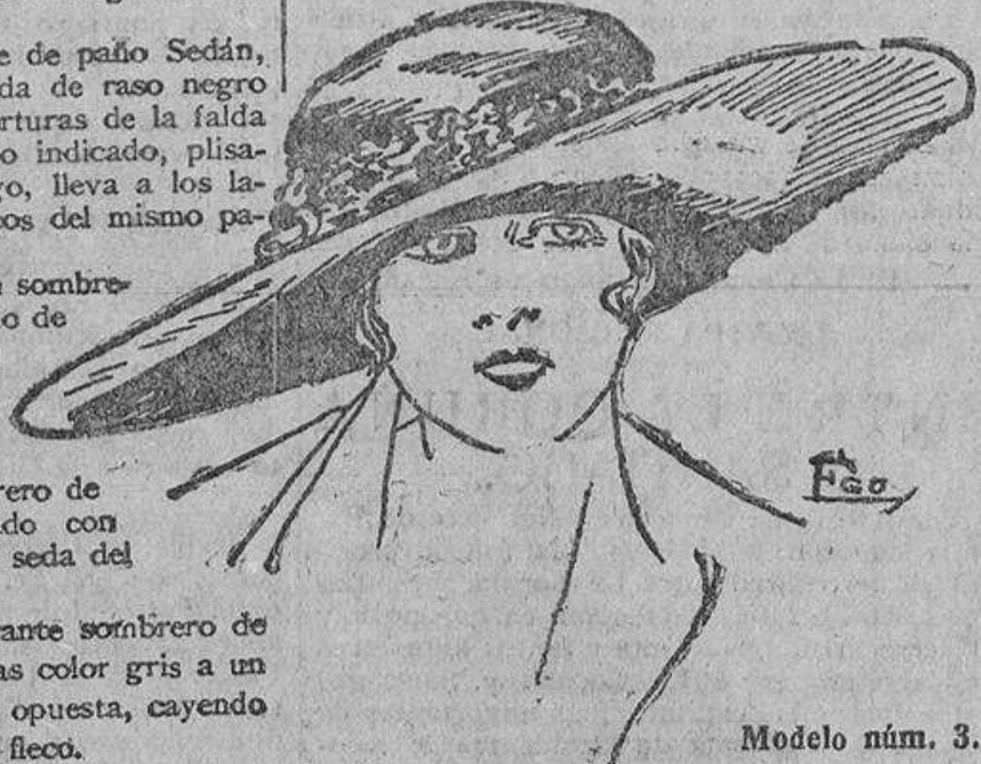
Modelo núm. 3.

Tener es disfrutar en parte de una gracia.