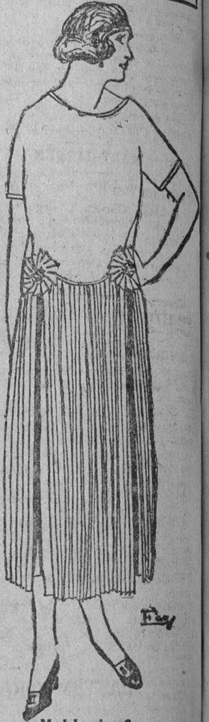
Modelo núm. 2.

Una morena.—Lamento la ausencia del sér querido. Una finísima cadena de oro o platino que pueda usar como pulsera, que le