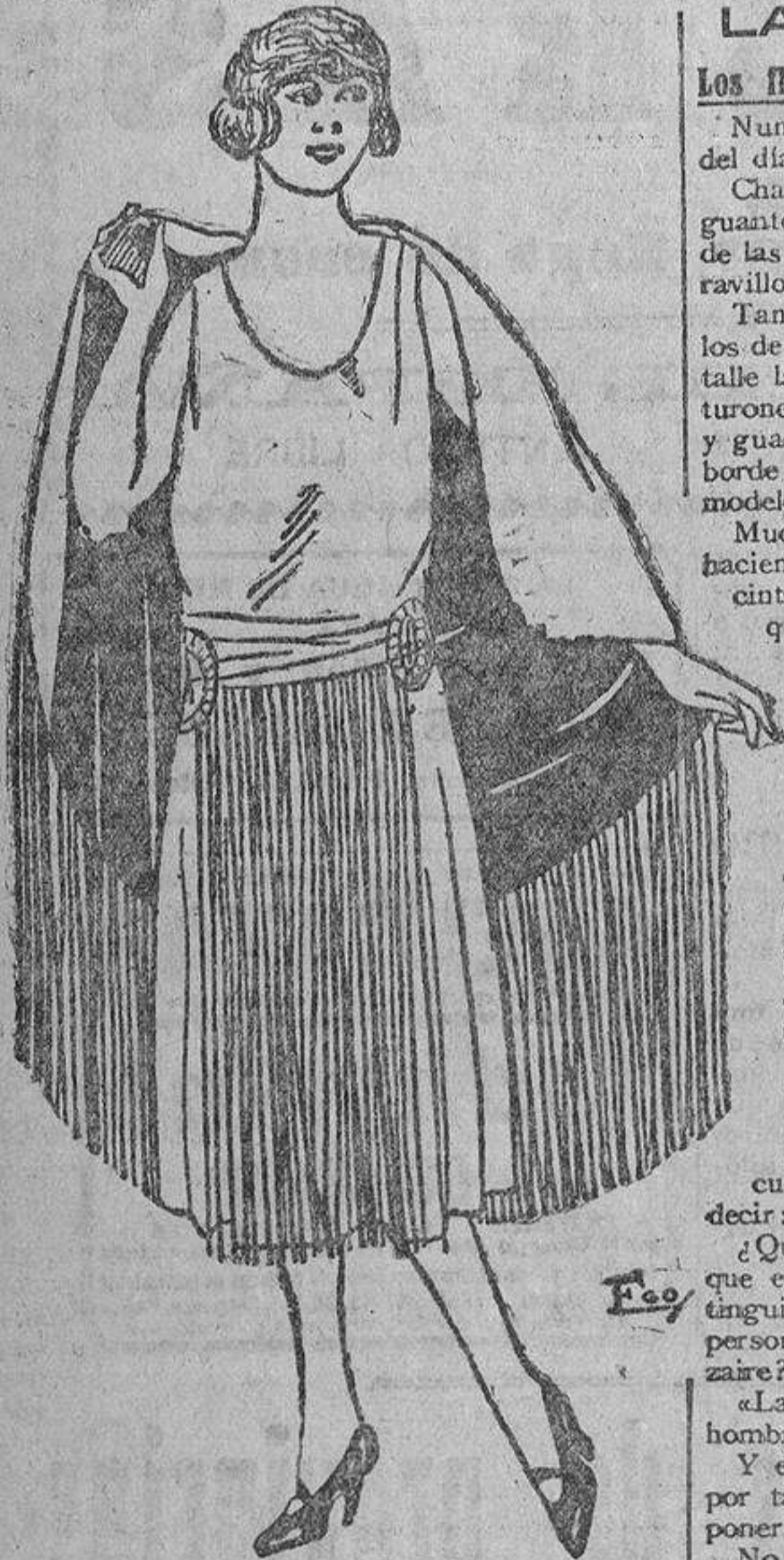
Modelo núm. 1.

ZAPATERIA Confección esmerada de toda clase Calle de la Montera, 40