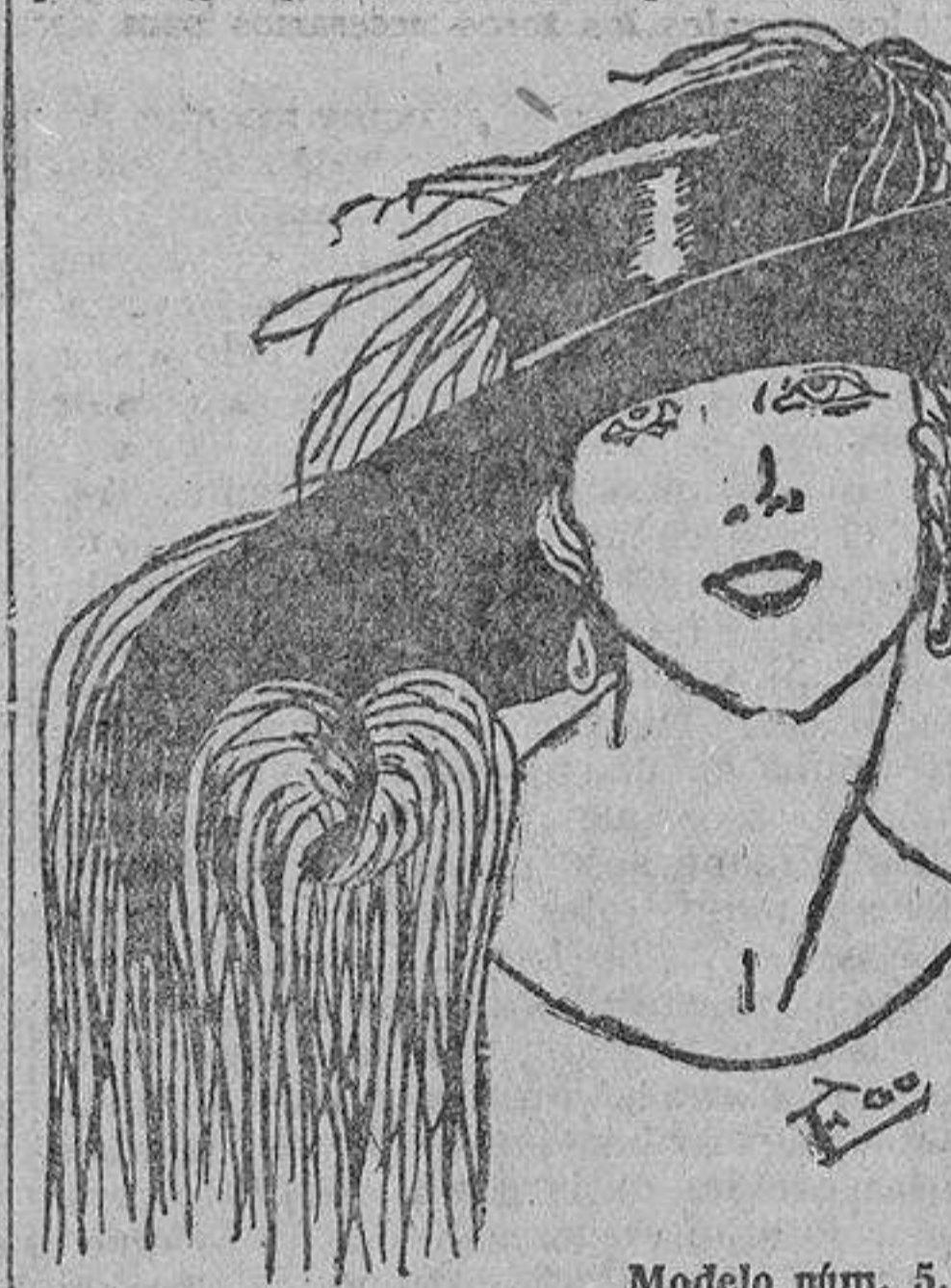
Modelo núm. 5.