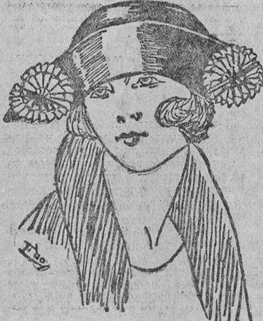
Modelo núm. 4.

Después de poner las medias dentro de un agua ligera de jabón hervido por espacio de diez minutos, con corta diferencia, lávese enfriando un poco el agua, y enjuáguese luego con agua fría; con esto aparecerán las