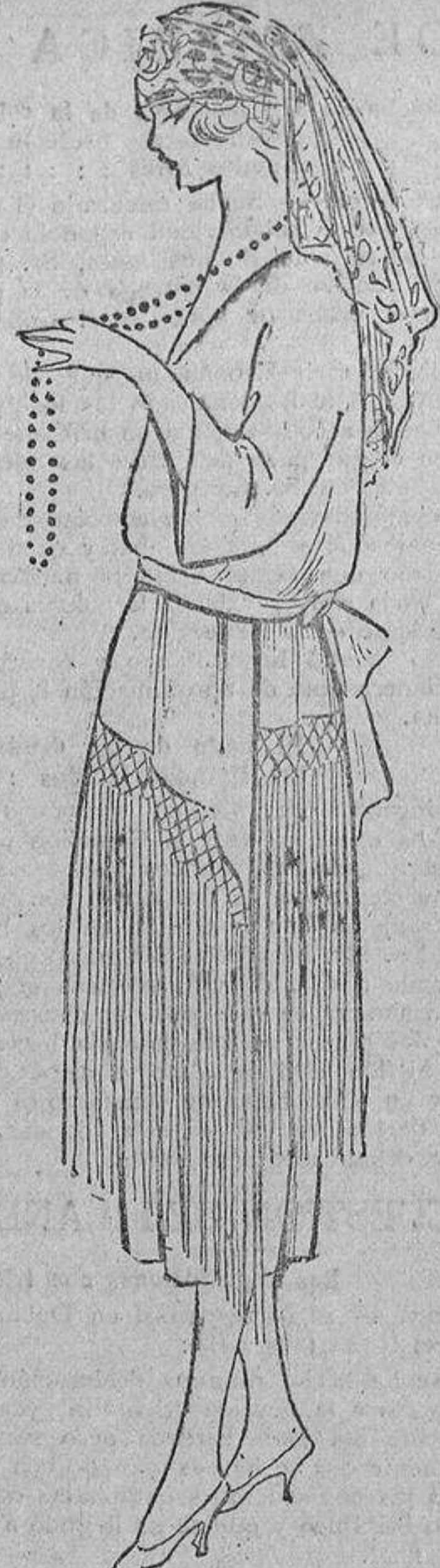
Crepón de China, color arena, con flecos de seda del mismo tono.