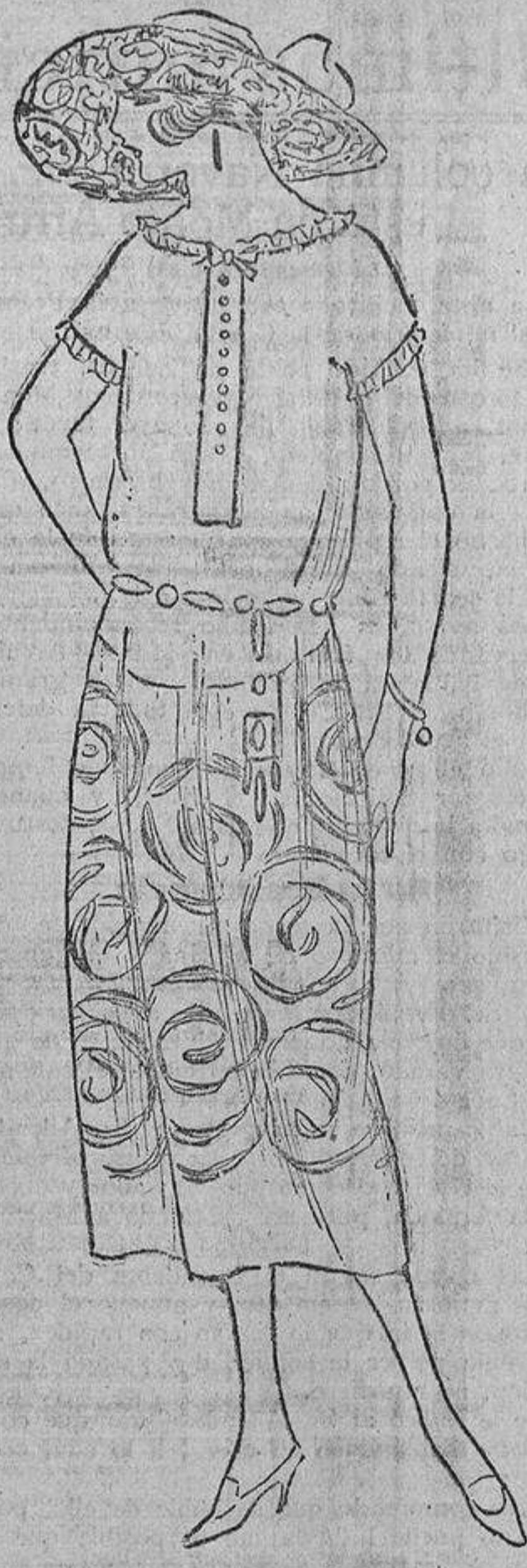
Con bordados o con cinta estrecha fruncida, puede hacerse el adorno de este traje, que puede ser de lana o de un tejido de algodón.