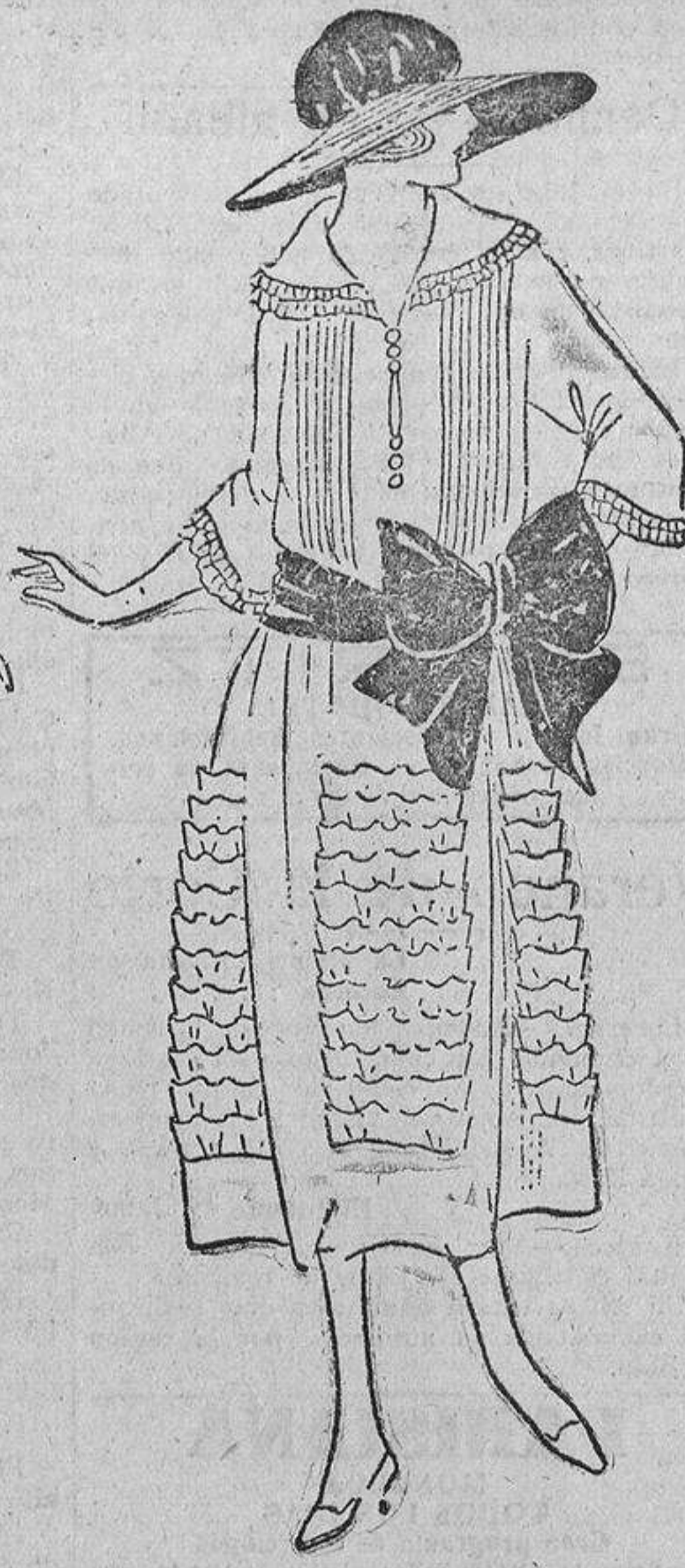
Todo lo reúne este juvenil modelito de organdi blanco, adornado con pliegues en el cuerpo y ruches en la falda, mangas y cuello. Banda color pimienta.