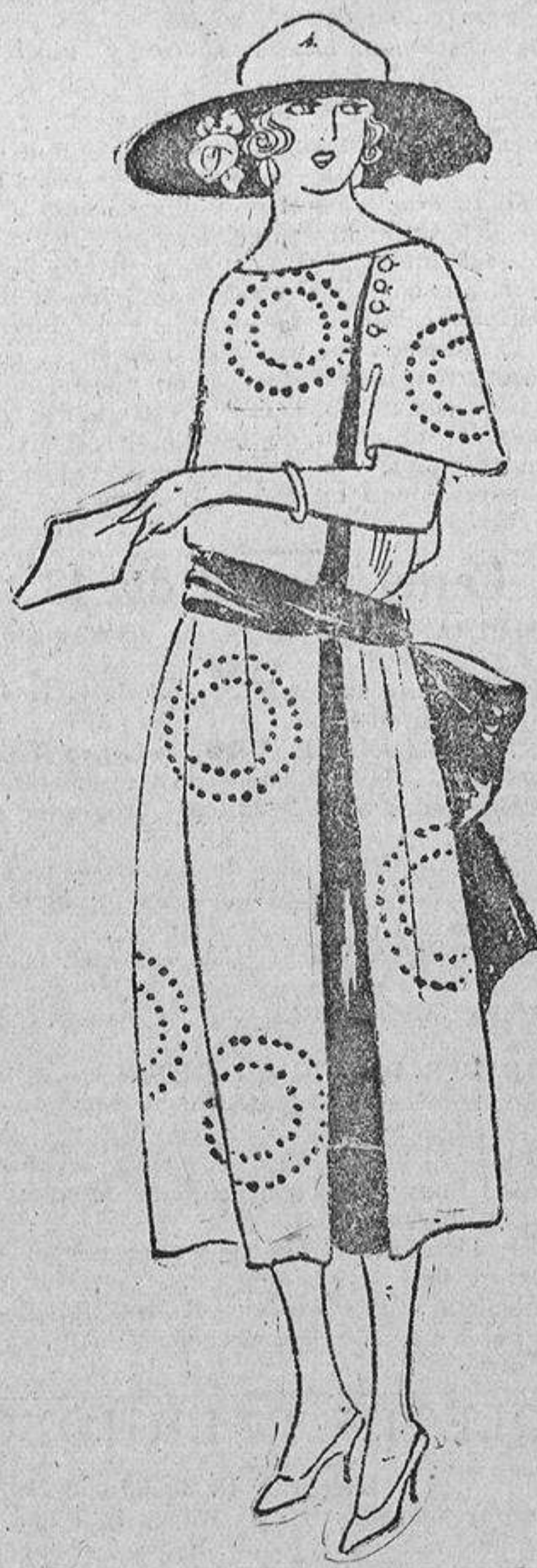
En tussor crudo con motas bordadas en rojo, funda de tussor rojo y banda idem

Todo eso de adelgazar y engordar no siones más que quebraderos de cabeza que buscamos e inventamos las mujeres para complicar la existencia. Nunca estamos contentas; si somos delgadas, deseáramos disponer de unos kilitos y distribuirlos aquí y allá, donde más necesario lo cre-