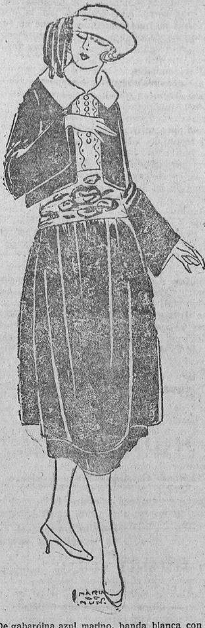
De gabardina azul marino, banda blanca con estampaciones azul marino; blusita con cuello vuelo idem.