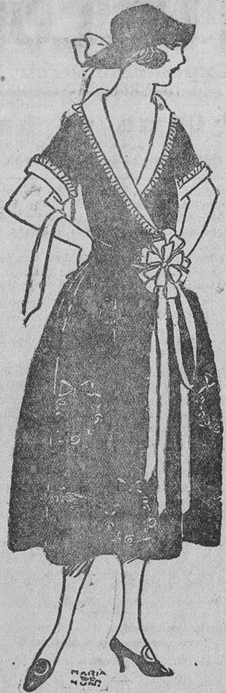
Para las carreras de esta primavera, este vestido «de estilo», en tafetán azul marino con guarnaldas bordadas en distintos tonos y cordada de cinta azul rey.

Bien es verdad que hay moda tanto para las obras de arte como para las «toilettes»; ahora todo lo que «huela» a Oriente es buscado con avidez por los coleccionistas.