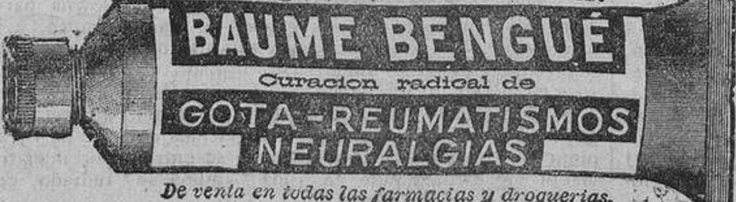
De venta en todas las farmacias y droguerías.