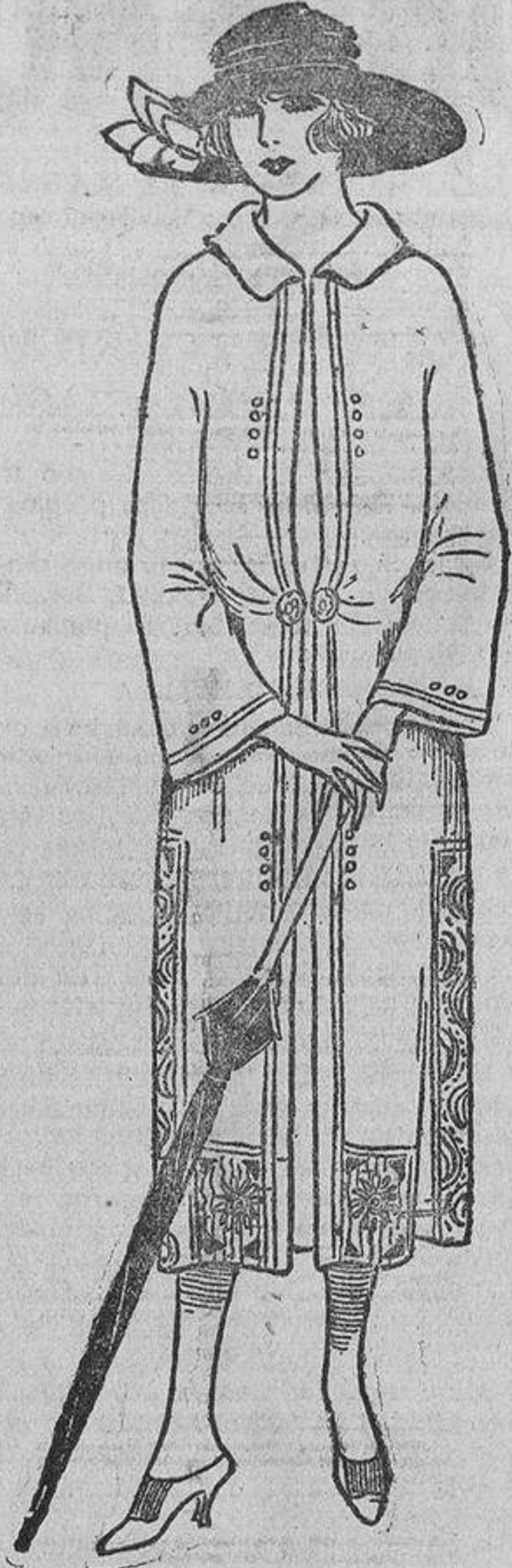
O este otro gris, bordado tono sobre tono, con cinturón sólo detrás, porque nace a los lados y tiene una hebilla de nácar.