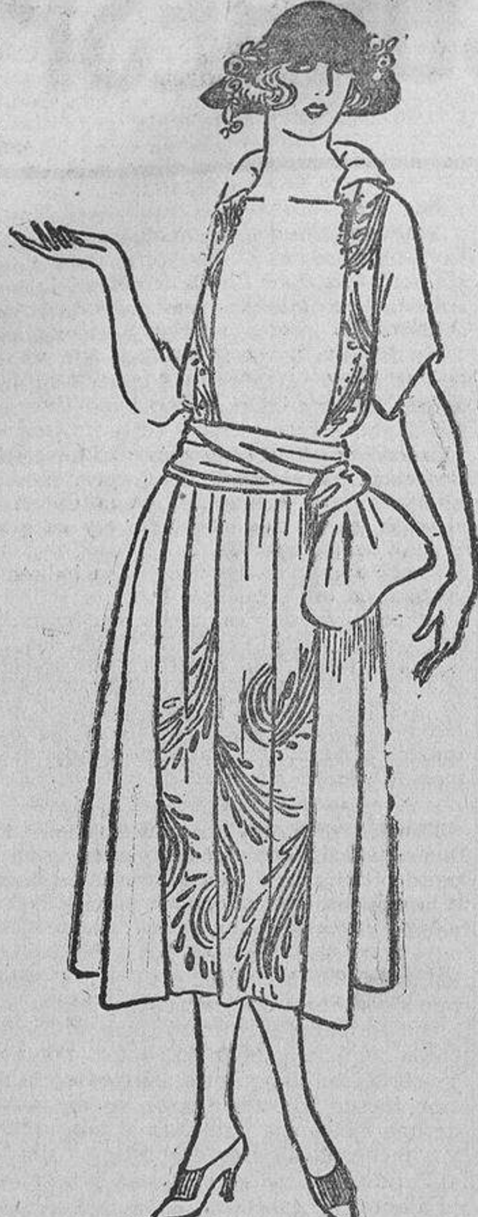
O bien éste, de glaseé marino con un bordado formando grandes palmas de oro, y con los lados cortados en forma.

Numerosas son las señoras caprichosas que ocupan sus horas desocupadas en recorrer tiendas y cuchitriles buscando muebles antiguos, marfiles pacientemente trabajados por toda una generación de artistas. Es de muy buen tono el poseer de ellos; esto forma parte del snobismo actual y el ser entendido resulta tan elegante como el conocer la marca de los «autos» sólo por el ruido del motor o saber la composición de las últimas bebidas extravagantes de los «barmen».