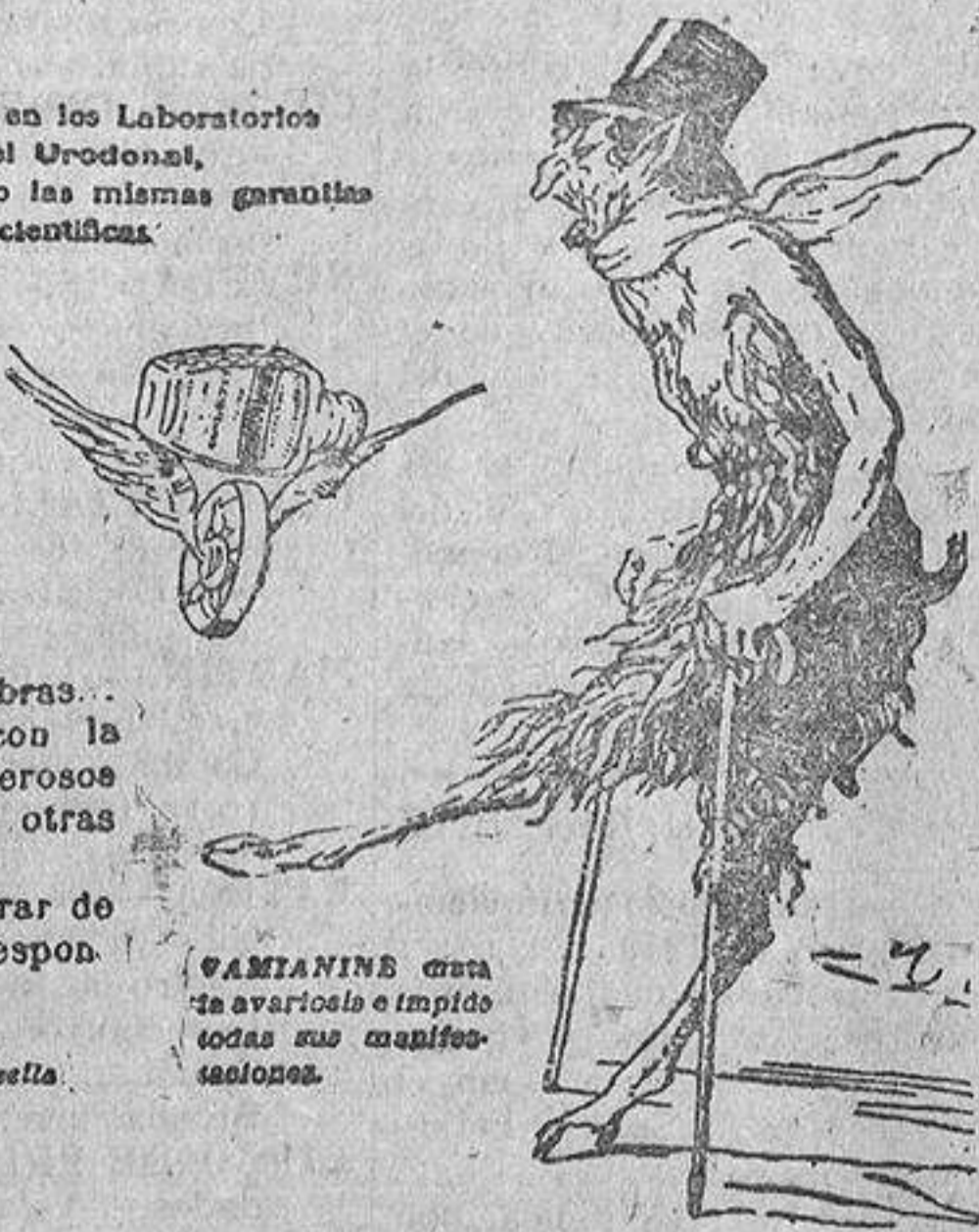
VAMIANINE cura la avariosis e impide todas sus manifestaciones.

Exigir la marca depositada: EL HOMBRE DE LAS TENAZAS