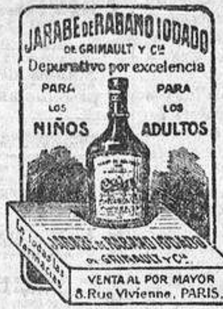
JARABE DE RABANO IODADO de GRIMAULT Y C.º Depurativo por excelencia PARA NIÑOS PARA ADULTOS VENTA POR MAYOR 8, Rue Vivienne, PARIS.

Espárragos de Fuentesauco, tiernos, blancos, gusto especial: 1,50 el manajo.—Calle del Barquillo, número 12, Mañoz.