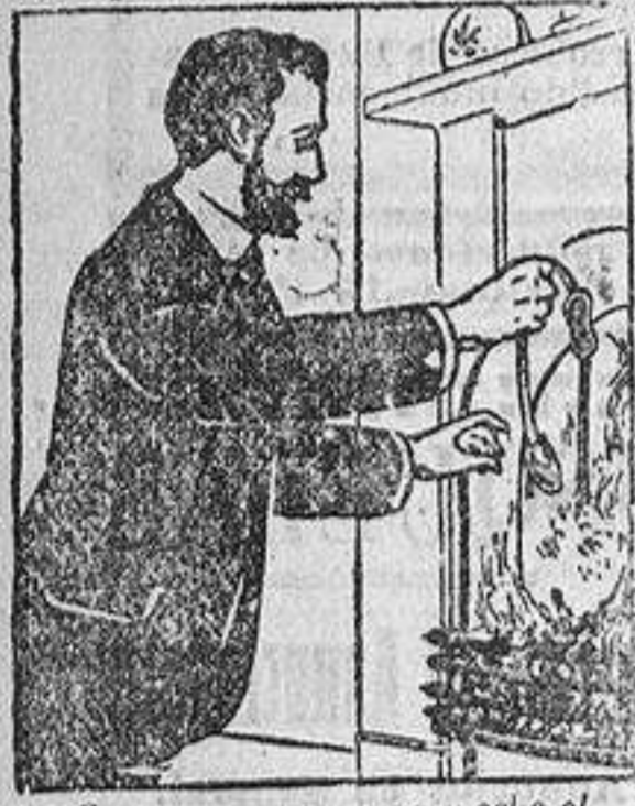
Curé su quebradura y eché el braguero al fuego.