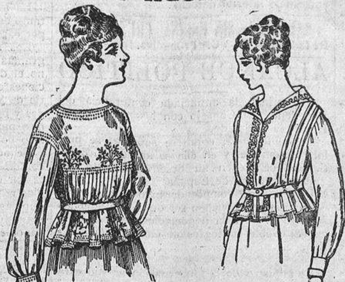
Blusa seda bordada, para señora, 4 ptas. 33. Gran surtido en blusas seda, variados modelos, de ptas. 10 a 35.

Sucursales: Barcelona, Alicante, Almería, Bilbao, Cádiz, Cartagena, Gijón, Granada, Málaga, Palma de Mallorca, Santander, Sevilla, Valencia, Valladolid y Zaragoza.