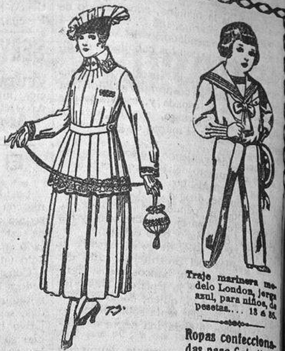
Traje marinero modelo London, jerga azul, para niños, de pesetas. 13 a 25.

Camisería, Géneros de punto, Corbatería, Guantería, Sombrerería, Zapatería, Paraguas, Bastones y Artículos de viaje.