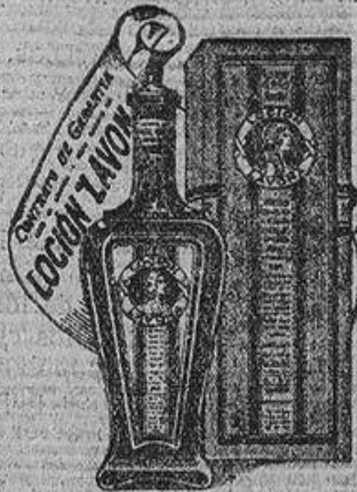
Esta Botella de Plaz. 5. de LOCION LAVONA.

No más Calvicie y cura la caída, la caída del pelo y todos los males del pelo y del pericraneo en 30 días, GRATIS.