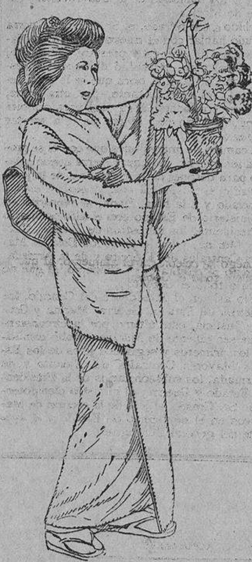
ASURU AOKI, la actriz japonesa que ha alcanzado un lugar pujante entre los artistas del «film»