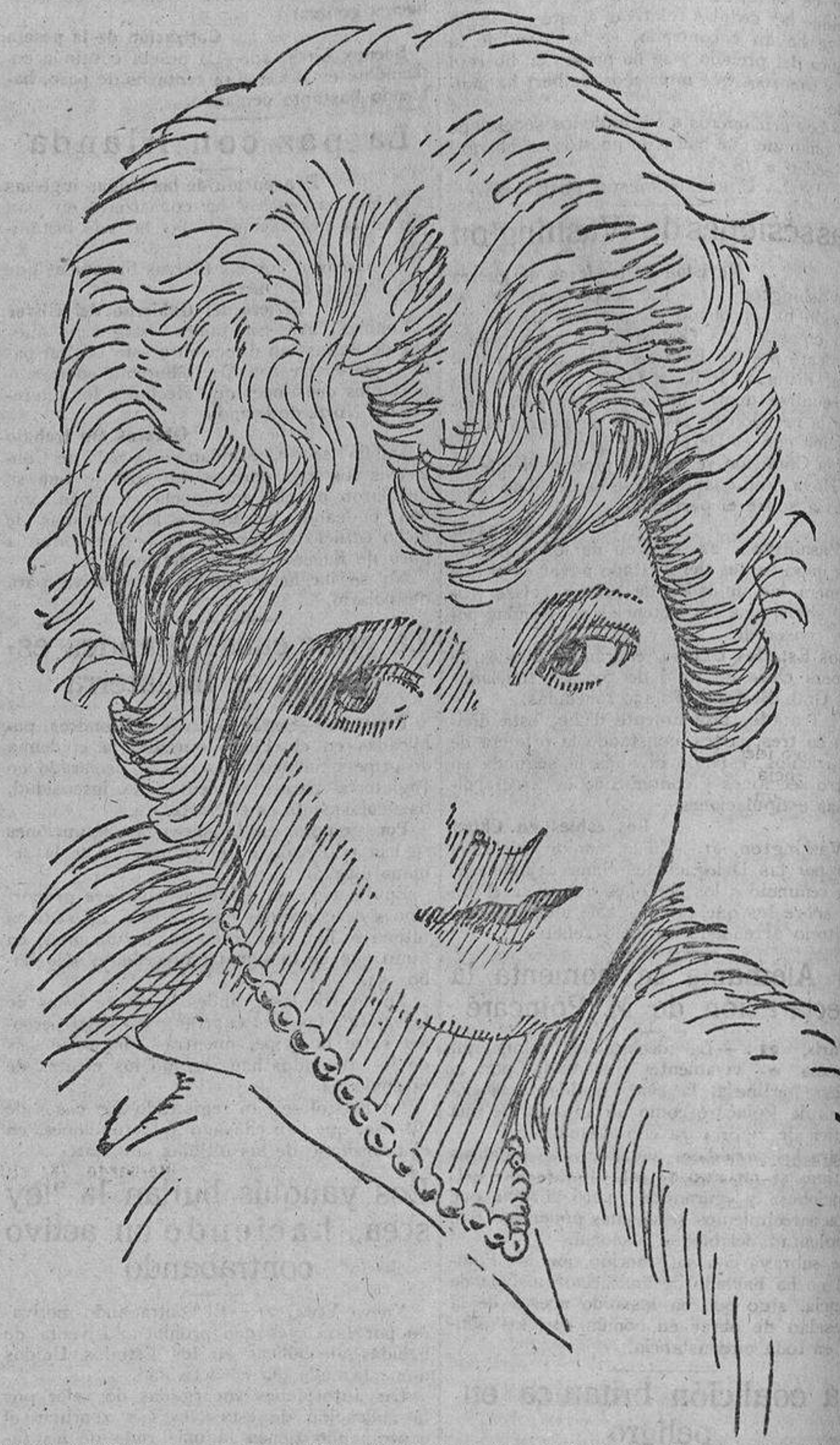
MAY AVOY, que cuenta sólo veinte años de edad, y que al segundo año de actuar ante el objetivo es ya una de las más eminentes artistas americanas