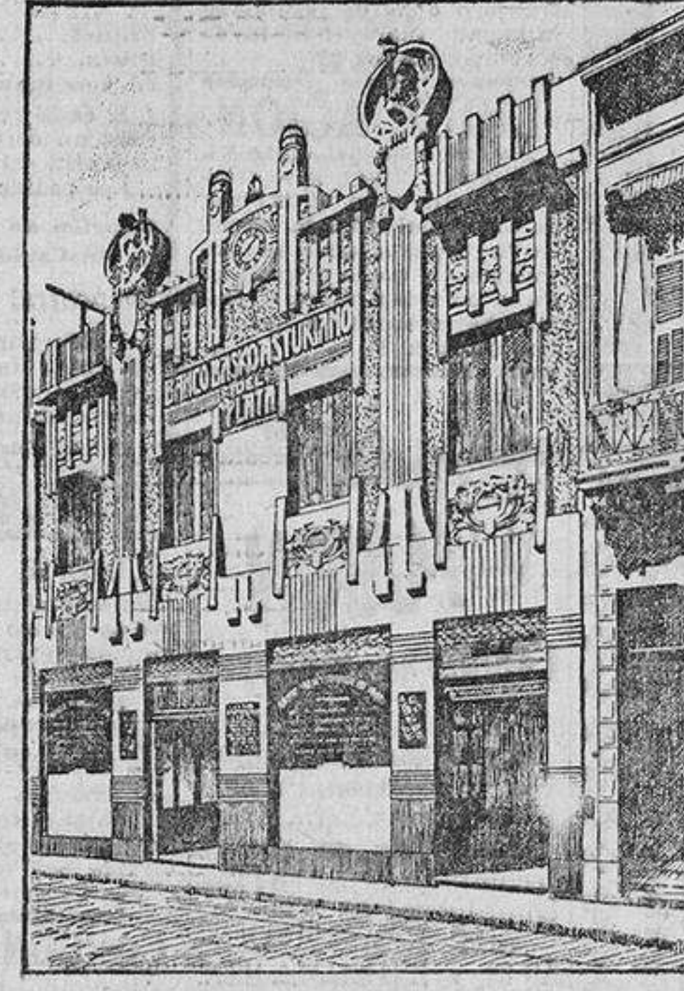
EDIFICIO DEL BANCO

Los grandes Mercados del Plata consumen anualmente del Extranjero productos por valor de 500 millones de pesos oro, y de España sólo 14.