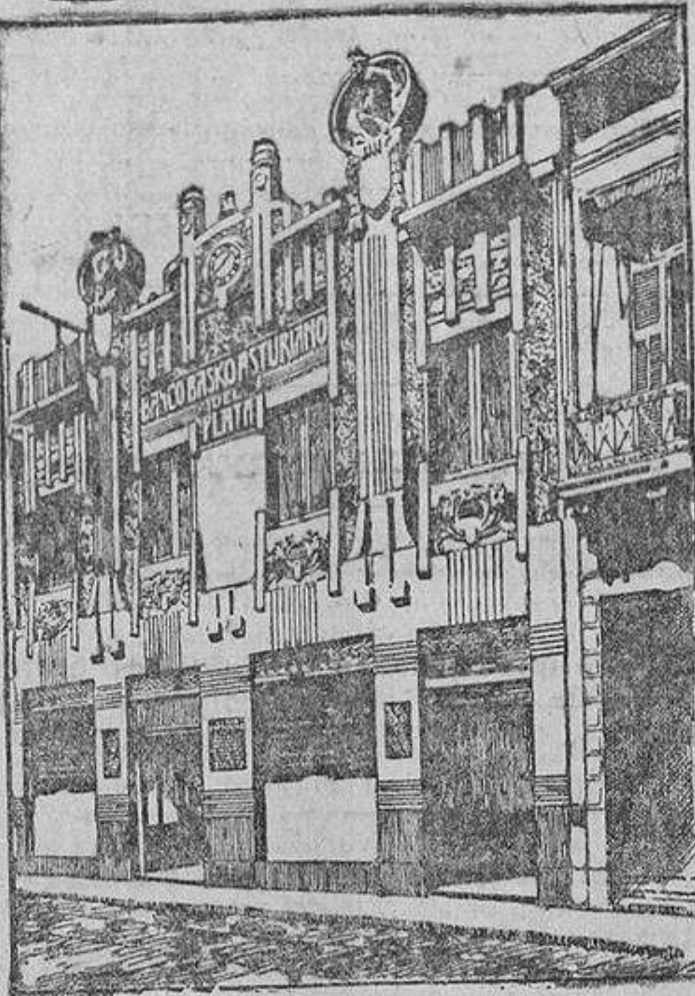
EDIFICIO DEL BANCO

Buenos Aires.—Calle Maipú, 73 al 87. Casilla de Correos, 619