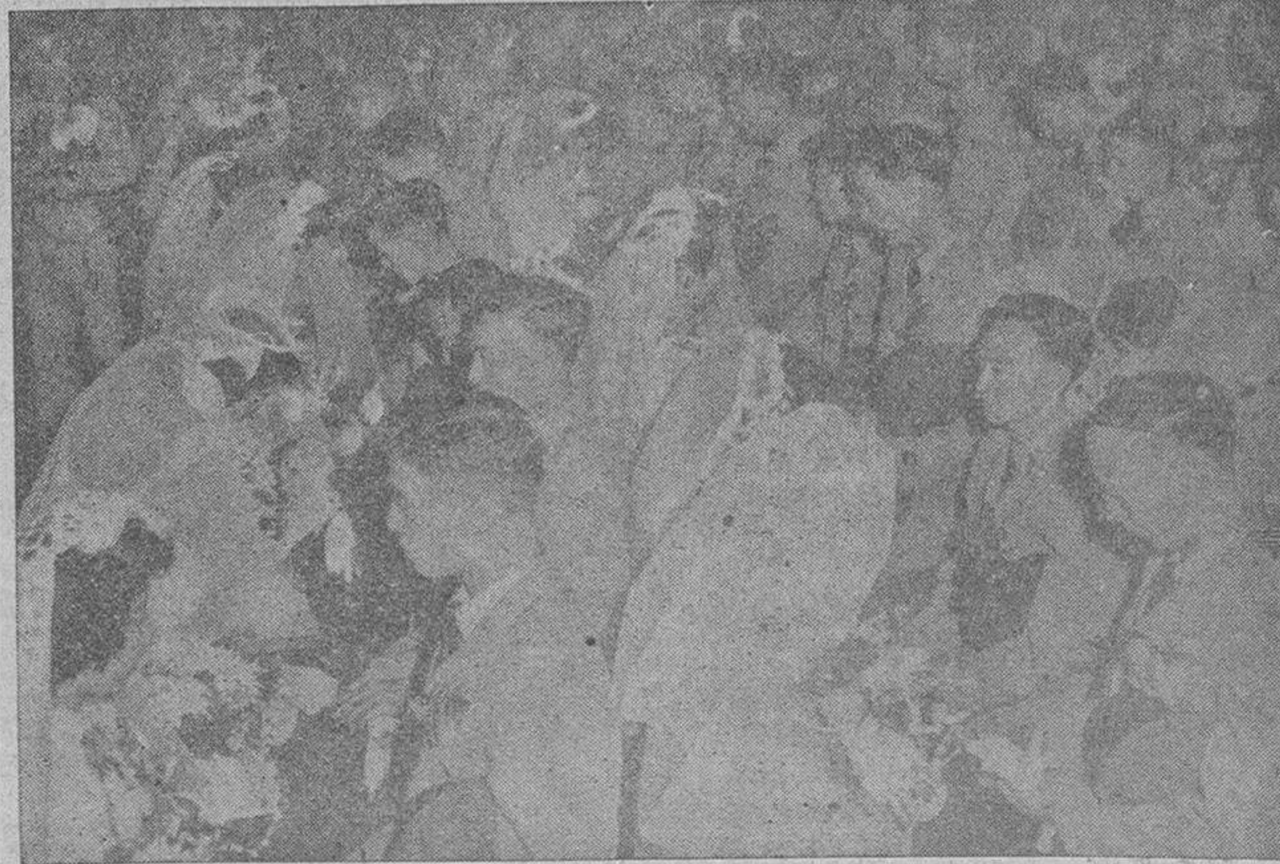
Los seguidores de Chang Kai Chek no sólo se limitan a realizar continuamente prácticas de adiestramiento militar y a cultivar las tierras. De vez en cuando, también nos ofrecen estampas tan emotivas como esta, en que numerosos oficiales y soldados de las Fuerzas Armadas contraen matrimonio en una ceremonia colectiva celebrada al aire libre

demorar punto de reposo, hasta el límite máximo, que los míos propios lo permitan. Yo os prometo también que (PASA A LA PLANA NUEVE)