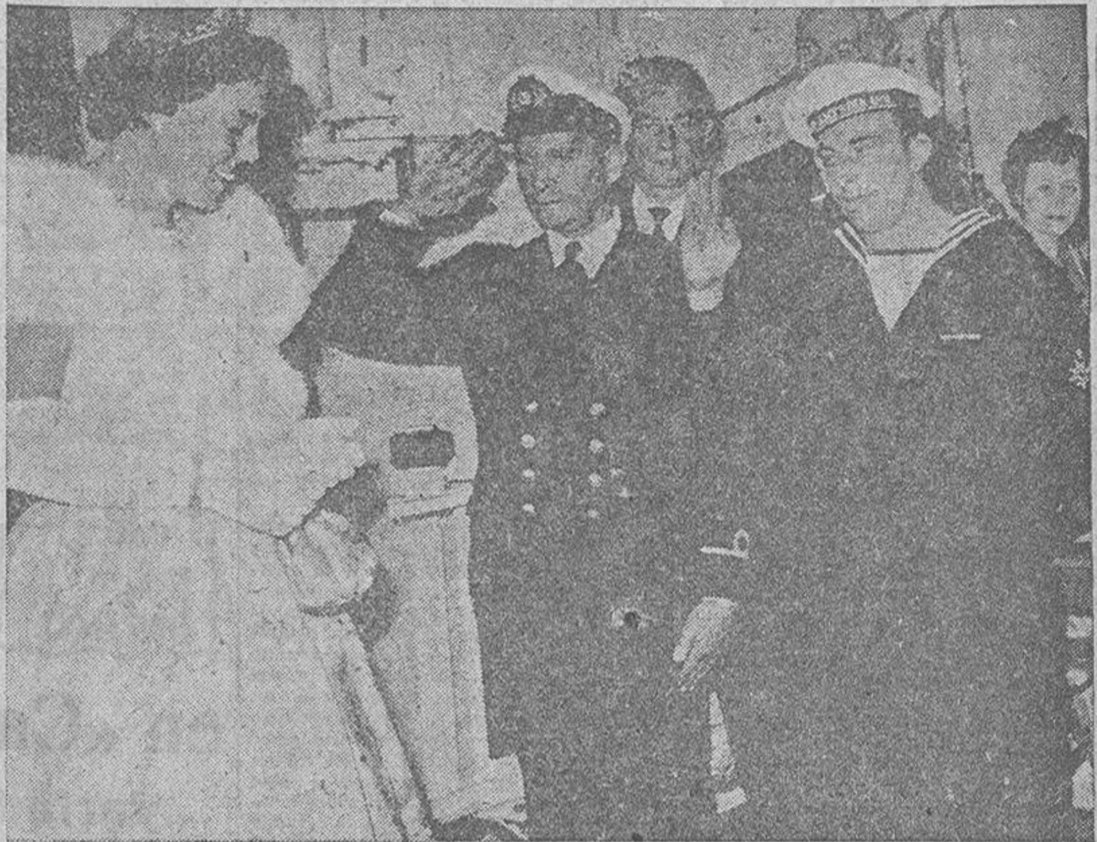
El gracioso saludo de este tripulante del trasatlántico "Rotterdam", tan al margen del protocolo palaciego, ha provocado la sonrisa de la Princesa Beatriz, heredera del Trono de Holanda. El hecho ocurrió en la travesía inaugural de la motonave a Nueva York, en el momento en que la Princesa subía a bordo para iniciar su viaje a Norteamérica, en donde ha sido recibida con todos los honores por el Presidente Eisenhower y su esposa. Beatriz ha asistido en los Estados Unidos a las fiestas conmemorativas del descubrimiento del río Hudson por un navegante holandés, hecho ocurrido hace trescientos cincuenta años.