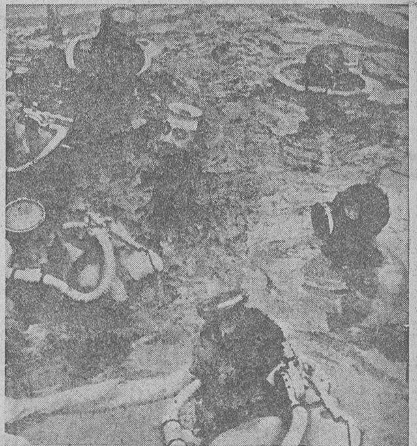
Acaban de celebrarse en Washington las pruebas para seleccionar a los primeros viajeros espaciales. Después de una dura competición, fueron escogidos doce, que en una segunda criba quedaron reducidos a estos siete que figuran en la piscina y que responden por Carpenter, Shepard, Schirra, Slayton, Glenn, Grisson y Cooper. Este equipo será el encargado de disputar a los astronautas soviéticos la conquista del mundo sideral.