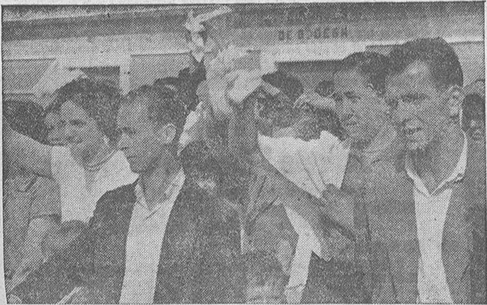
Escenas como estas se observan frecuentemente en el puerto coruñés. Los que se quedan despiden a los que se van. En unos y otros queda un componente de nostalgia: por no poder salir en busca de aventuras, o por dejar la tierra que les vio nacer

Y si este es el anverso de la medalla, el reverso lo constituyen los repatriados, que cansados de sufrir calamidades vuelven a la Patria que habían abandonado en busca de redención y amor. Aquí nos viene al recuerdo aquella célebre frase del inmortal don Jacinto Benavente, al equiparar la patria y la madre: "Todas las patrias y todas las madres nos quieren pequeños para que seamos más suyos. La diferencia es que la madre llora y acaricia; la patria dotiene y castiga".