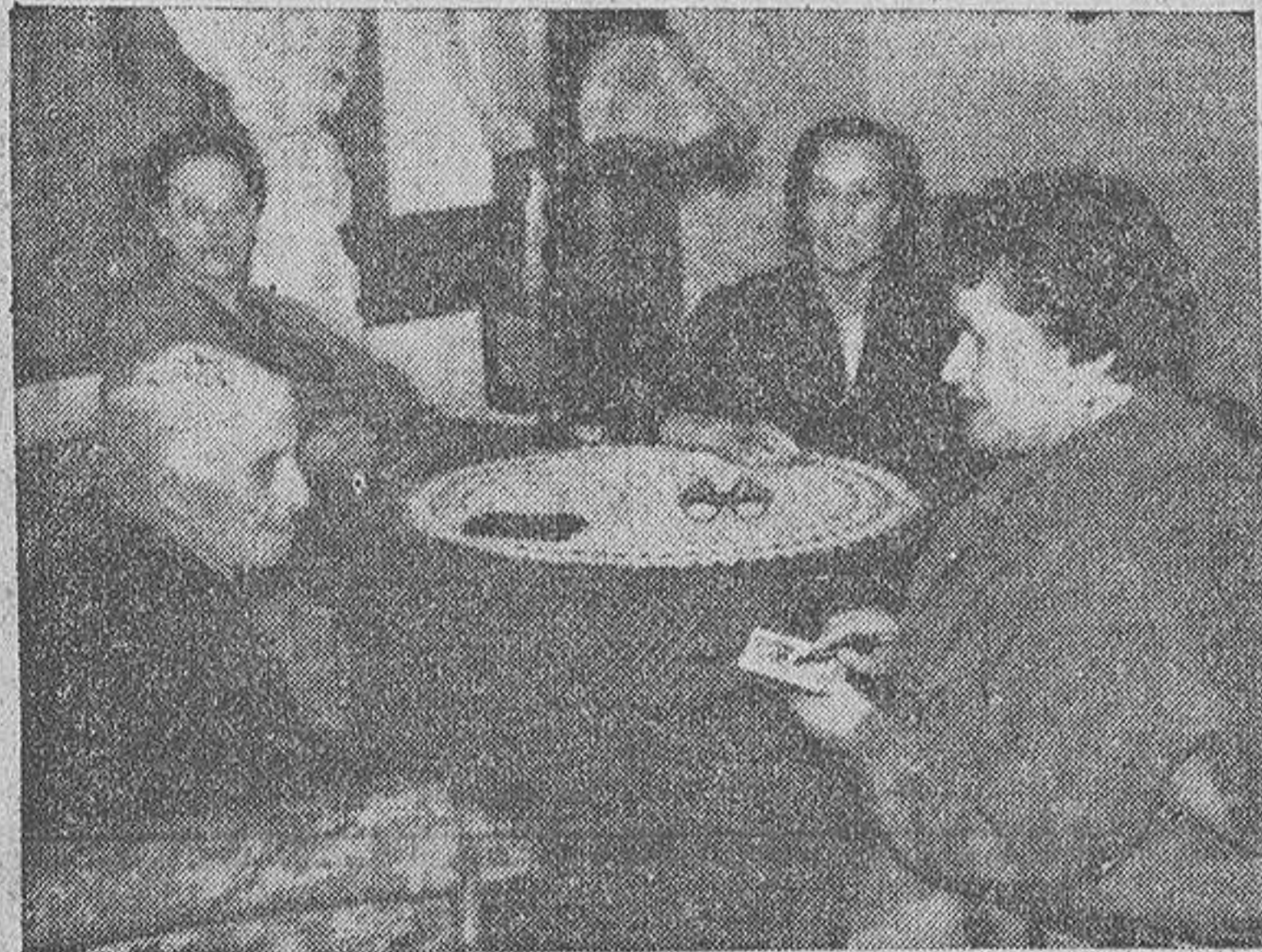
LA NONAGENARIA HABLA DE SU VIDA CON TOTAL LUCIDEZ A LA AUTORA DEL REPORTAJE

Las señoritas de López-Sors y López-Llamas, de distinguida familia coruñesa, vivieron mucho tiempo en Ferrol, donde su padre era director de una importante entidad bancaria y cuentan con generales afectos y consideraciones.