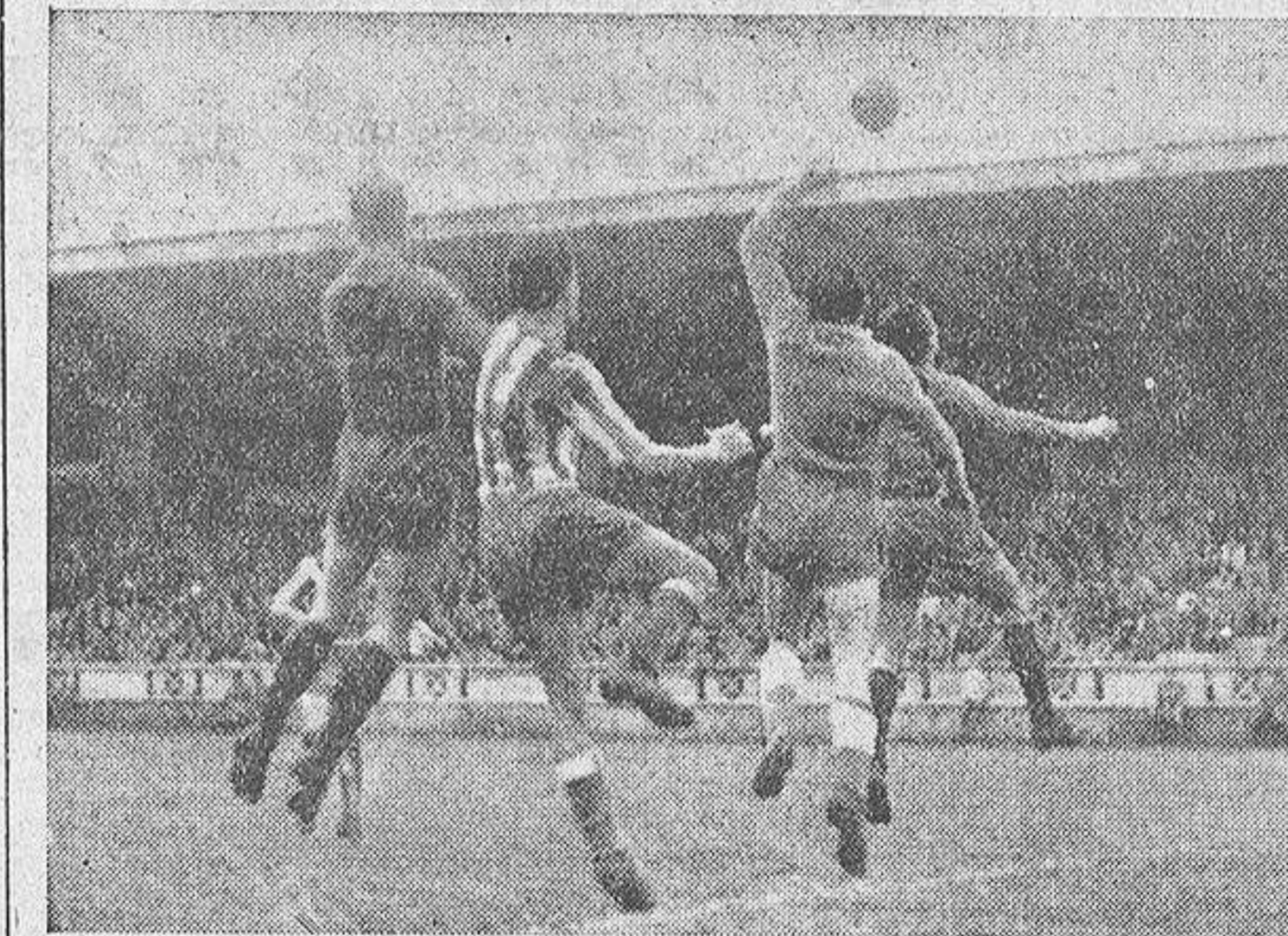
Lestón despeja una de las pocas situaciones apuradas porque atravesó la portería deportivista

El Deportivo ganó, sí, pero después de haber realizado un encuentro indiscutiblemente bajo y falto de interés para el espectador. Los tradicionales defectos del fútbol coruñés tuvieron ayer una nueva edición, corregida y aumentada y en beneficio innegable