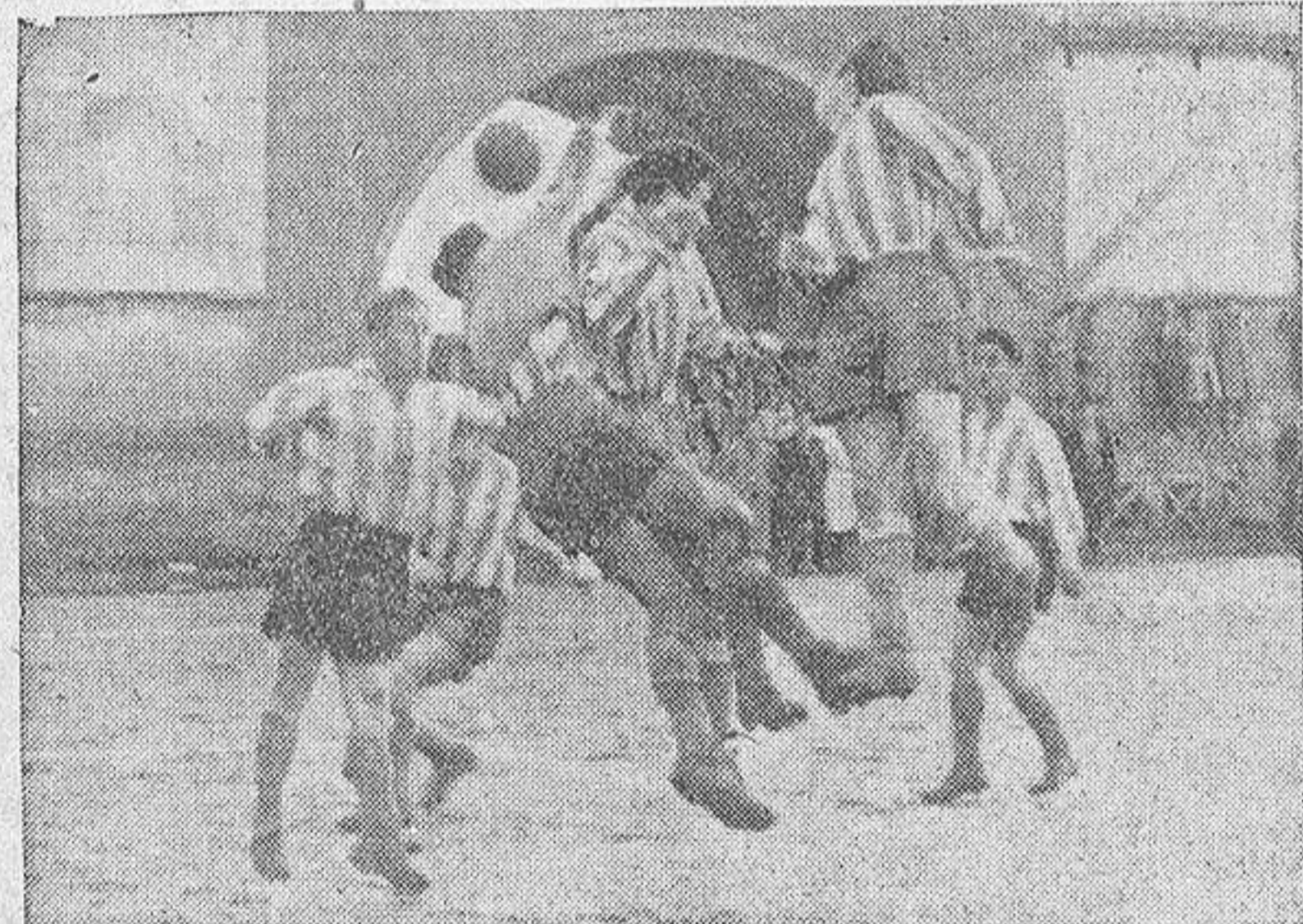
Un momento del encuentro entre el Juvenil y el Puentearreas, jugado en la mañana del domingo, en el campo de entrenamiento del Estadio

Interesante partido matinal jugado briosamente sobre un fango