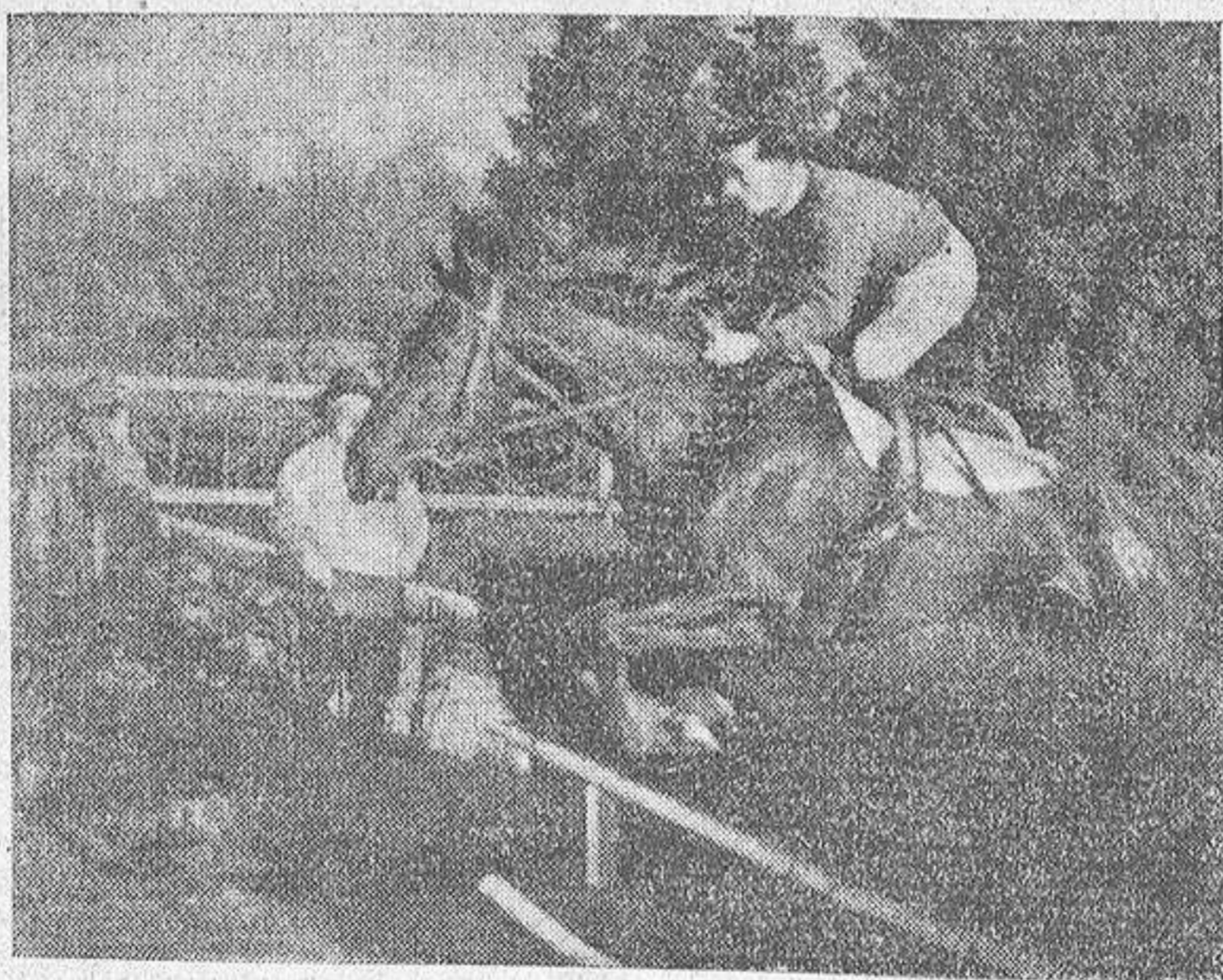
He aquí a "Fanfarrón IV", el caballo que, arrancado de un matadero, se convirtió en uno de los favoritos de los hipódromos franceses

Lleva ganados ya siete primeros premios y varios millones de francos