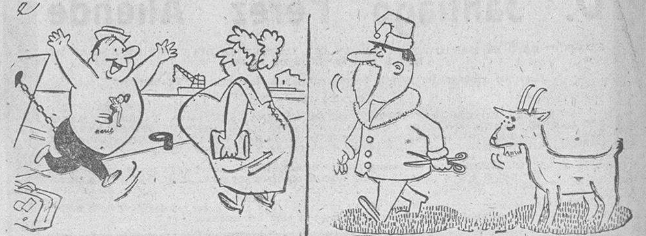
EL MARINO PIRANDON