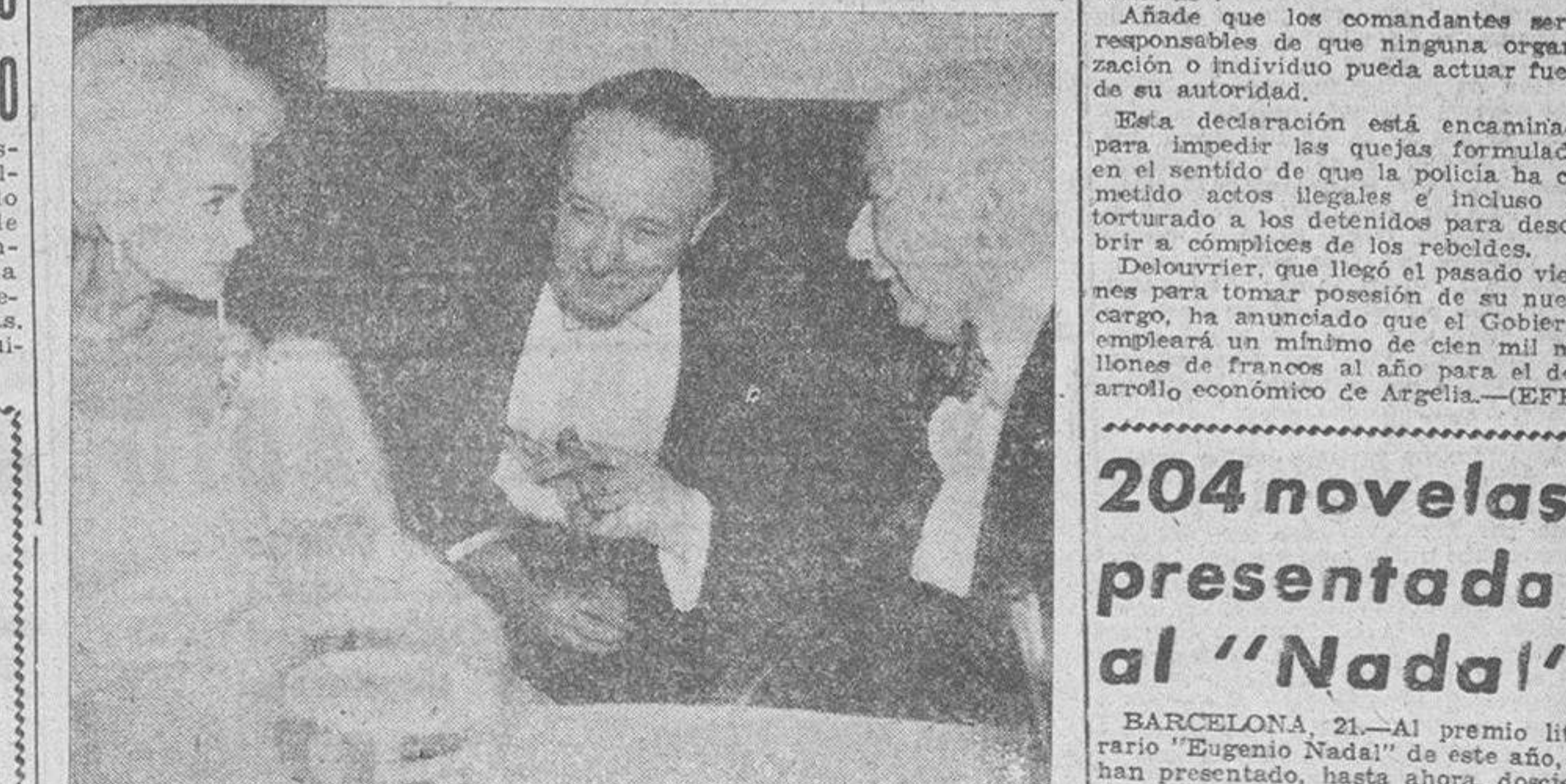
El tradicional Gran Baile de la Prensa que se celebra en Bad Neuenahr (Alemania) suele reunir a famosos periodistas, grandes artistas y personalidades políticas de seis países del Oeste europeo. La reina de la fiesta ha sido este año la actriz francesa Martine Carol, que en esta foto aparece en compañía de Theodor Heuss, Presidente de la República Federal alemana, y de François Seydoux, embajador de Francia en Bonn.