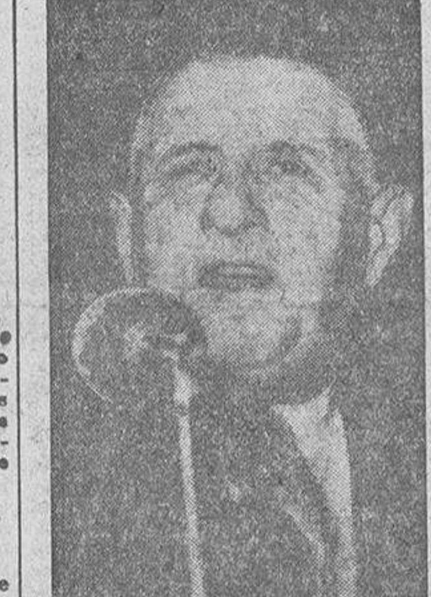
CHARLES DE GAULLE

Delouvrier, que llegó el pasado viernes para tomar posesión de su nuevo cargo, ha anunciado que el Gobierno empleará un mínimo de cien mil millones de francos al año para el desarrollo económico de Argelia.—(EFE).