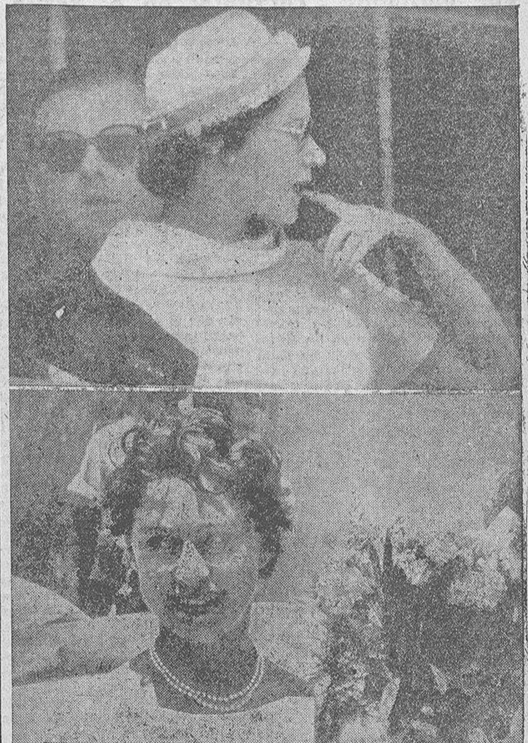
Ofrecemos aquí un curioso reportaje gráfico realizado a millares de kilómetros de distancia por dos periodistas distintos. En la primera de las fotografías aparece la Reina Isabel de Inglaterra siguiendo con la mirada ansiosa la marcha de su caballo favorito en las carreras de Epsom. En la otra, la Princesa Margarita muestra una cara radiante a su paso por las calles de la Isla de Dominica, último lugar que visitó en su viaje de luna de miel antes de regresar a Londres.

Durante varios días se registraron en Chile sacudidas sistimas de gran intensidad que provocaron inundaciones y otros desastres. Después de los terremotos, el sur del territorio ha quedado convertido en una región casi desértica. Durante más de tres semanas la tierra no ha cesado de temblar, a la vez que la gente vivía presa del terror. En esta foto se recoge una vista parcial de la zona afectada. Tras el superviviente del primer término, todo es ruina y desolación.