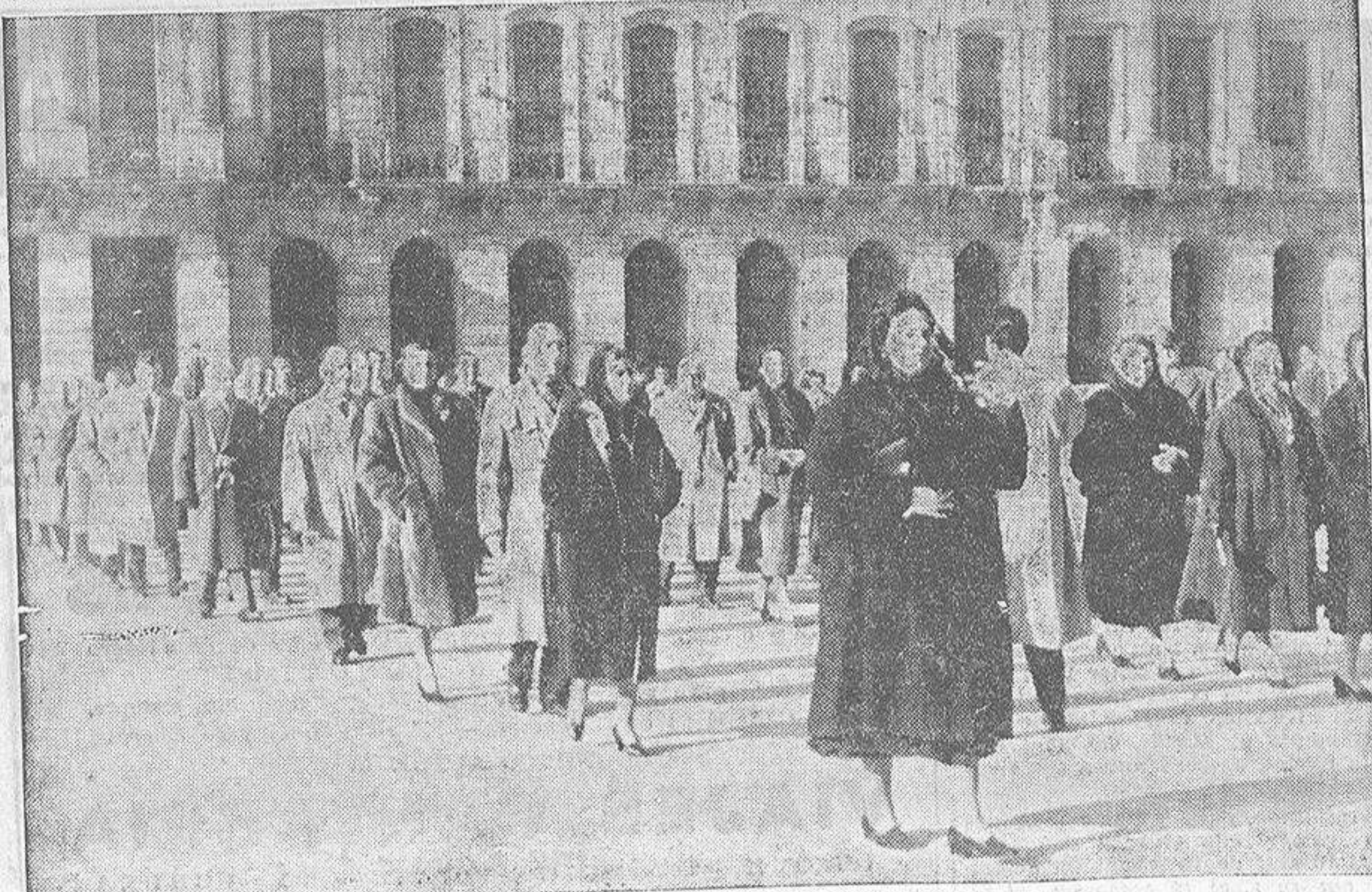
Desde el Palacio Municipal, los romeros coruñeses se dirigen en dos largas filas hasta la Basílica compostelana, en donde se lucraron con las gracias jubílares.

No obstante, dijo que la devastación de la tierra no se llevará a efecto hasta el año próximo, en que todos los actuales continentes quedarán sumergidos bajo las aguas. —(EFE).