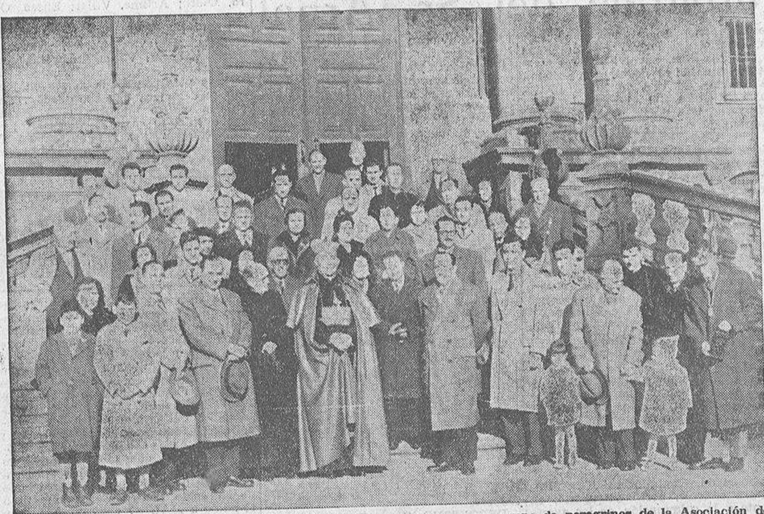
El Cardenal Arzobispo de Compostela, doctor Quiroga Palacios, con un grupo de peregrinos de la Asociación de la Prensa de La Coruña.