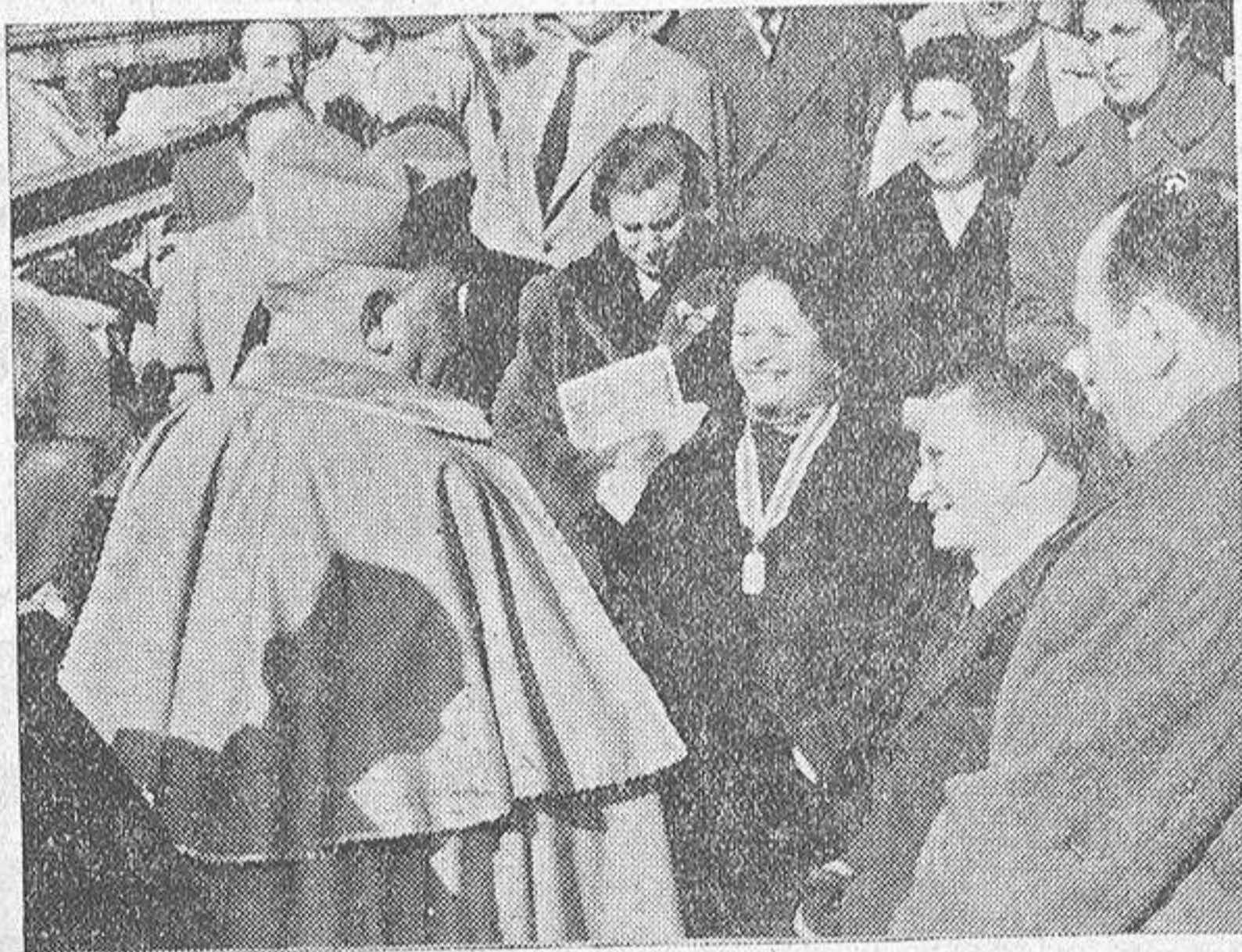
Una vez terminada la misa en la Catedral, el Prelado compostelano conversa con un grupo de peregrinos.

Siempre nos hemos inspirado en la santa doctrina de la fe católica, y siempre también hemos invocado en nuestros trabajos a nuestro santo Patrono San Francisco de Sales, para que inspirase todos nuestros buenos oficios en la obra trascendental del