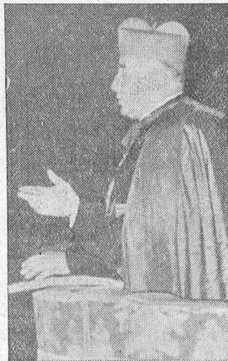
El Cardenal Arzobispo, Dr. Quiroga Palacios, contesta a la invocación del oferente.

Recordad siempre vuestra visita al Apóstol Santiago y no olvidéis, cuando cojáis vuestra pluma, que habéis de ser apóstoles de la Verdad, y él, el Patrono, os ayude, pues todos los