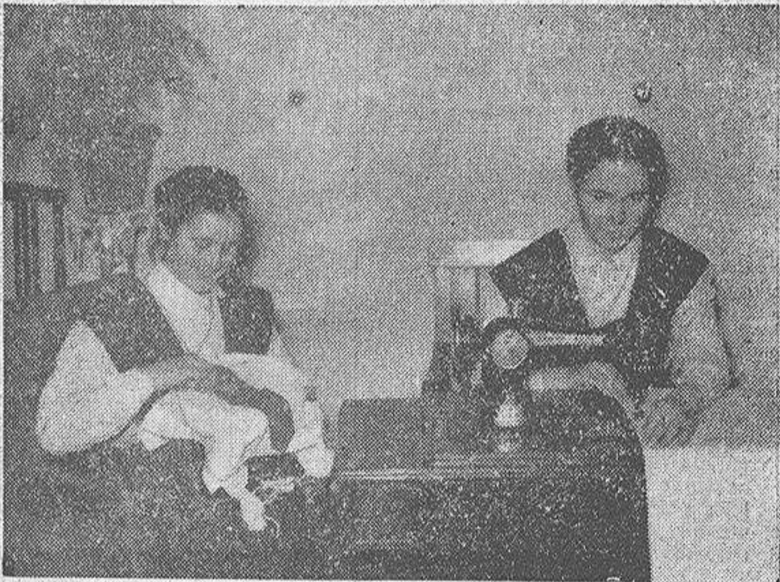
Las colegialas de la institución coruñesa de las Madres Adoratrices, en un ambiente profundamente educativo y religioso, aprenden las diversas labores propias de su sexo, que luego les servirán para enfrentarse con la vida en magníficas condiciones de éxito.