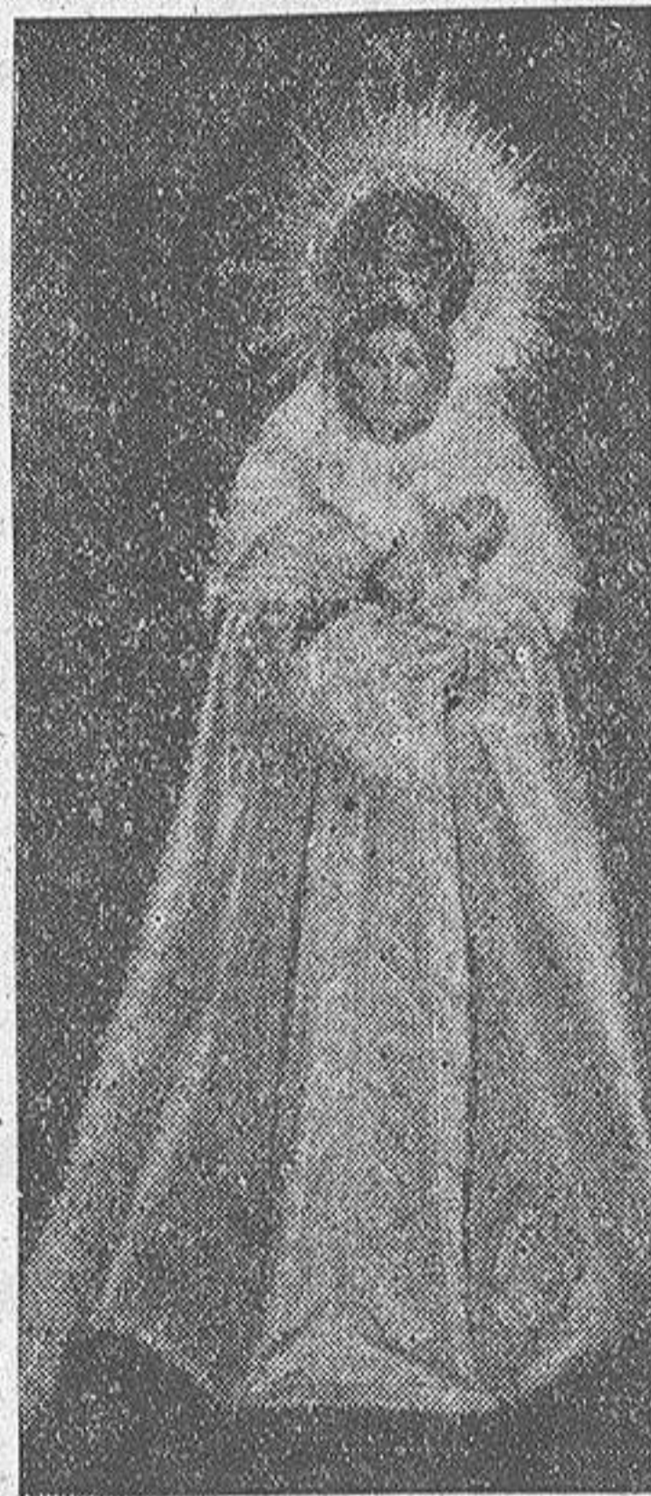
Esta imagen de la Virgen de Europa será un día sustituida al lugar que en el Peñón de Gibraltar debió ocupar siempre, y no ocupa desde agosto de 1704. Es obra del escultor valenciano y procurador en Cortes, don Valentín Rodilla.

LAS MEJORES ESCUELAS DE ESPAÑA EN UNA COMPETICION DE ALTO VALOR FORMATIVO DE LA JUVENTUD Y GRAN BELLEZA PARA EL ESPECTADOR.