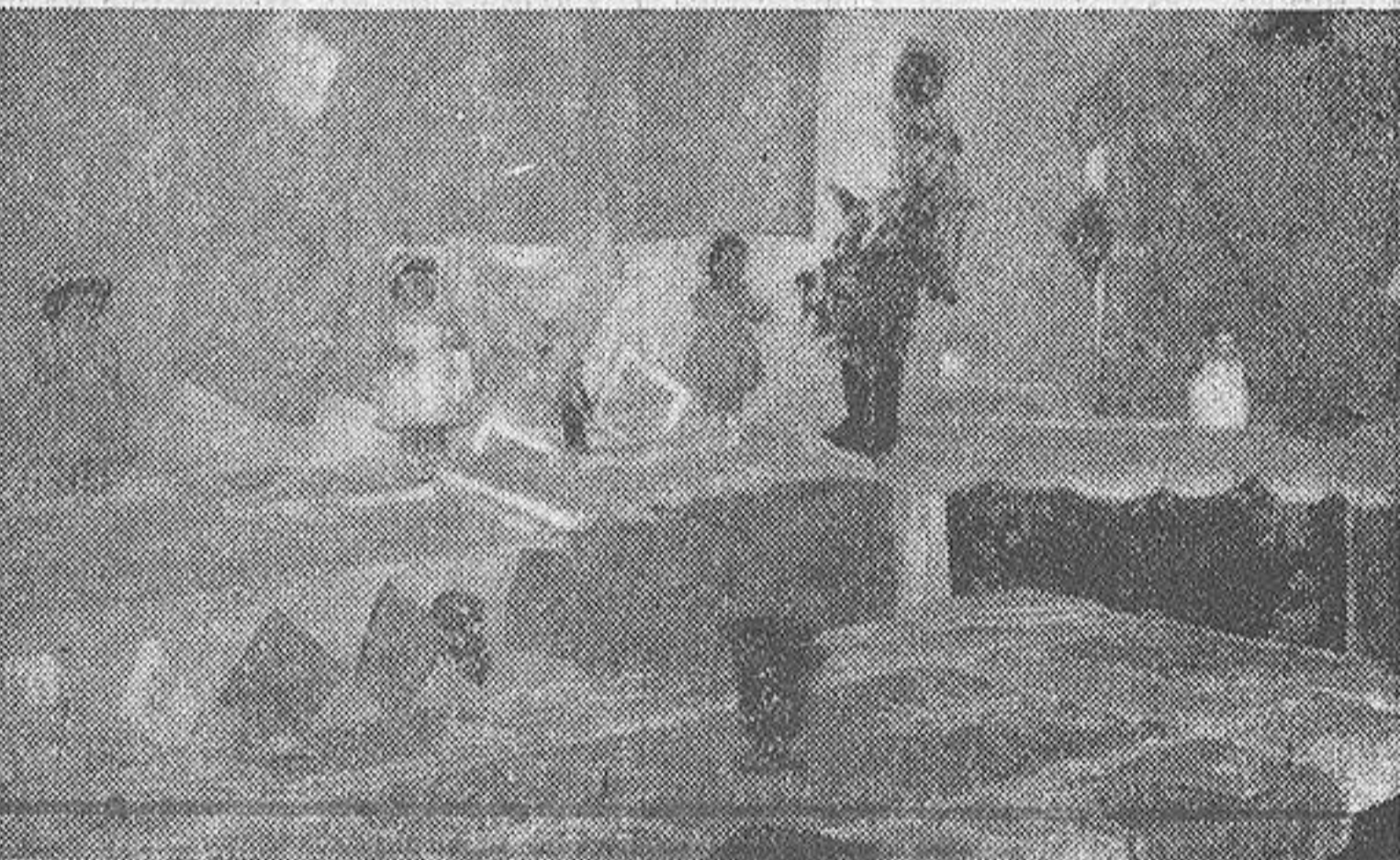
Un aspecto de la exposición de labores en una sala del Colegio de las Madres Adoratrices