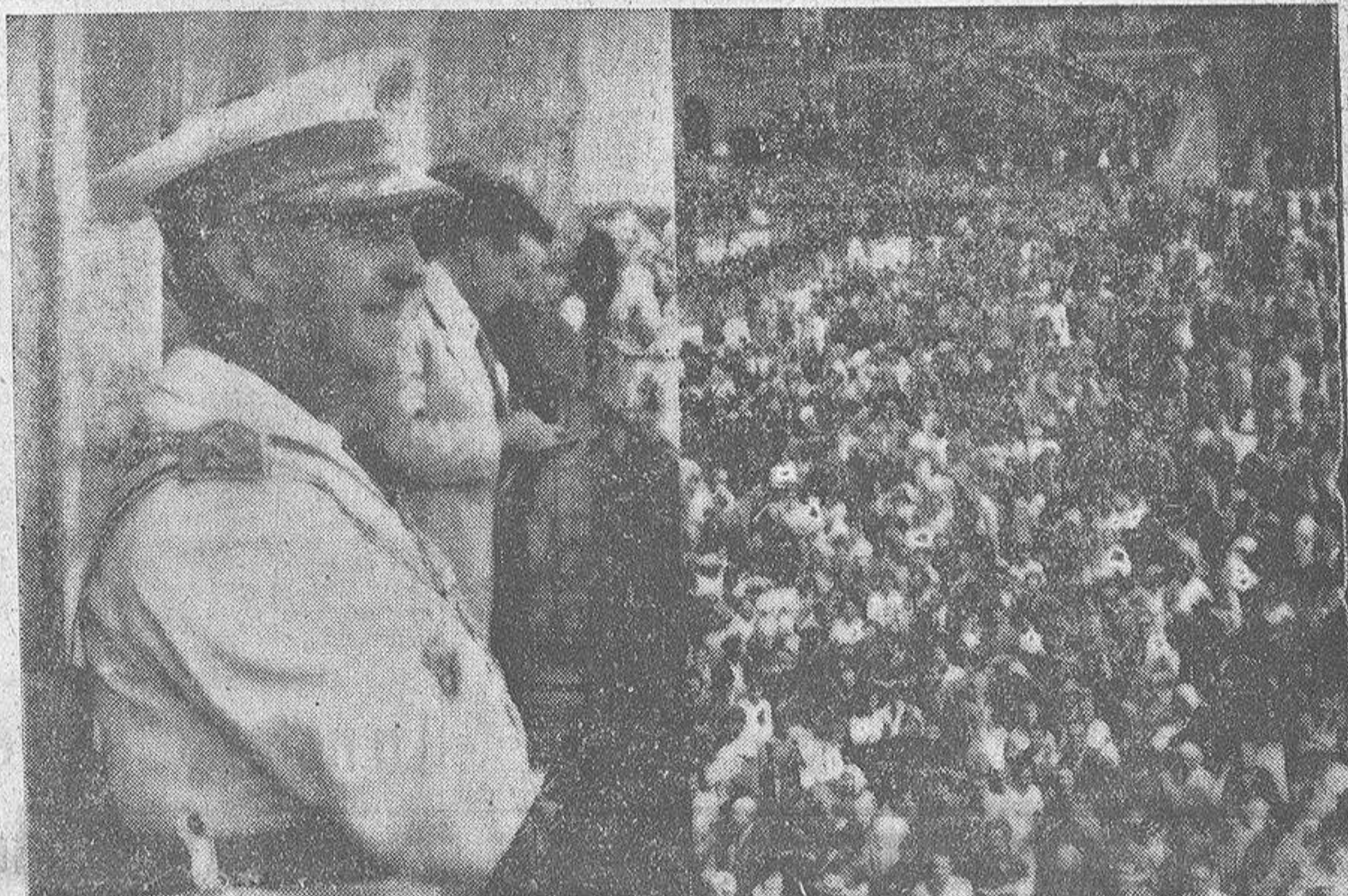
Desde uno de los balcones del Palacio Municipal, Su Excelencia el Jefe del Estado recibe el emocionado homenaje del pueblo compostelano. En la otra foto, un aspecto del gentío estacionado en la Plaza del Obradoiro.

En tus manos, Santísimo Patrón, confío la protección y el destino de nuestra Patria No podemos dormirnos en los laureles y descuidar la tarea de nuestra perfección Invocación del Jefe del Estado