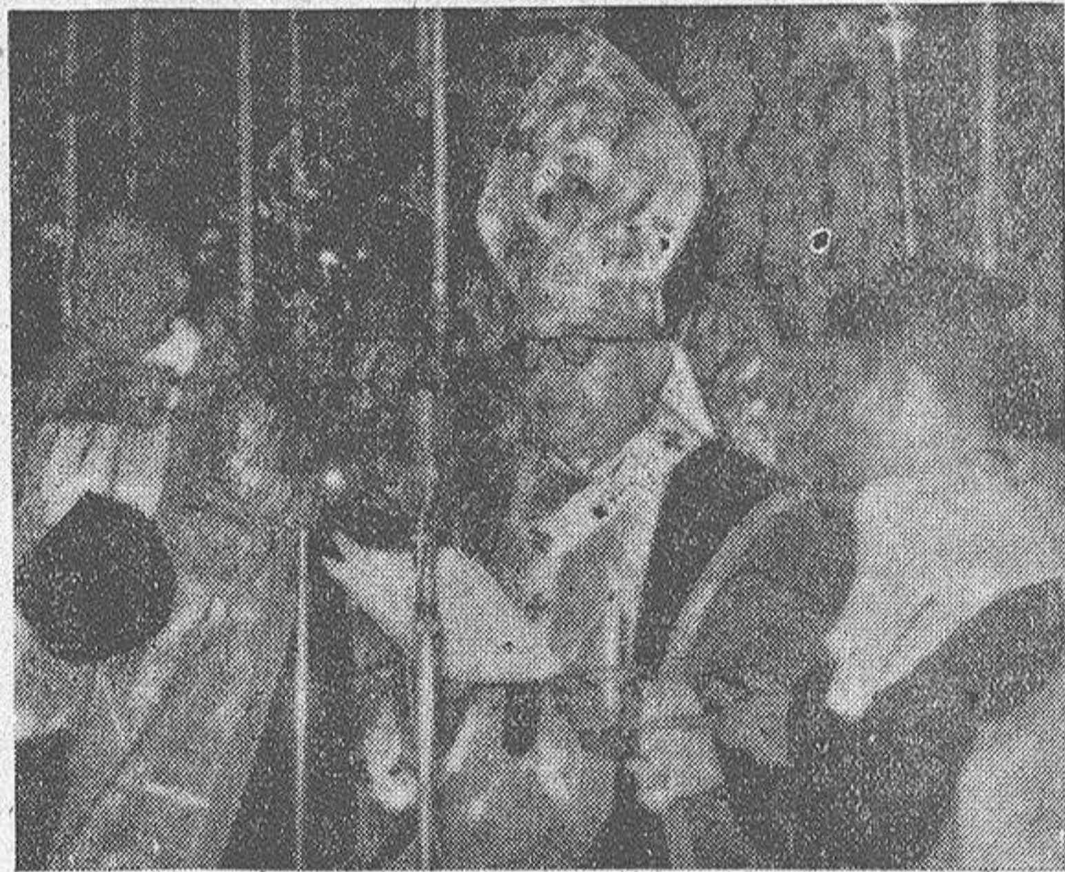
El Cardenal Arzobispo de Compostela, doctor Quiroga Palacios, contesta a la Invocación del oferente

Por eso, no pueden menos de causar extrañeza y dolor los desafortunados comentarios que más allá de las fronteras se hicieron en estos últimos tiempos acerca de la cuestión religiosa en España. ¿No es acaso una tesis teológico-jurídica --que debe ser sostenida por todos los que admiten los rectos principios de la Etica y del Derecho Natural y de la Teología Fundamental--, que toda sociedad, y por consiguiente, todo Estado, está obligado a abrazar, y a profesar, y a conservar, y a proteger la verdadera religión, que sólo es la católica? ¿No se dice en los Salmos que las naciones y sus gobernantes tienen el deber de someterse a la Ley del Señor y que a él deben servir en todo momento? ¿No recuerda Isaías el castigo que espera a los pueblos y a los reinos que no se someten a Dios y a su Iglesia? ¿No afirma San Pablo que los que ejercen la autoridad son ministros de Dios, y no se deduce de ahí la clara consecuencia de que su primer deber es