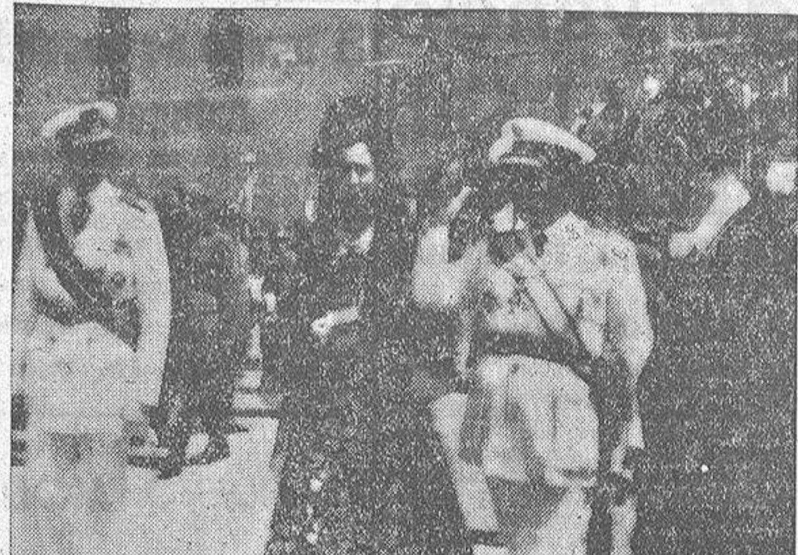
El Caudillo corresponde a los vitores y aclamaciones de la población compostelana, a la salida de la Catedral

Poco después se formaba en la Capilla Mayor, con todo relieve religioso, la procesion mitrada; que consiste en el desfile de todas las autoridades y representaciones oficiales, presididas por el oferente, que este año ha