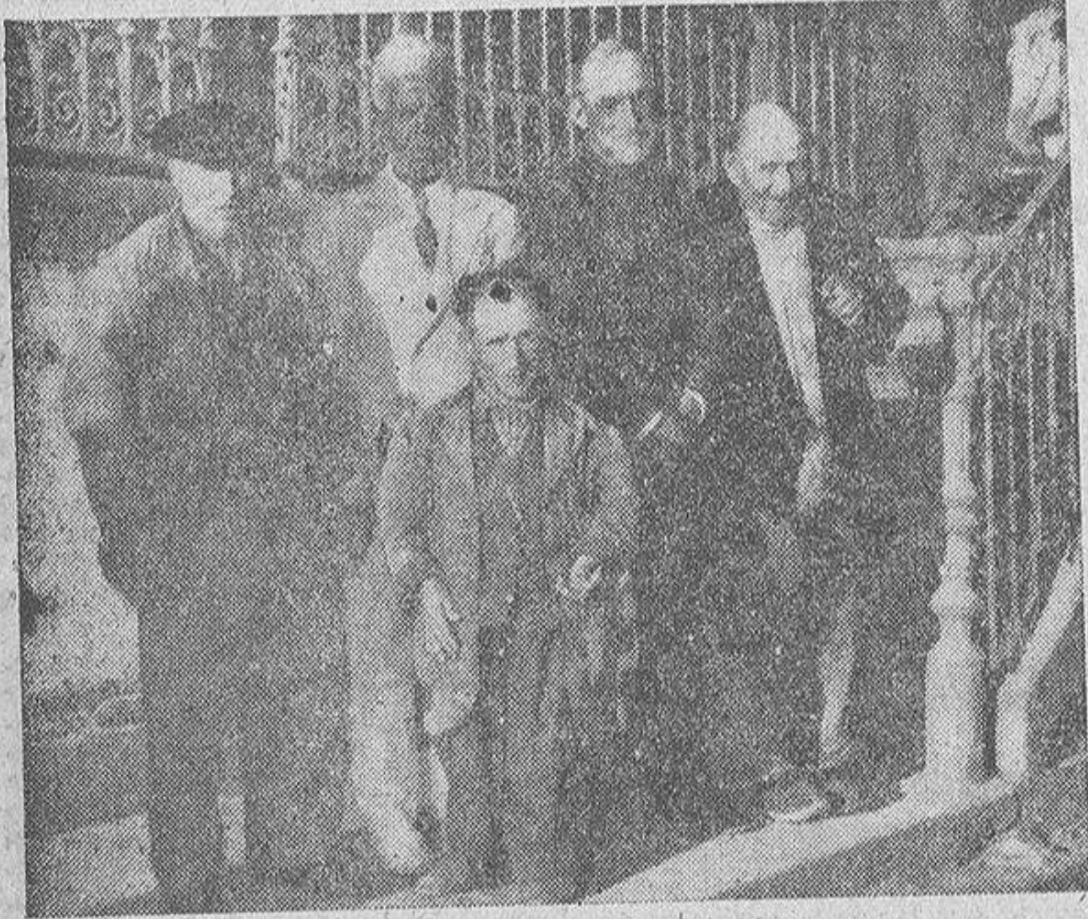
Para cualquier coruñés, todas las caras de la fotografía son harto conocidas: el vendedor de periódicos, el negro de las corbatas, el mendigo profesional y, en primer término, el mutilado que no lo es. Los que han tenido una existencia feliz y hasta próspera, se niegan al retrato. En el asilo de ancianos todos esperan...

No perdió la esperanza de triunfar y espera exponer en La Coruña Por RUBEN SAN JULIAN