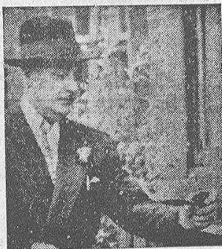
El inspector Capstick, uno de los "cinco grandes" de Scotland Yard, que con la ayuda de un cuervo y de una madeja de lana descubrió al asesino en el "misterio de Carmarthen"