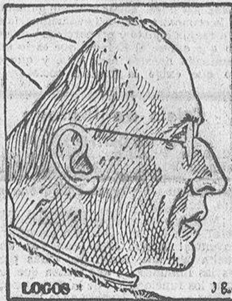
LOGOS * J.B.

El Santo Padre, después de dirigir su mensaje de Pascua, impartió la bendición "urbi et orbi"