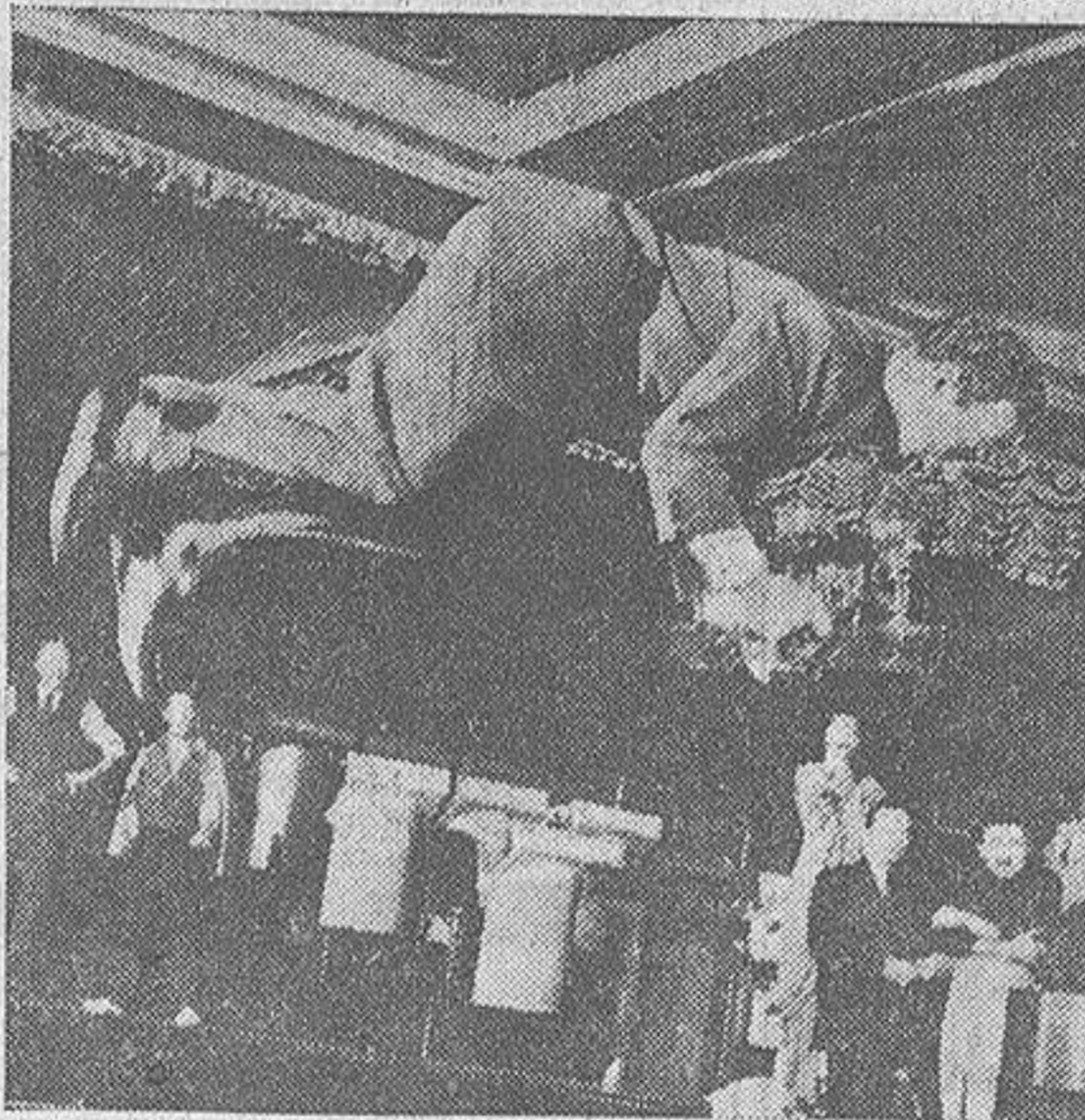
Bonito juego, propio para sobremesa cuando invitan a uno a comer en una casa de cumplido. Coja usted una bandeja de cristal de Bohemia con varias copas llenas de vino. Advierta usted a todos que va a hacer algo sonado, y, cuando mayor sea la expectación, tome carrerilla y dé un salto como éste. Probablemente se hará usted célebre...