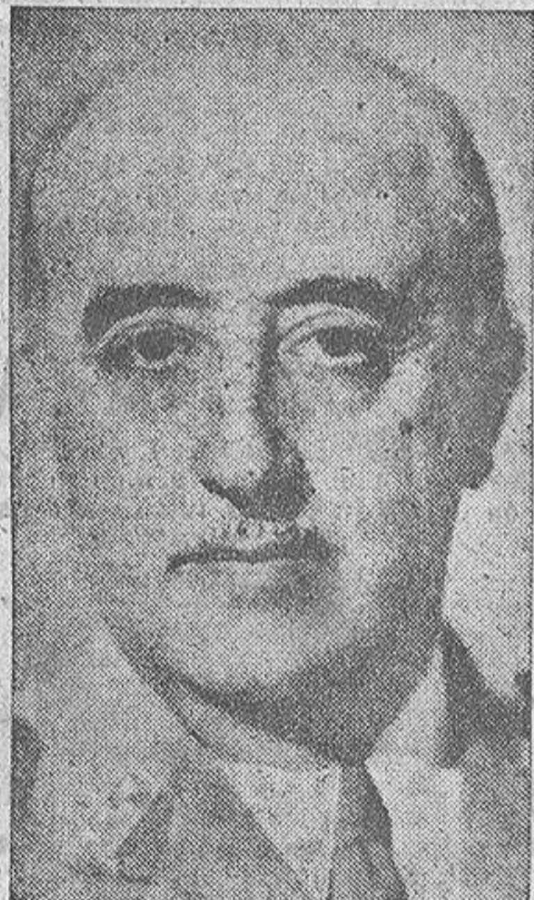
MADRID, 23.—S. E. el jefe del Estado ha hecho unas importantes declaraciones al director de "Arriba", y que hoy publica el citado diario.

He aquí el interesantísimo diálogo sostenido: