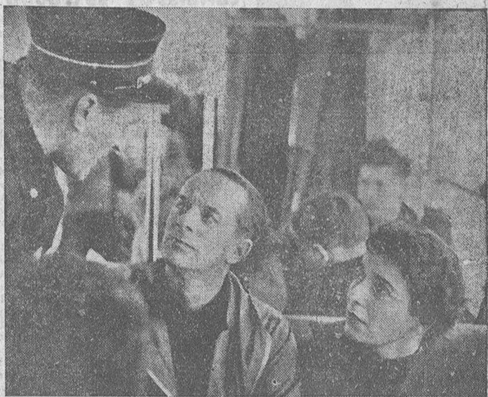
Jacobo Arbenz, exdictador comunista de Guatemala, después de abandonar la embajada donde se refugió, ha llegado a Suiza con su mujer y sus hijos. El padre de Arbenz, era suizo, y el político guatemalteco pretende ahora valerse de eso para hacerse súbdito de dicho país. He lo aquí con su esposa viajando en un trolebús de la ciudad de Zermatt mientras que allá en Guatemala yacen numerosos anticomunistas asesinados, después de ser torturados en las chekas que funcionaban bajo su mandato.