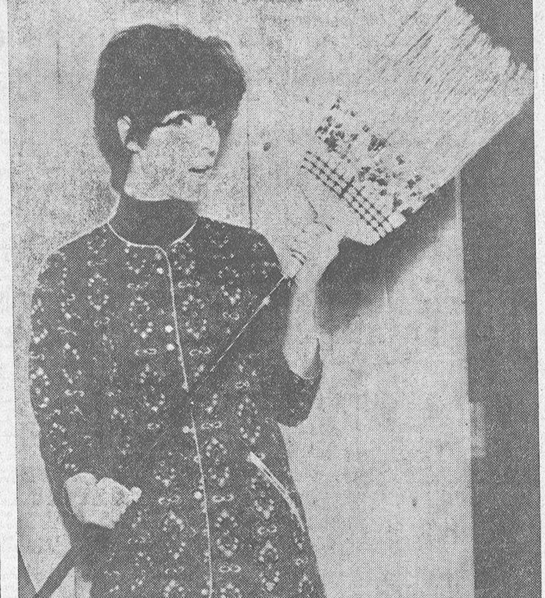
La limpieza del hogar ha dejado de ser una pesadilla para la sufrida ama de casa. Su labor se facilita por toda clase de productos lanzados al mercado con este fin. La vieja escoba, símbolo de la esclavitud femenina, tiende a desaparecer y en su esfuerzo por sobrevivir, se adorna con cenefas y flores para camuflar su origen humilde.

CADA ama de casa debería emplear únicamente los productos de limpieza que corresponden a sus necesidades. Disponería entonces de un juego completo de limpieza, funcional, práctico y al mismo tiempo económico. En vez de adquirir un cierto número de líquidos, de polvos y pastas que emplea muy raramente, haría mejor en seleccionar su material de limpieza con discernimiento, y sobre todo, en función de su piso o apartamento.