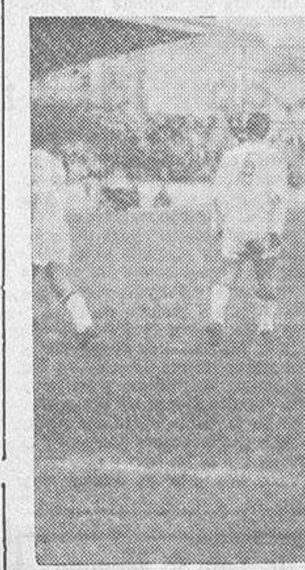
Momento de euforia deportivista, tras lograrse el gol del empate frente al Sevilla cuando quedaba tiempo para remontar el tanteo.

Tras el descanso, los ataques, como oleadas, del Deportivo se sucedieron. Pero un ataque sin orden, embarullados, estériles. Se sucedían los saques de ángulo sobre el área del Sevilla; un centro de Ribada lo remató duramente Idigoras y rebotó en la madera... Y llegó el gol de Goñi, utilizando un nuevo rechazo del palo. Entonces todavía fue más violenta la ofensiva coruñesa, que llegó, por momentos, al grado de asedio. Sin embargo, el empate a