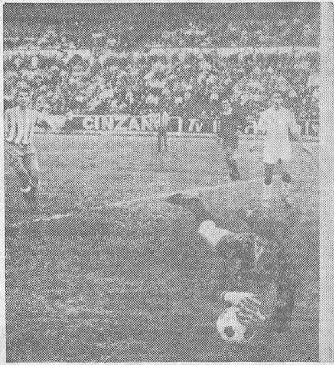
Rodri, portero sevillista, tuvo una aceptable actuación. Aquí lo vemos en una de sus positivas intervenciones.

Así las cosas, el Sevilla, que venía a algo más positivo que a prolongar y defender el empate, mantuvo no a tres como es lo habitual, sino a cuatro delanteros en posición más o menos avanzada, en tanto que detrás alternaba el juego de cuatro defensas y dos medios con el de tres medios y