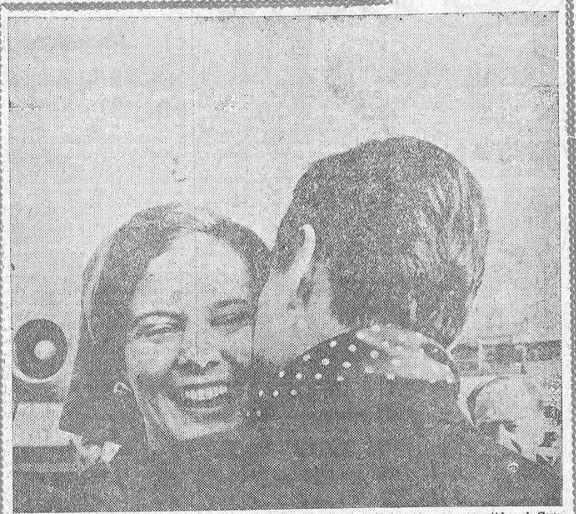
He aquí el momento en que la Princesa Margarita de Dinamarca abraza a su prometido, el Conde Henri de Monpezat, a la llegada al aeropuerto parisiense de Le Bourget. La joven ha visitado el vecino país en compañía de sus padres, los soberanos daneses. El Presidente De Gaulle y su esposa ofrecieron un almuerzo en el Eliseo en honor de sus regios visitantes. Los jóvenes prometidos, como es de suponer, han aprovechado su encuentro para visitar cuanto de más notable o de más evocador encierra la capital francesa. Su boda se celebrará el próximo día 10 de junio, y, como ya saben los lectores, Henri ha tenido que renunciar a su nacionalidad para poder contraer matrimonio

El nuevo Presidente ha agregado que la decisión del Congreso de desposeer al Presidente Sukarno de sus poderes marcaba "un nuevo jalón en la historia de nuestro país, que en los últimos años ha visto dificultado su progreso por el viejo orden".—(EFE).