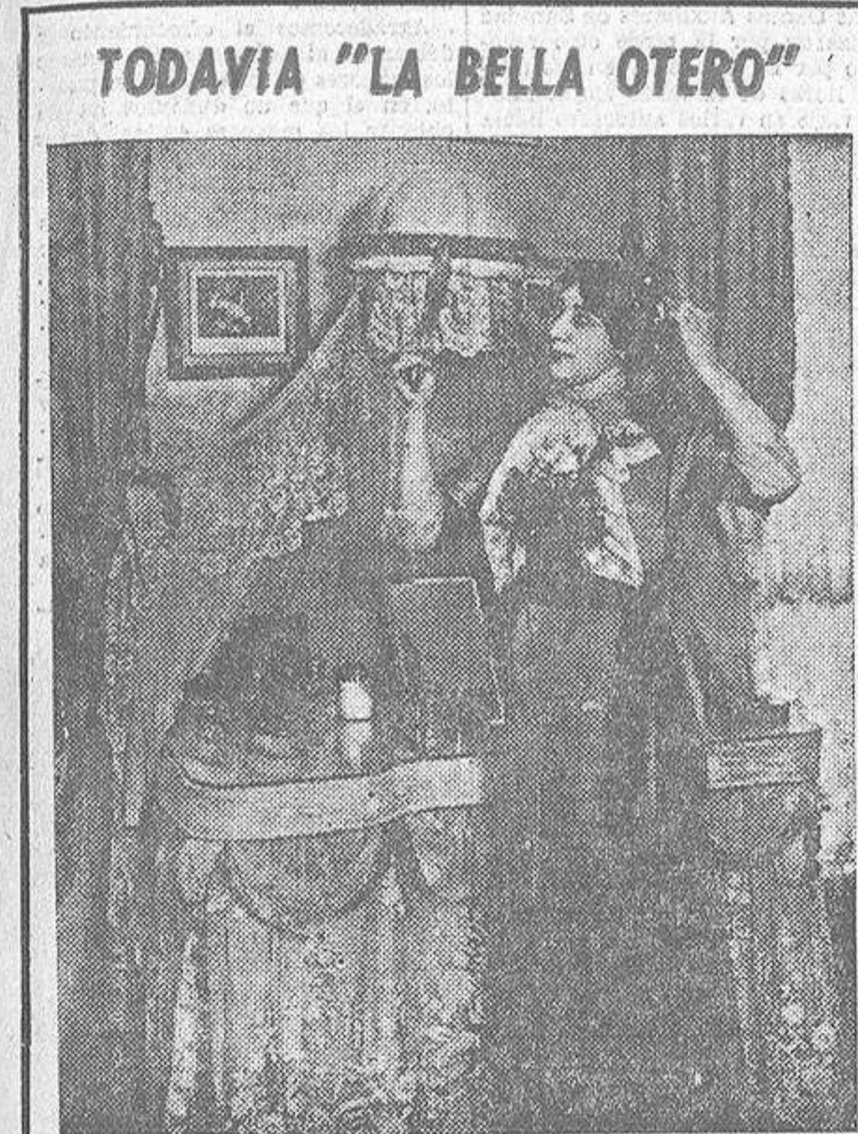
TODAVIA "LA BELLA OTERO"

Fué realizada por la Policía y por fuerzas del Ejército adicto a Imbert Barrera