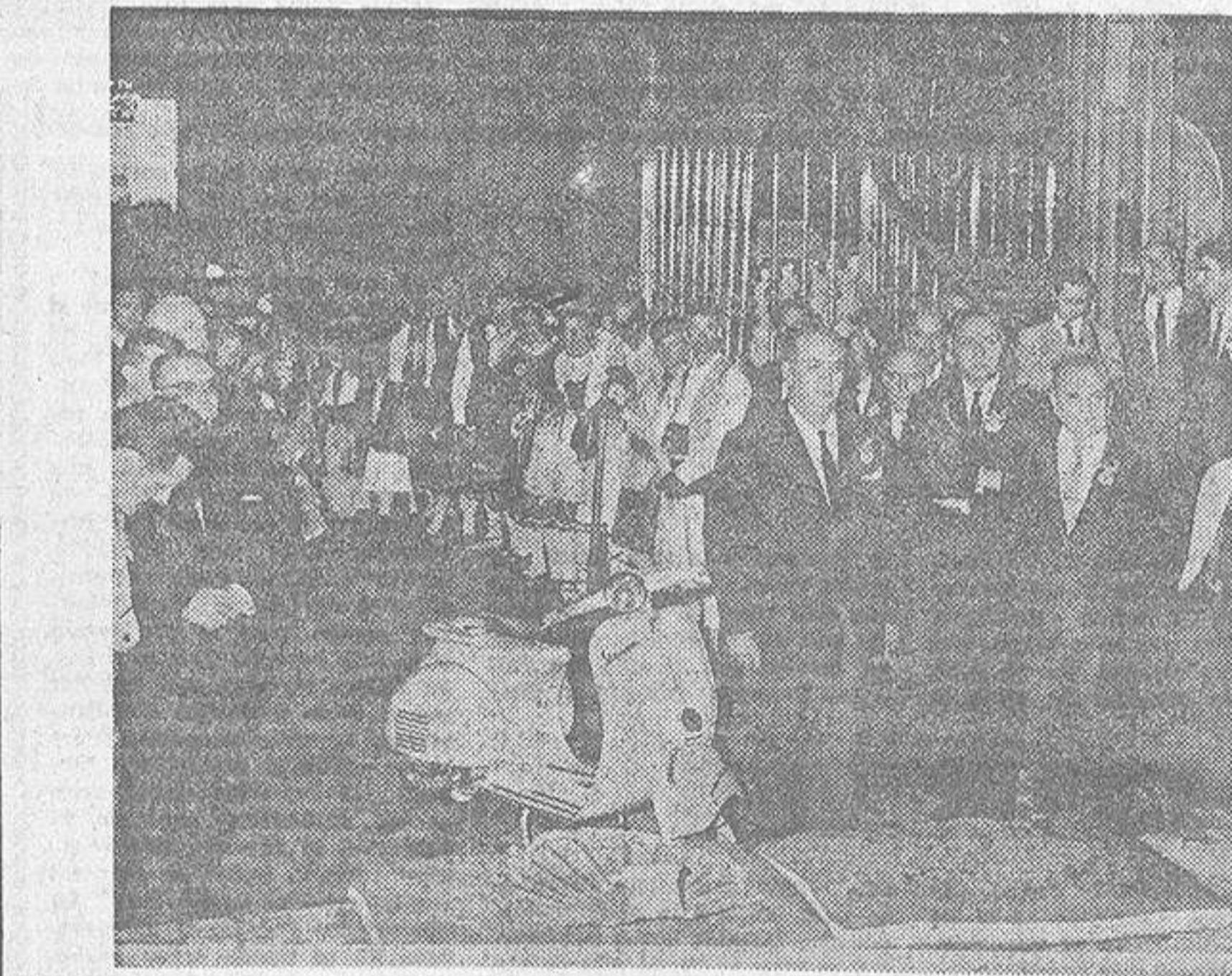
La peregrinación, en el interior de la Basílica compostelana

marqués de Quantotó, director general de «Moto Vespa», y al que España debe tanto, ya que ha hecho mucho porque Europa conozca España y la admire gracias a la organización de concentraciones vespistas a escala europea que fueron posibles gracias al apoyo y empuje del doctor Pellegrini. Junto a ellos, y frente a los mil vespistas arrodillados, estaba la Vespa blanca de la ofrenda al Apóstol, que el Cardenal Quiroga Palacios recibió complacido y que, por su decisión justísima, habrá sido entregada por la Mitra al Párroco más pobre de la Grey Compostelana.