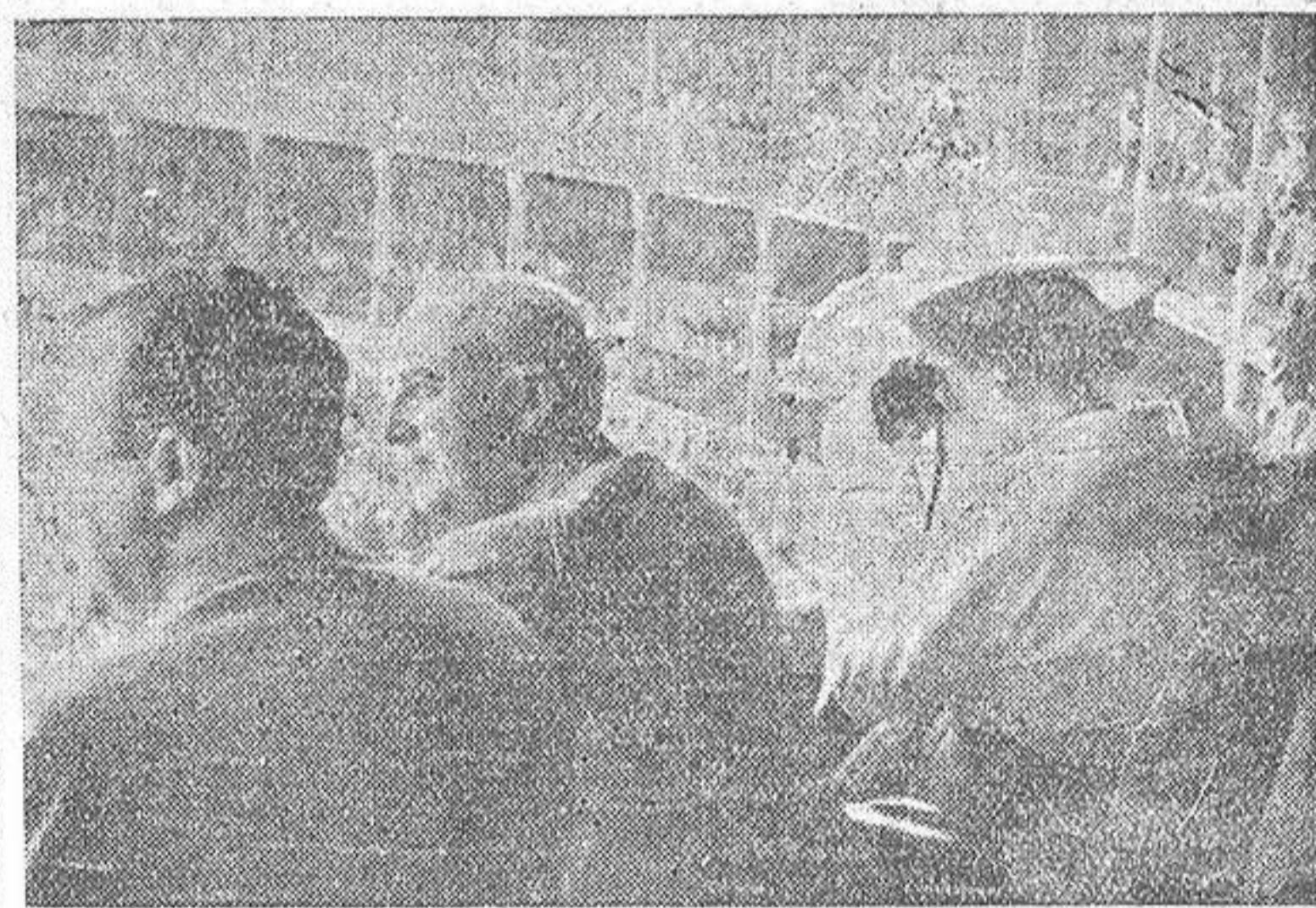
El Caudillo y su esposa, presenciando la corrida de ayer, desde el palco presidencial de nuestra Plaza de Toros

Centenares de mujeres alemanas obligadas a trabajar en las minas de Siberia