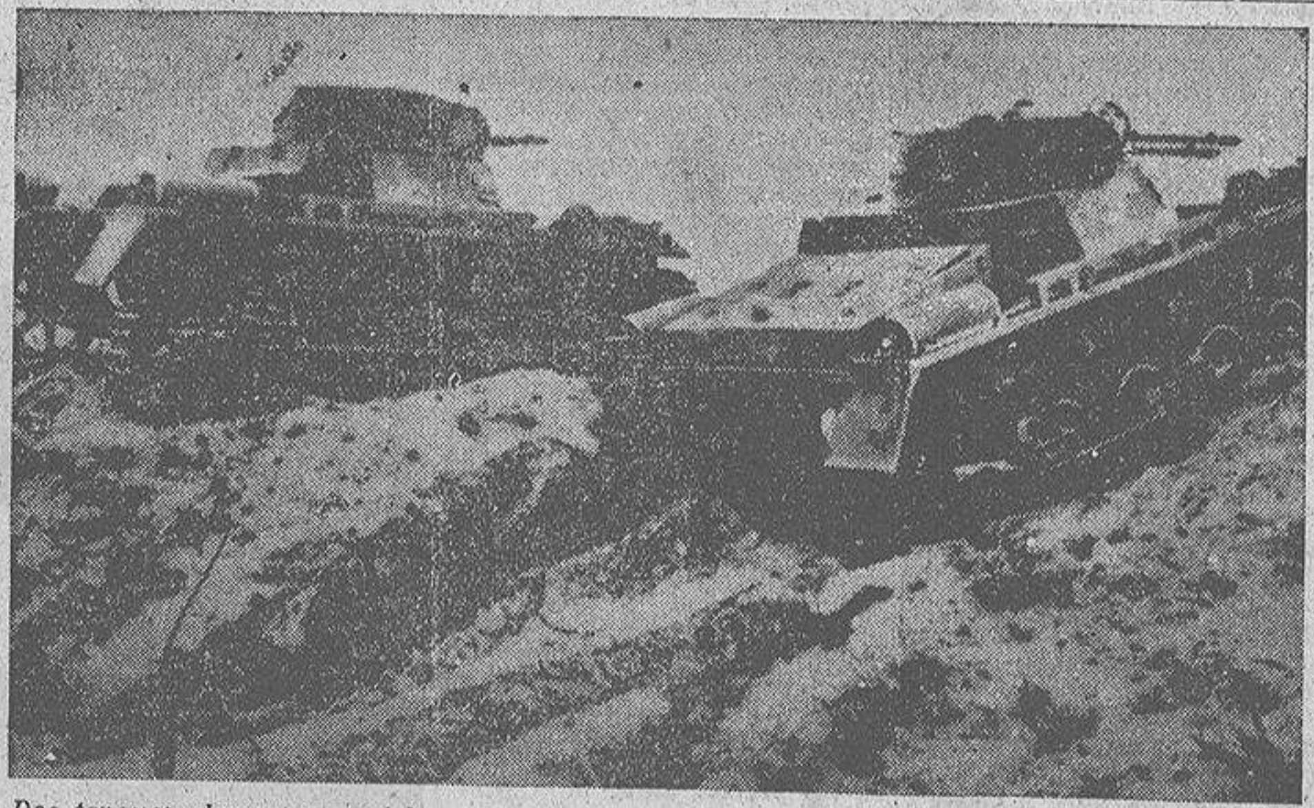
Los tanques alemanes maniobrando en el frente occidental, durante los últimos movimientos de tropas en aquella zona