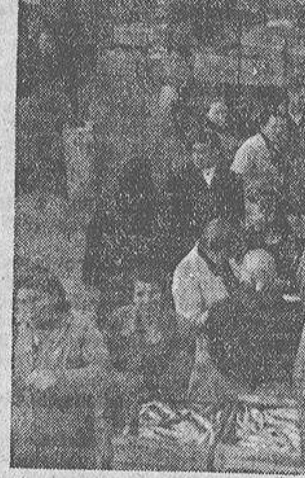
Ha comenzado la subasta del pescado y los compradores contemplan el género en espera de que llegue al precio que les conviene

ñor Ramón, y se inician las ventas de los rapés, los melgachos, las rayas, los azules, que algunos años apenas tenían valor y hoy alcanzan precios increíbles.