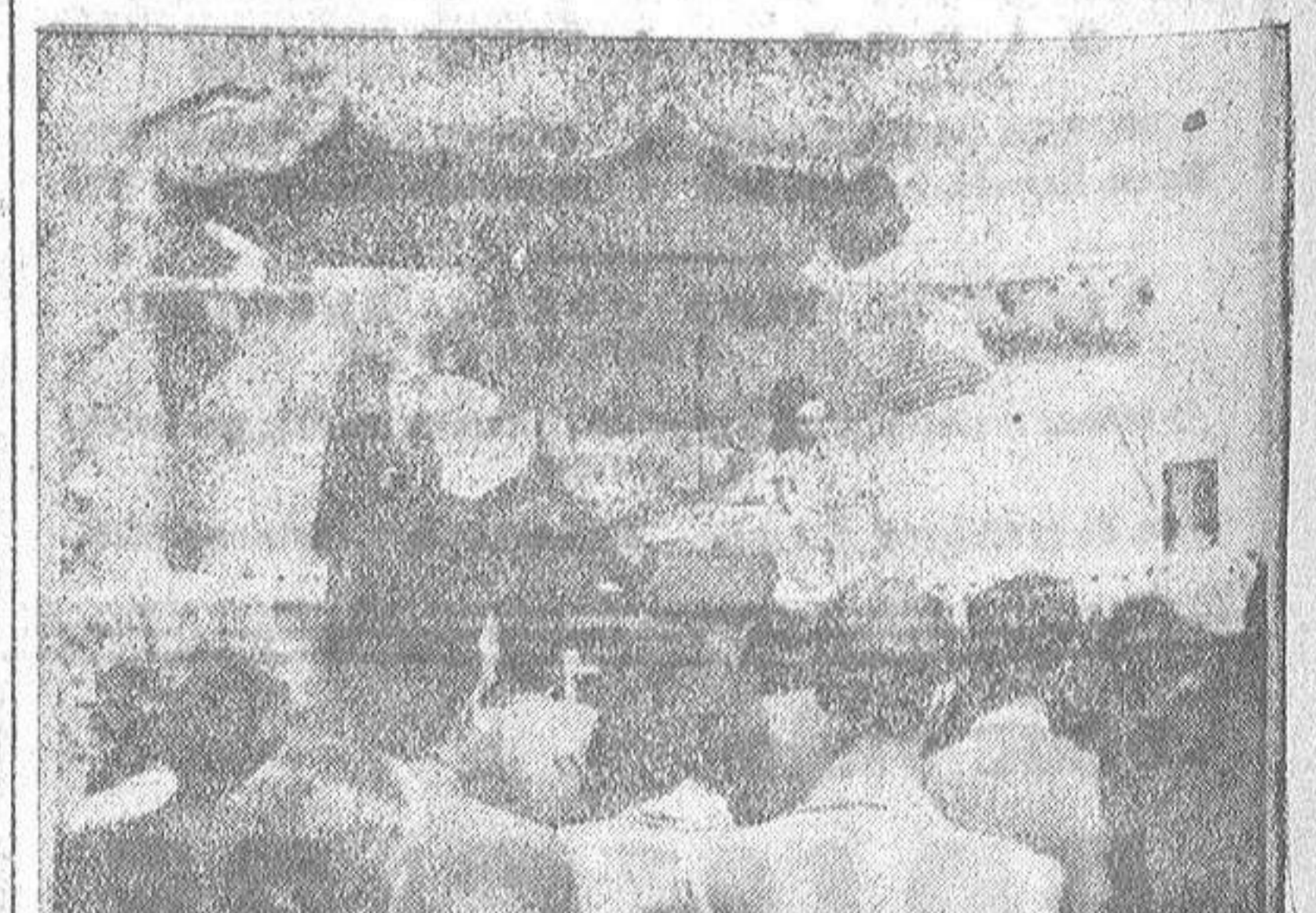
He aquí a un artista de la palabra prendiendo en sus ágiles giros la atención de un nutrido auditorio

La caza del lagarto, podría reportar grandes beneficios