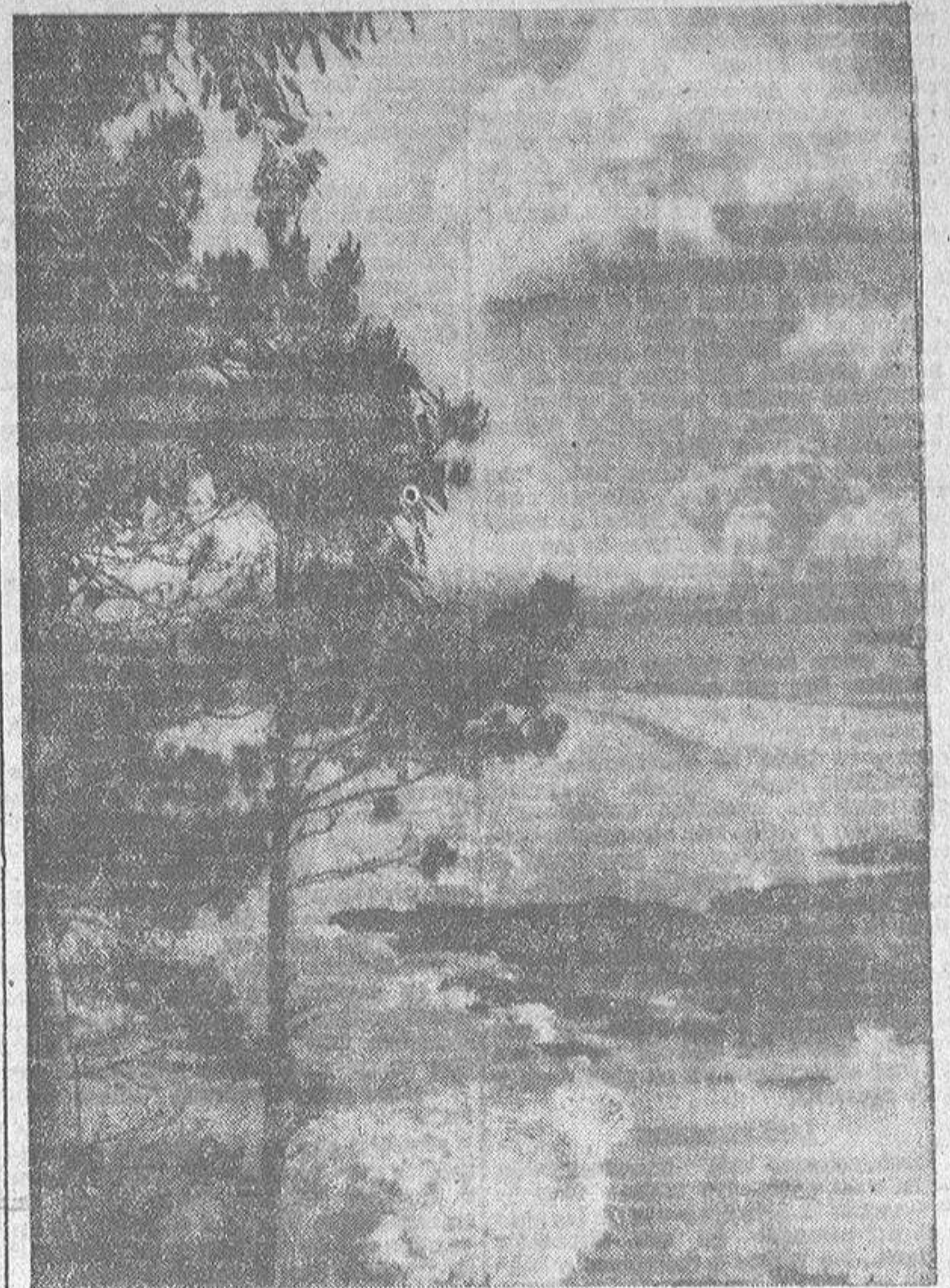
Esta armónica conjunción de tierra, mar y aire que es Galicia nos ofrece perspectivas tan bellas como la que capta esta "foto". En primer término, el no secular avanzada de nuestras inquietudes marinerías; un poco más lejos, la playa de Bastiguero, uno de los parajes realmente ensombrecidos de nuestra provincia; y al fondo, las formaciones nubosas que parecen amenazar la lídica apacibilidad del paisaje. Y algo de todo, esto encierra al alma de nuestras gentes en su amor telúrico al hogar de sus mayores y, al mismo tiempo, en el ansia de conocer nuevas tierras y de plasmar la retina con mundos de maravilla