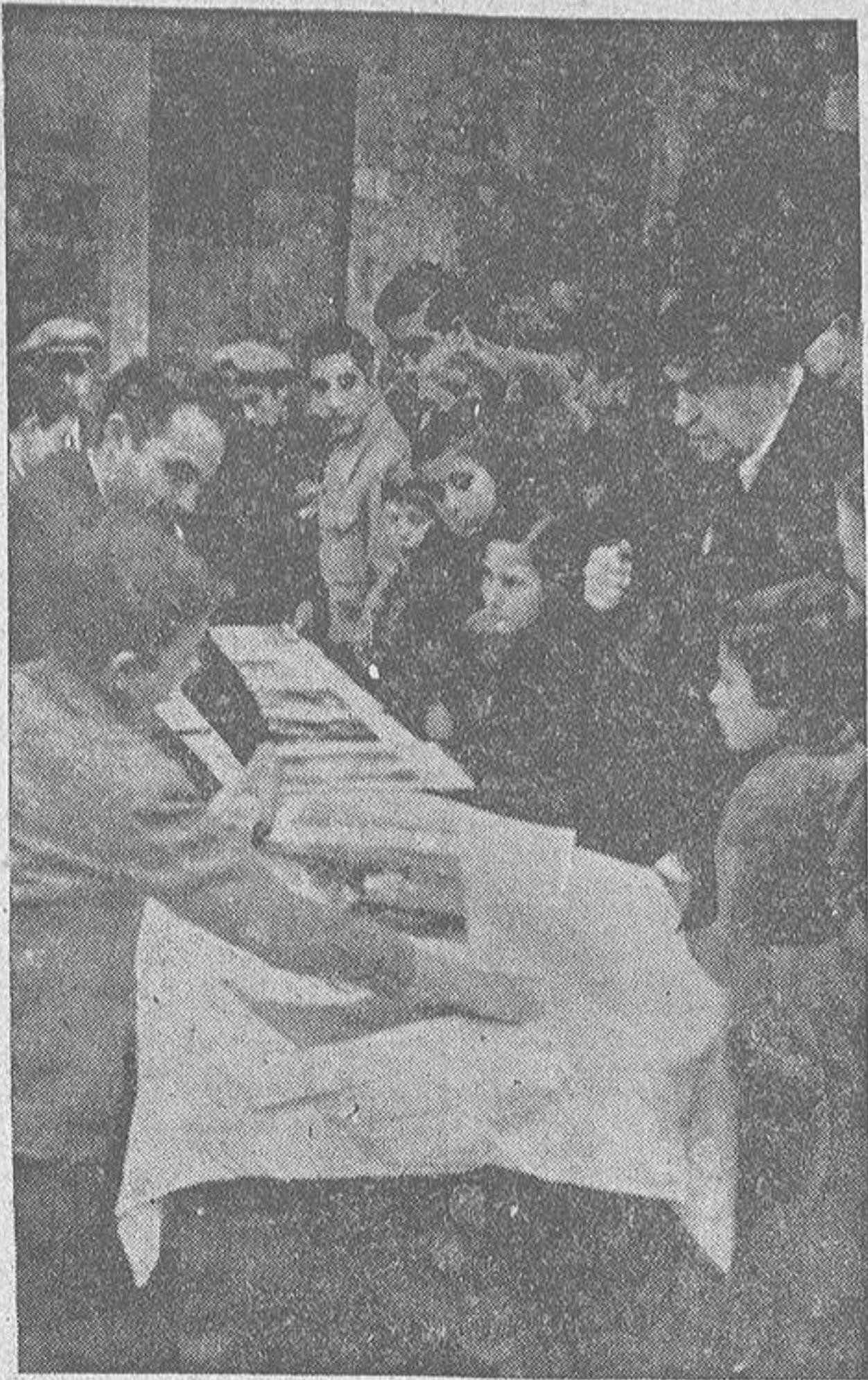
El fervor patriótico con que Barcelona entera se ha incorporado a la España de Franco, se asoma inconfundiblemente a los detalles más pequeños. Tal es el de los puestos establecidos al aire libre para la venta de retratos de Caudillo y de los hombres más representativos de la nueva España, así como de emblemas del Movimiento; retratos y emblemas solicitados, como nuestra fotografía demuestra