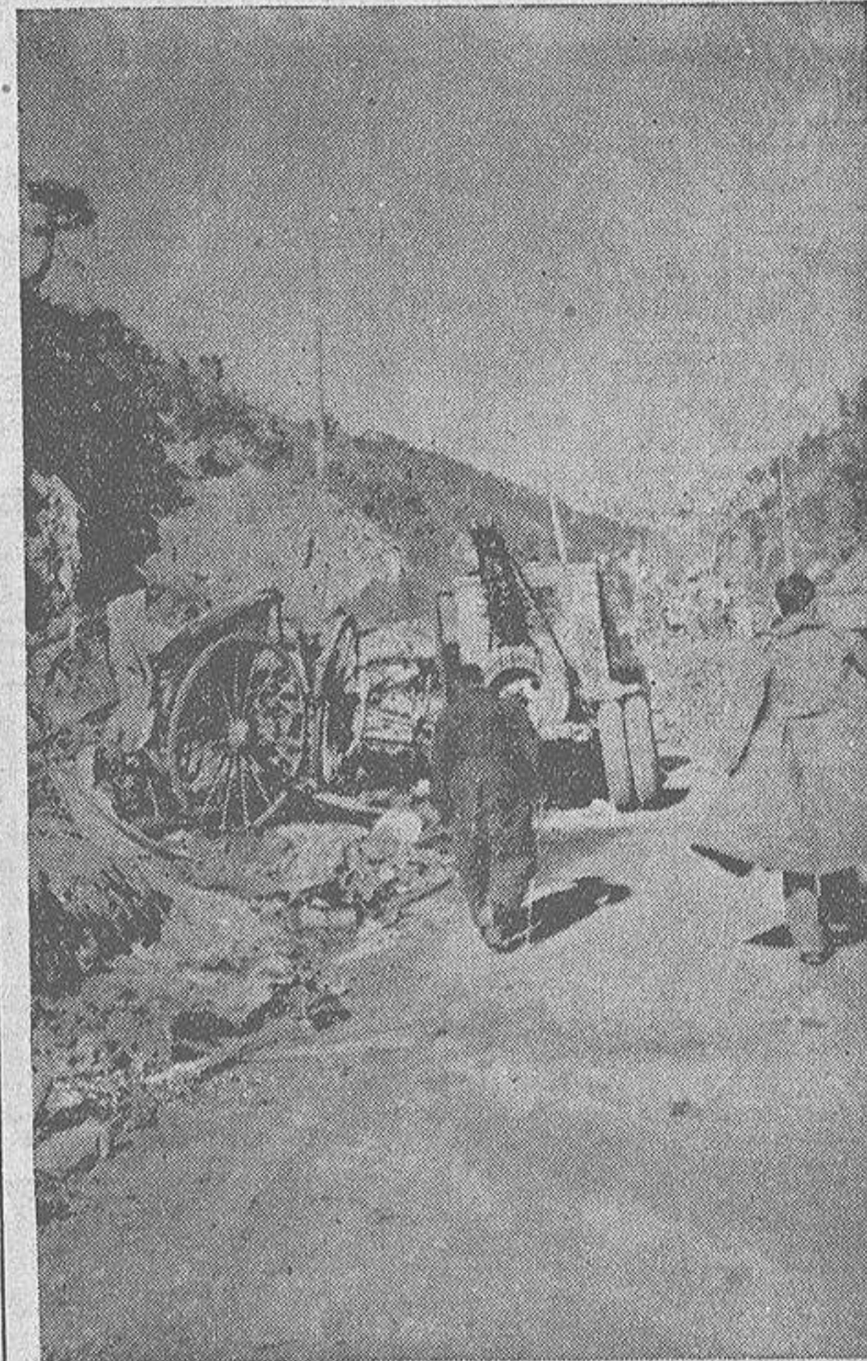
Todos los caminos y carreteras de Cataluña que conducen a la frontera francesa se hallan aun sembrados de material de todas clases abandonado por los rojos en su desordenada huida.

Lea todos los lunes «La Hoja Oficial» de La Coruña