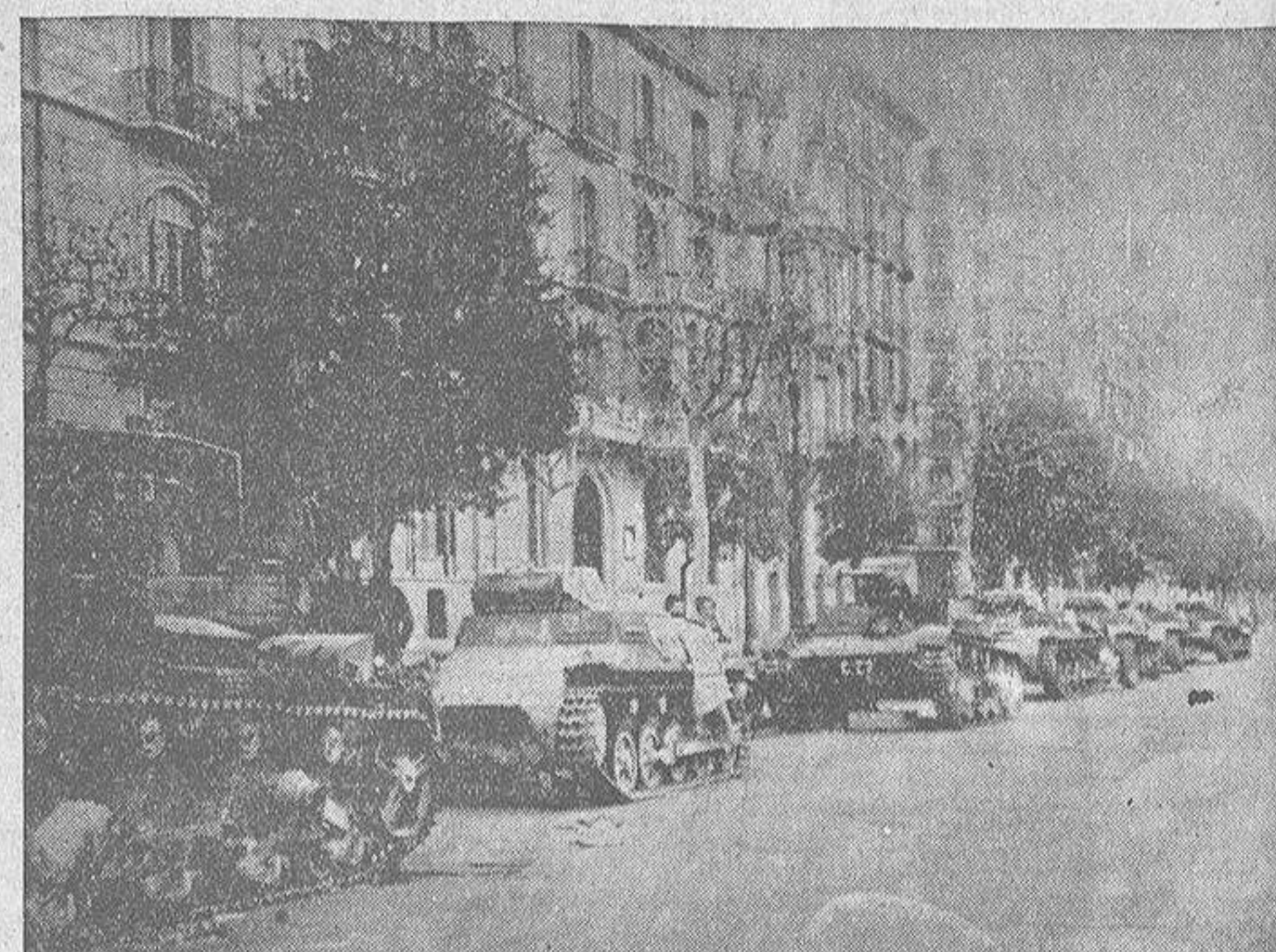
Cargos de combate del Ejército nacional en la Gran Vía Diagonal de Barcelona, después de su heroica y brillante actuación en la reconquista de Cataluña