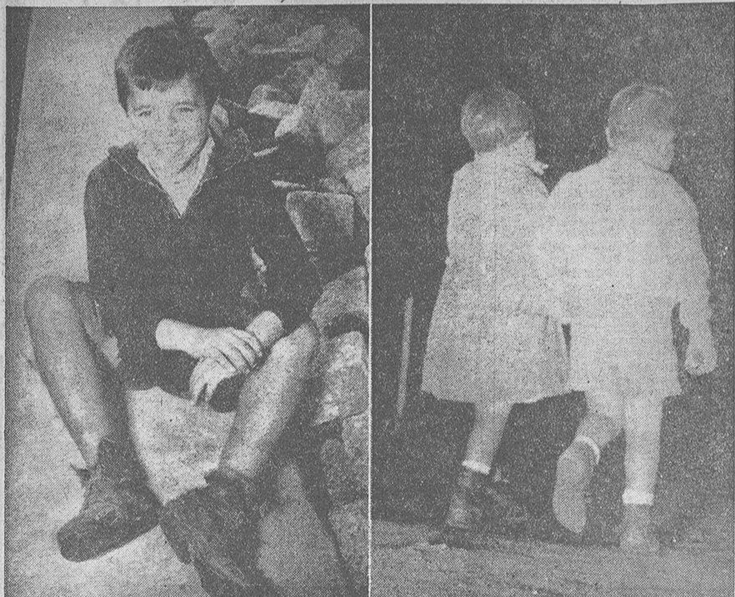
Envueltos en las sombras de la noche, inician el retorno a su hogar estos niños que aparecen en la foto de la derecha. No les asustan las tinieblas ni el largo camino a recorrer. ¡Pobrecillos! Están acostumbrados. El otro aspecto, nada más idéntico a cualquier fotograma de "Ladrón de bicicletas. Pero este rapaz, es coruñés y ¡qué caramba!, "puede ser" un artista formidable.

Piensa ser "as" del fútbol, y actualmente pide limosna Por Rubén Sanjulián