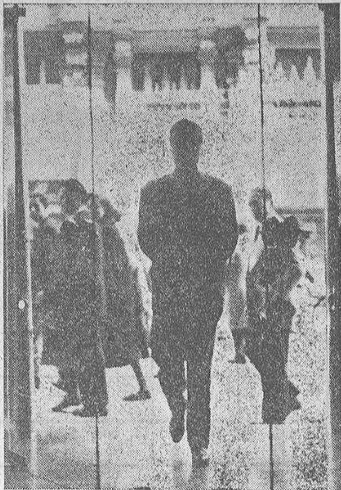
La entrada a una tienda o un hotel importante puede ofrecerle la sorpresa de que las puertas se abren ante usted sin que nadie las accione. Se trata de un sencillo sistema de combinación de células fotoeléctricas

Como este señor resultó simpático, probamos varias veces el invento. Tiene algo que conviene vigilar. Se abre siempre hacia dentro, entre usted o salga; pero de tal forma y rapidez que jamás le da en las narices. Pueden verme en la fotografía y es lástima que en el periódico no se distinga muy bien. Una advertencia: si son un poco cohibidos no entren en esta tienda para ver este "milagro" porque lo más barato allí