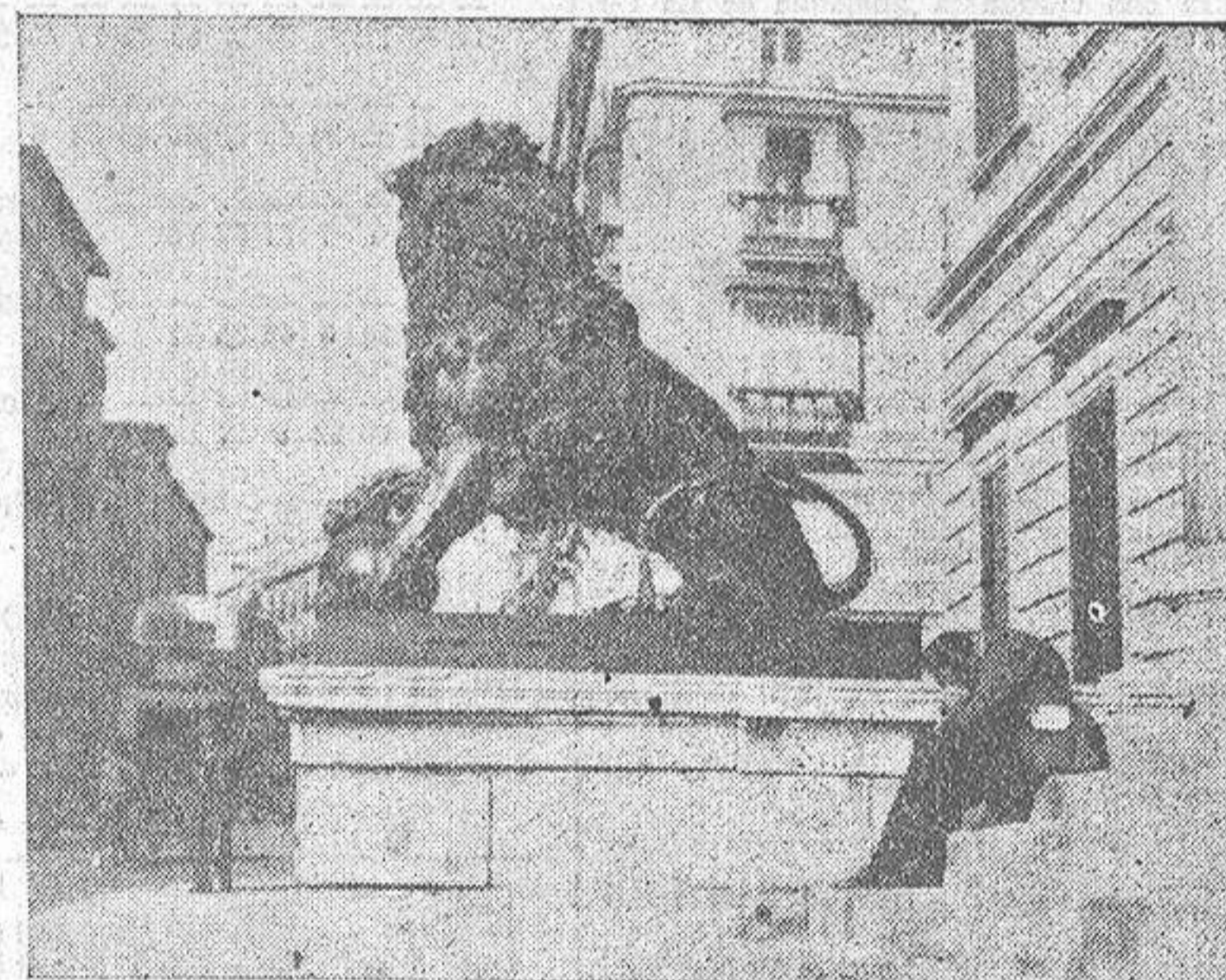
Un hombre toma el sol en las escaleras del Congreso, ajeno al fotógrafo, a los transeúntes e incluso al lugar. No saca la cabeza de entre las manos. Enfrente, a poco más de quince metros se desenvuelve el mundo tan distinto del Hotel Palace

—Señor, ¿cómprame esta máquina de afeitar... Está nueva... Si no la