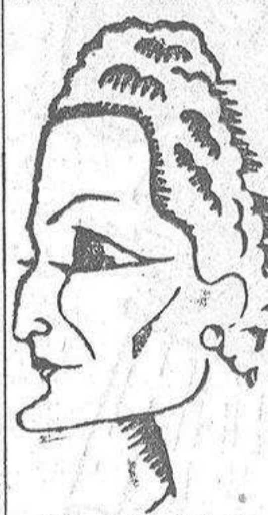
Irene López Heredia