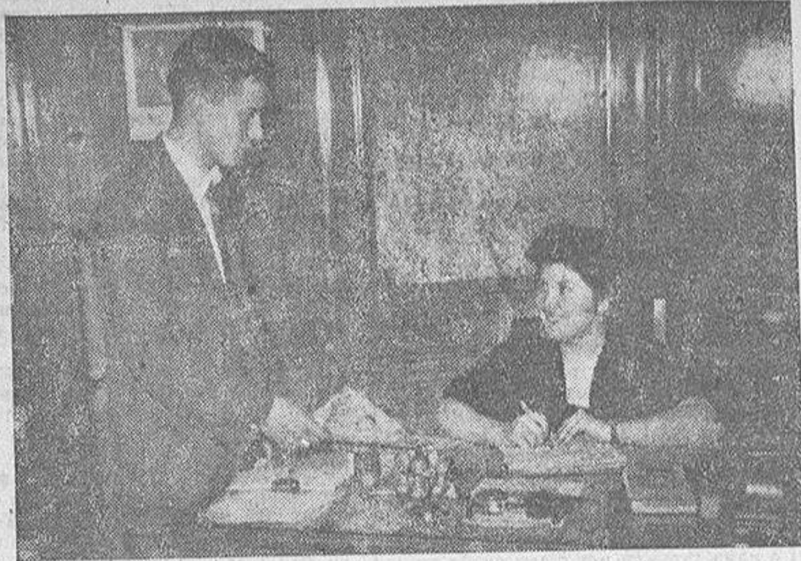
La mujer trabaja. Da lo mismo que se trate de una oficina, de una Embajada, de un periódico o de un taller de costura. La mujer ha demostrado que es útil para todo, y ha logrado equipararse al hombre en todo.