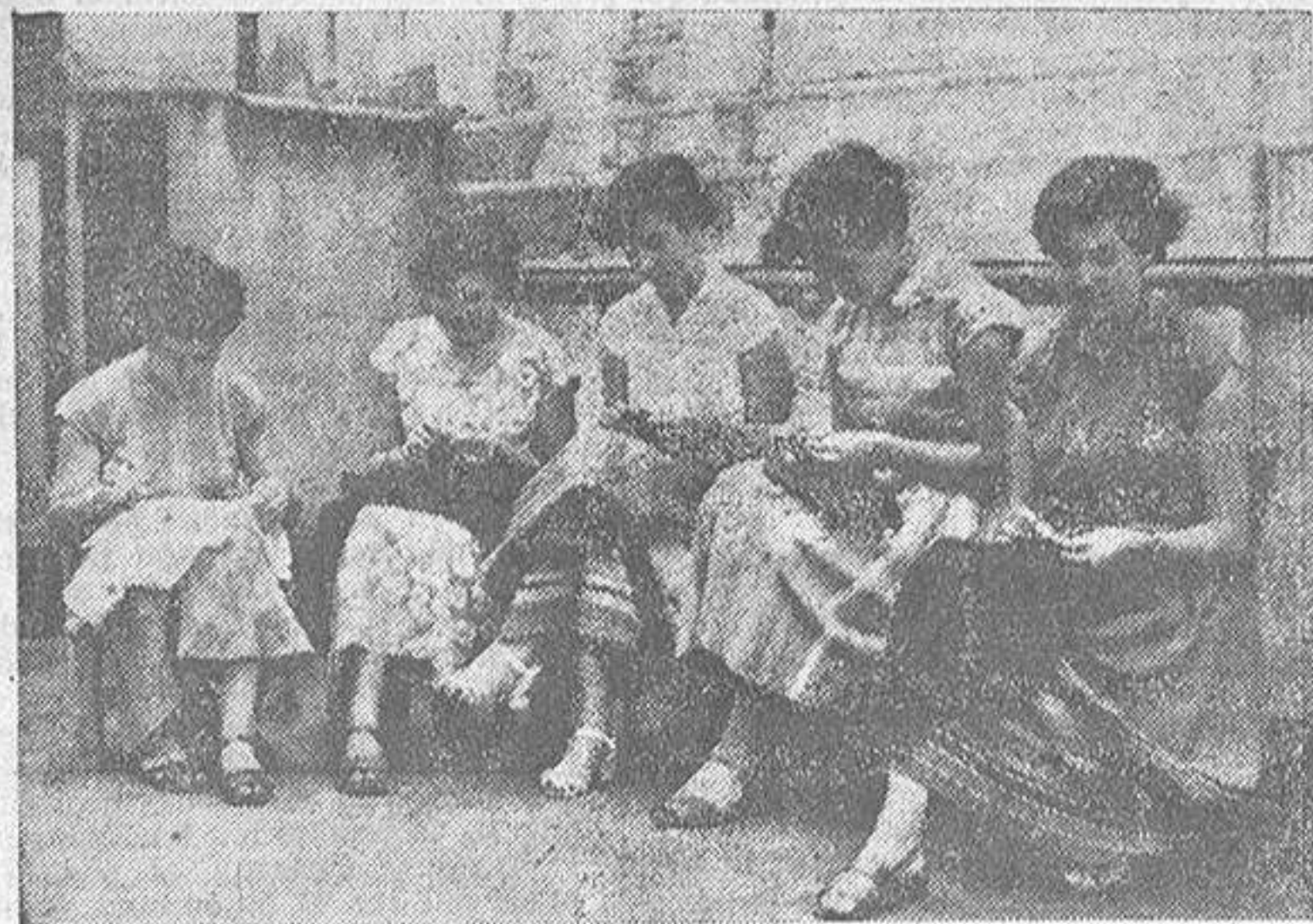
Estas jovencitas se preparan para el día de mañana. Hay que hacerse buenas esposas. ¿Si no se sabe dar una puntada, cómo se le coserá la chaqueta al esposo para que vaya a la oficina? (Foto Blanco).

Las encuestas están de moda. Y, por tanto, en esta ocasión, habíamos pensado hacer un reportaje que dejase contentas a las mujeres. Siempre es bueno llevarse bien con ellas. Creo que todas me darán la razón. ¿El tema? Fácil --pensamos--. Sólo una pregunta: