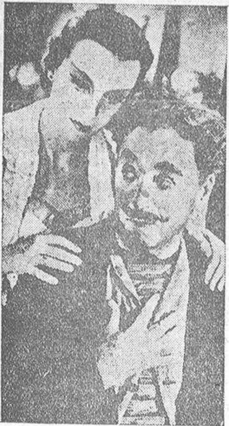
Chariot en una escena de su última película "Limelight"