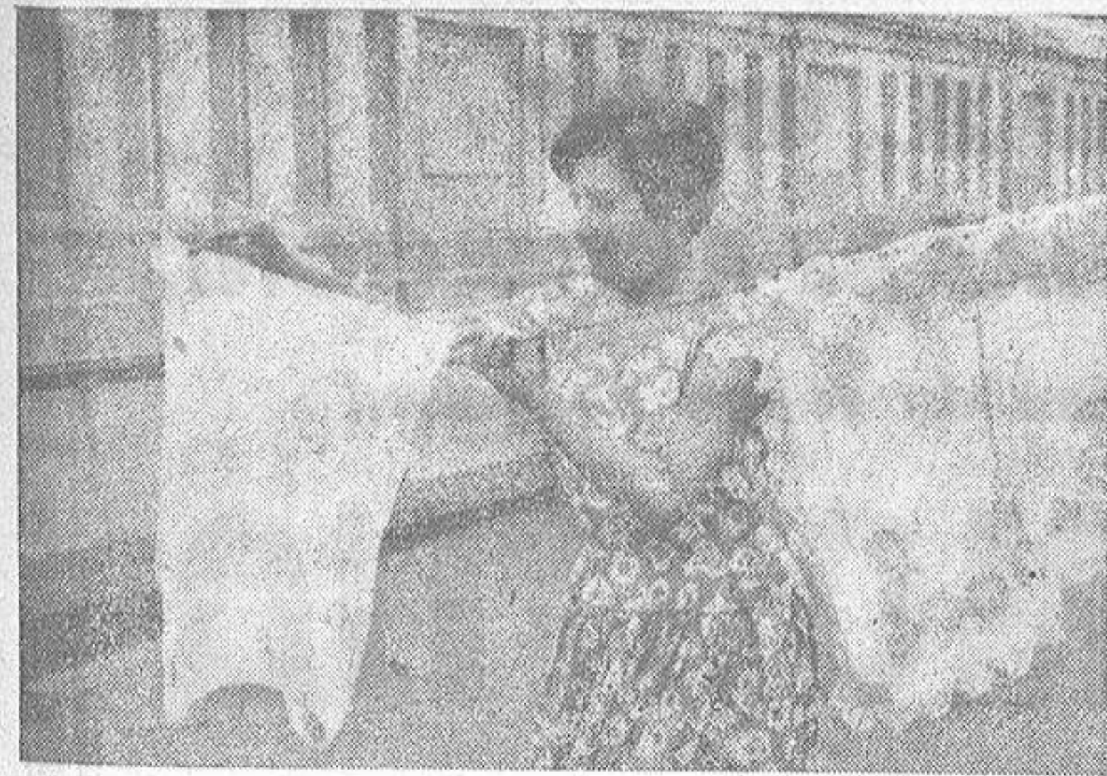
Y en este grabado podemos observar el prototipo de la mujer. Trabaja en casa y para su casa. Cuando rellene un documento que a ella concierne, pondrá, sin duda, el antiguo requisito: "ocupación. Sus labores".

(Reportaje de Eugenio Pontón en octava página)