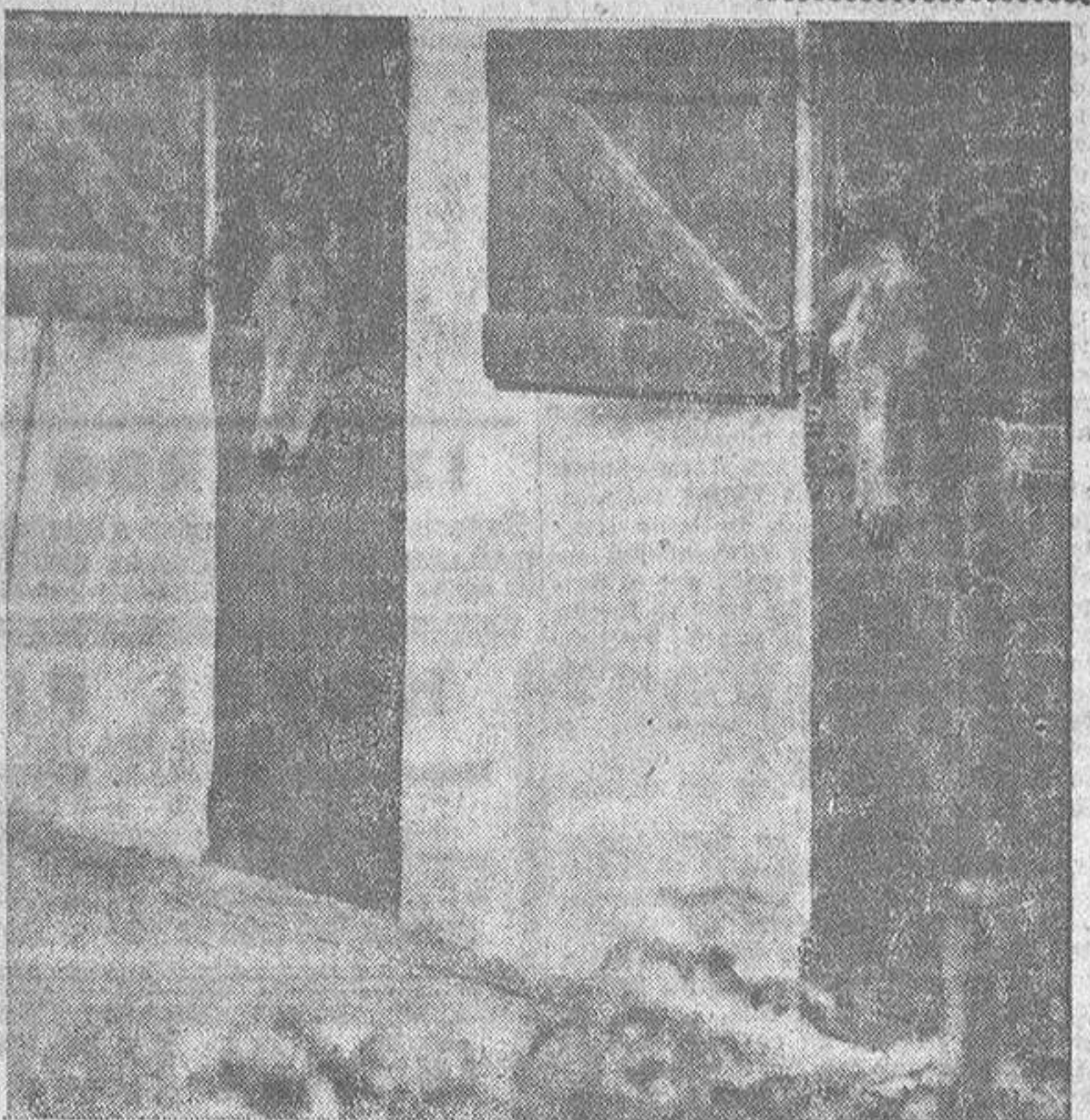
El 16 de julio último el caballo "Francasa"—a la derecha, en la foto—ganó inesperadamente una carrera en el hipódromo de Bath, proporcionando ganancias fabulosas—diez a uno—y pérdida de centenares de miles de libras esterlinas a los organizadores de las apuestas. Una rotura extraña en el cable telefónico impidió a éstos enterarse a su debido tiempo de que el papel "Francasa" estaba subiendo vertiginosamente en toda Inglaterra y que las apuestas de diez a uno había que rebajarlas a dos a uno. Esto les hizo entrar en sospechas. Una investigación policíaca mostró que el caballo que había corrido en la carrera era el "Santa Amaro"—a la izquierda en la foto—idéntico a aquel y comprados juntos por una banda de estafadores en Francia. La lucha entre esta banda y otra que pretendió ganarles por la mano puso a 1 a policía en la pista de la estafa. Hubo que tomar incluso las huellas "digitales" de ambos caballos. -- (En octava página)