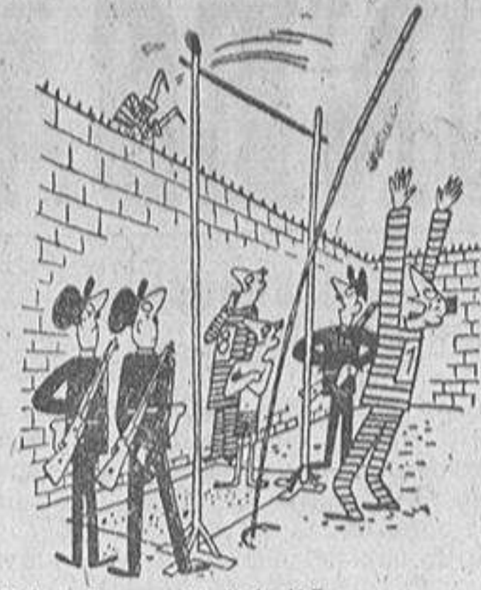
Récord mundial batido...