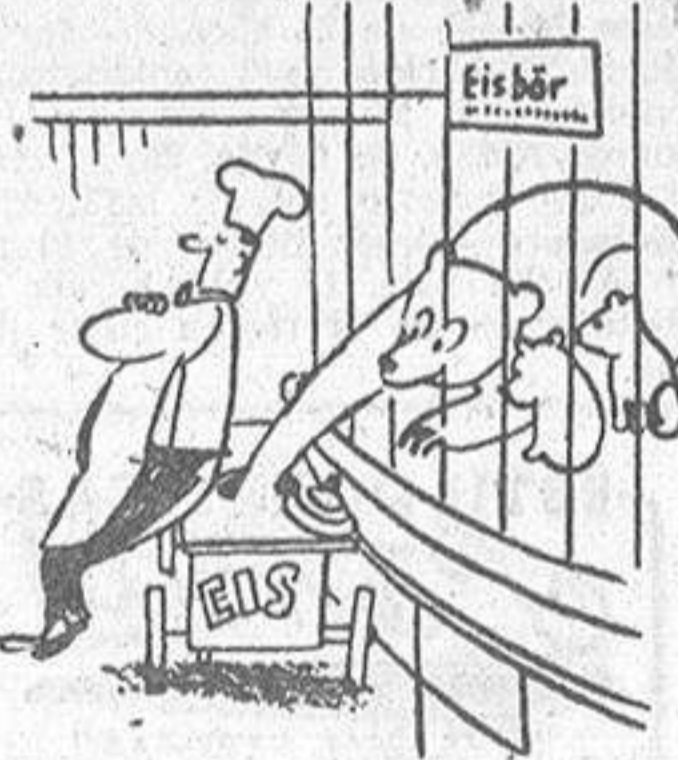
--Hijos míos, por fin vais a probar lo que es hielo.