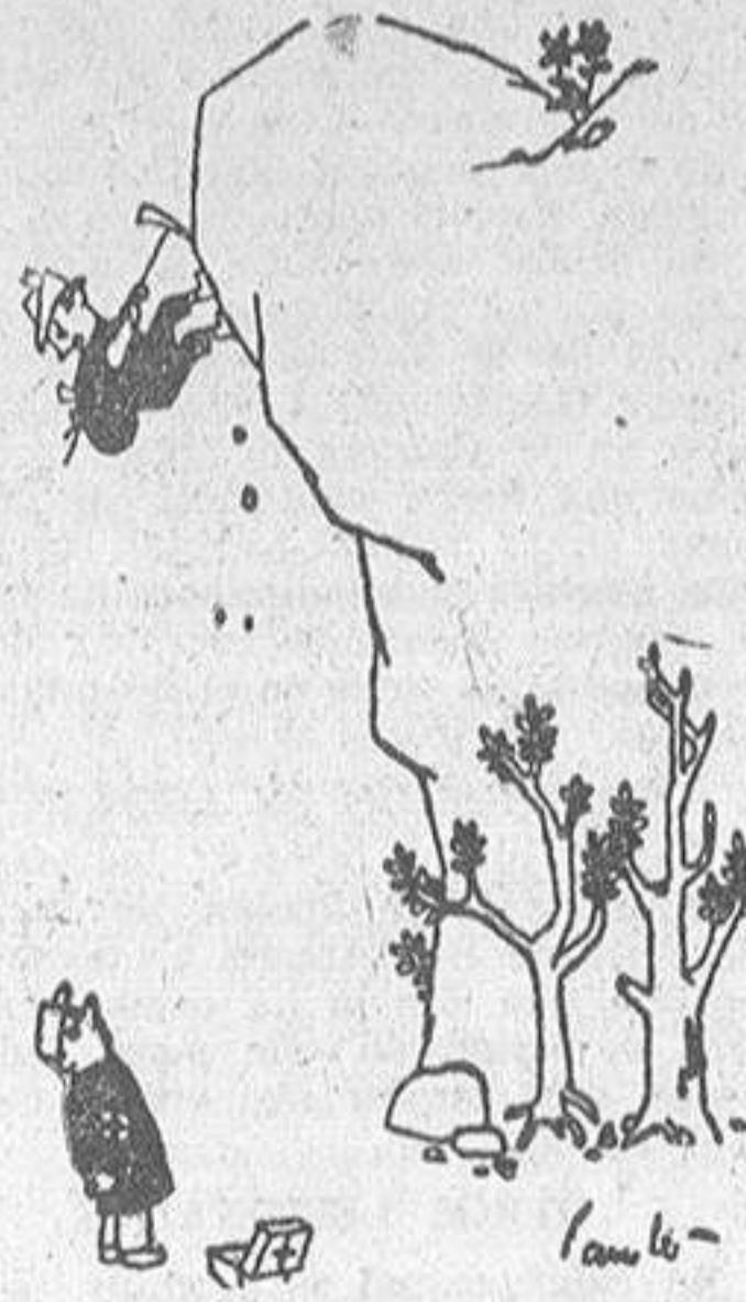
--No se obstine usted más, que me está poniendo nervioso.