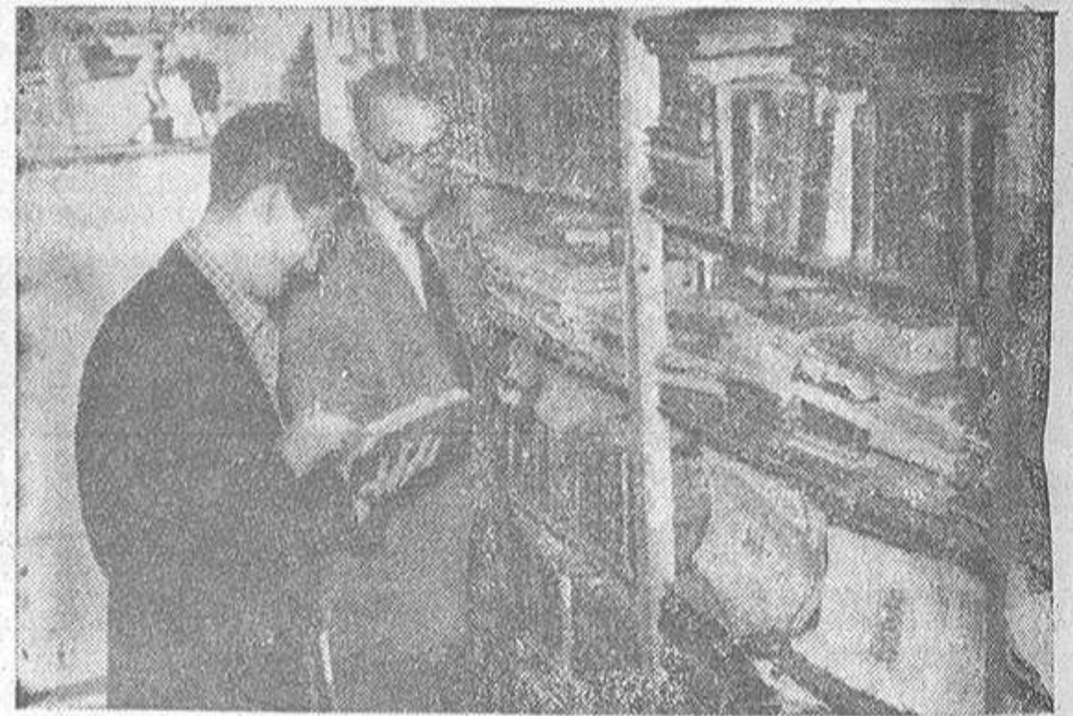
El librero pone gesto medio de extrañeza ante la presencia de un joven en busca de libros antiguos. También los hay, aquí, modernos; pero no existe la literatura intrascendente, aunque quizá el joven no piense en ella...