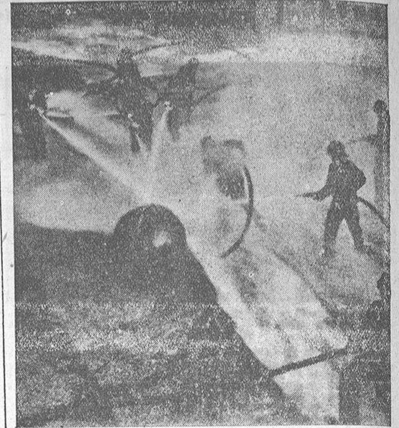
En Essen—Alemania Occidental—, los bomberos han celebrado su tradicional partido de “fútbol acuático” a mangazos. Provistos de trajes de agua, cascos y gafas y enarbolando mangas de agua a presión, se dividen en dos equipos y a fuerza de lanzar chorros de agua capaces de derribar a un hombre, empujan unos y otros un enorme balón hasta conseguir adentrarlo en la portería del contrario, donde otro bombero intenta rechazar la pelota del mismo modo. El partido terminó con 2-1 a favor del “Deportivo” de Essen, y los jugadores y el campo quedaron cubiertos de barro