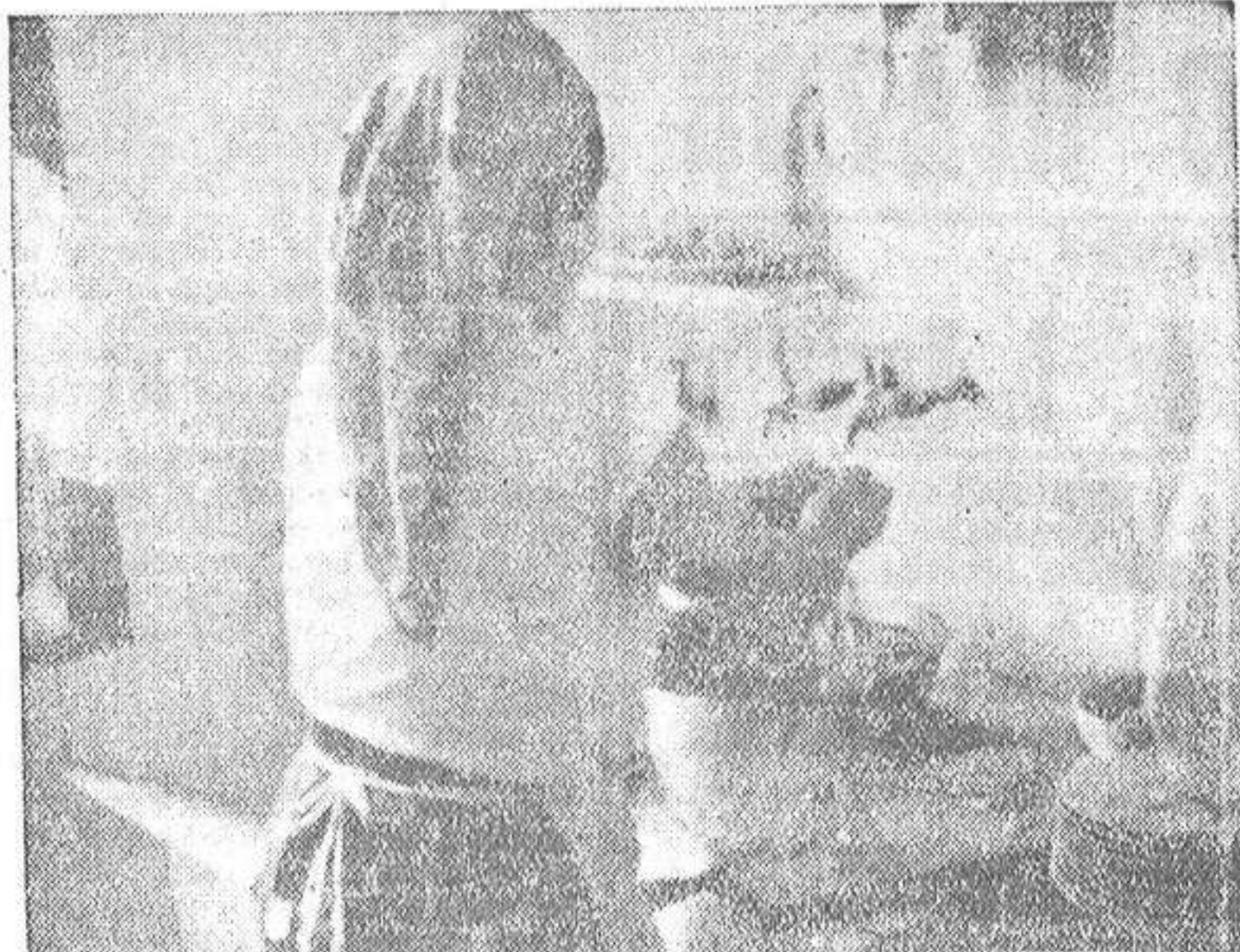
Esta reina del fogón, rellena y laboriosa ella, parece proclamar con su actitud la injusticia de las señoras de echar pestes del servicio doméstico.

—¿De malo? Pregunta mejor si tiene algo de bueno.