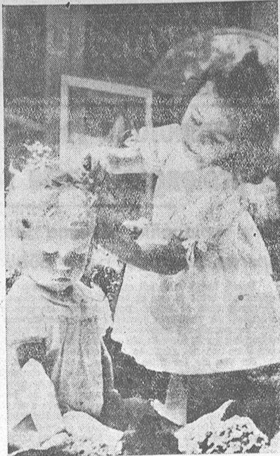
El tomar el servicio doméstico como un fuego, no está del todo mal. Aquí tenemos a una piquetada que peina a su hermanito, mientras imita lo que tantas veces ve hacer a la menegilda.

—Puntalicemos, señora. ¿Qué es lo que tiene de malo su criada?