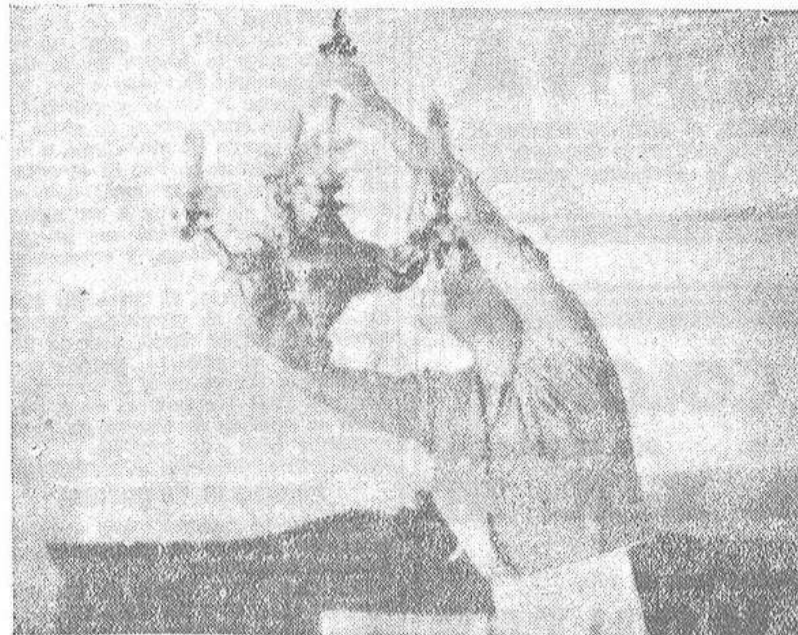
"Como están las señoras... parece decir esta fámula mientras le quita el polvo a una lámpara.

(Reportaje de Luis Caparrós Muñoz en octava plana)