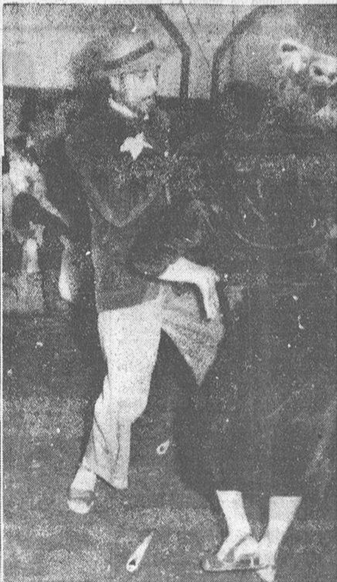
En esta información gráfica facilitada por "Foto Ferreiro", se recogen dos momentos de una de las "zambras" que de vez en cuando organizan los "calés" residentes en La Coruña. Ante el micrófono, y acompañado a la guitarra, un "churumbel" ya crecido se arranca por bulerías, mientras la pareja balla flamenco entre palmas, ¡olé! y cañas de manzanilla, cosas todas en las que los gitanos son "catedráticos", porque de eso saben más que "naide"

Hablar de gitanos en Granada, en Sevilla u otra parte de Andalucía, es cosa corriente; pero si se nombra a los componentes de esa raza haciendo referencia a La Coruña, entonces puede extrañar a cualquiera.