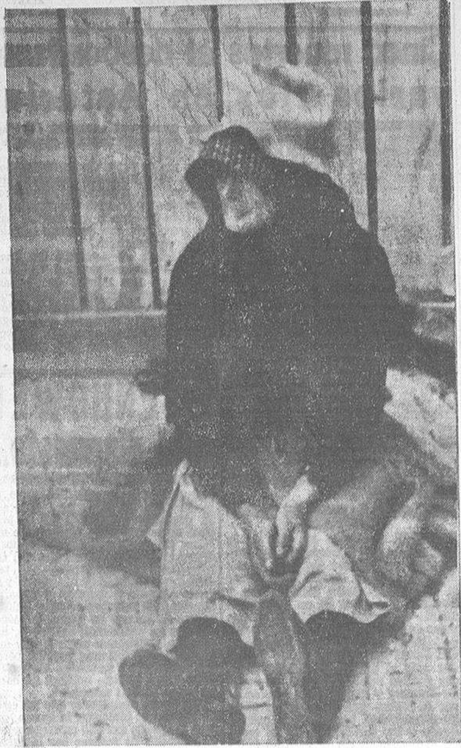
"¡Una limosna, por el amor de Dios!", dice esta anciana, y repite, monótona, una y mil veces a cada viandante, que en la mayoría de los casos pasará indiferente, y en otros, o le dejará cinco céntimos o, rebuscando en los bolsillos, le dirá: "No tengo suelto, señora. Dios le ampare". (Foto Blanco).

¿Quién dijo que La Coruña era una de las capitales donde había más pobres? Para hacer este reportaje, Alberto, el reportero gráfico, y un humilde servidor de ustedes, estuvimos toda una mañana paseando.