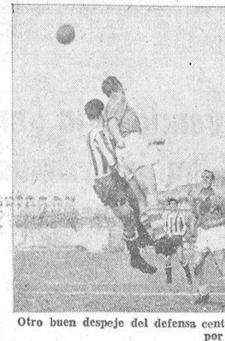
Otro buen despeje del defensa centr al olivico, que se mostró inabordable, por alto

Se despachan localidades en el local social, Marqués de San Martín, 6.