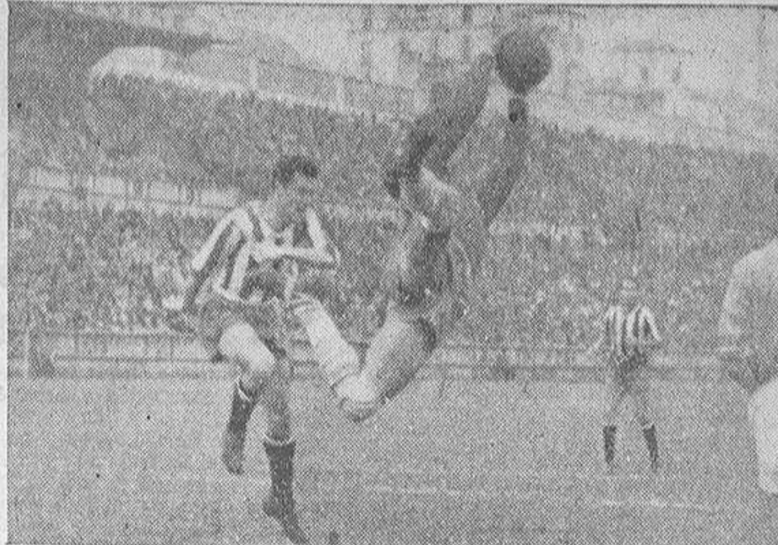
Acrobática parada del magnífico portero céltico, Pazos, acosado por Royo

carlos; mas, para mí, los dos verdaderamente garrafales fueron: el no rasar la pelota y el mantener tres defensas, dos medios y solo cuatro delanteros—cuando más hubo en la línea—durante la segunda parte.